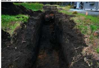
1. 4トレ (南西から)