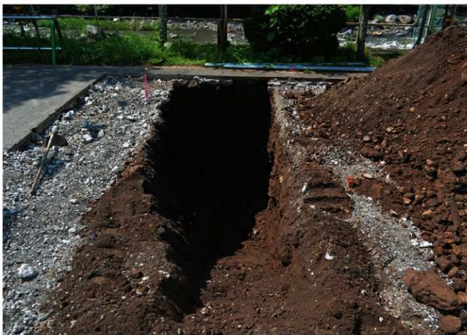
2. 羽根尾字宮原<No.1>（北から）