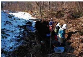
8. 作業風景 (南東から)