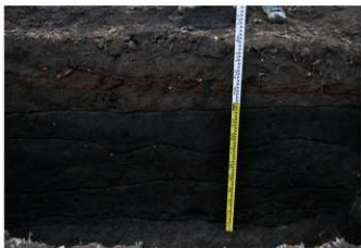
3. 4トレ土層2 (南東から)