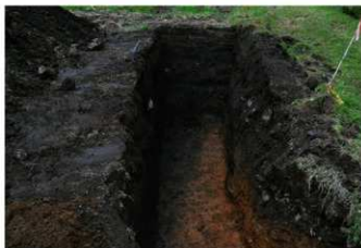
6. 3トレ北側 (南から)