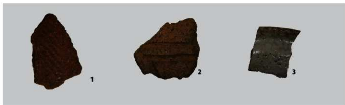
3. 東原Ⅰ遺跡Ⅳ出土遺物