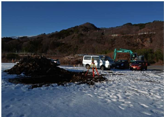
4. 西久保Ⅳ遺跡Ⅱ<1・2トレ>（南東から）