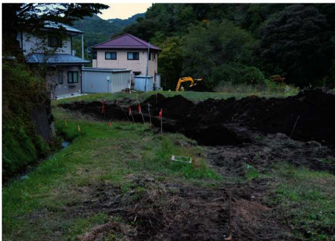
2. 大津字下平<3～5トレ> (北から)