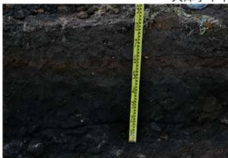
2. 4トレ土層1 (南東から)