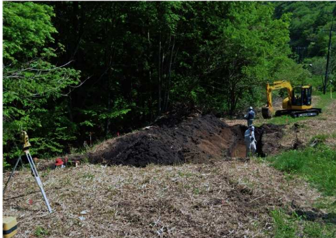
1. 滝原IV遺跡II (北から)