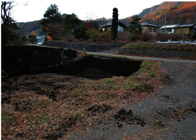
2. 東原 I 遺跡 IV (南東から)