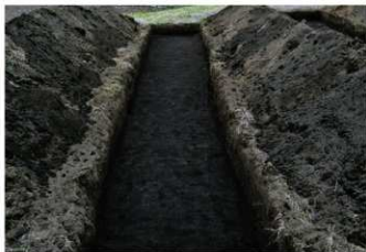
3. 3トレ (南西から)