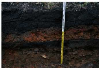
6. 5トレ土層 (南東から)