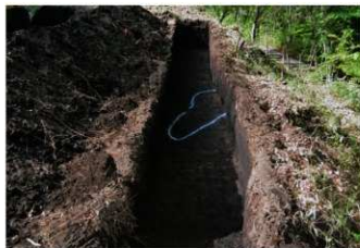
4. 2トレ (南から)