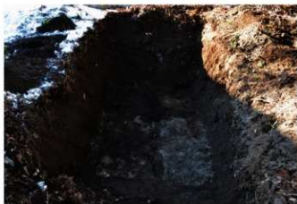
6. 5トレ (南東から)