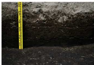
4. 1トレ土層2 (南東から)