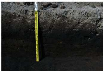
6. 4トレ土層 (南西から)