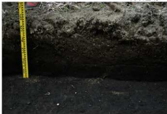
2. 2トレ土層2 (南東から)