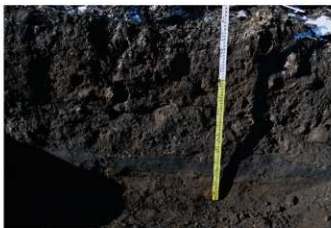
4. 4トレ土層3 (南東から)