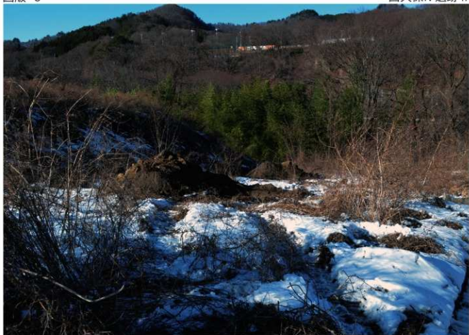
1. 西久保IV遺跡II<3・4トレ> (南東から)