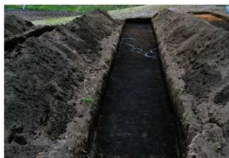
5. 2トレ (南西から)