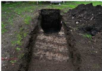
2. 1トレ (南西から)