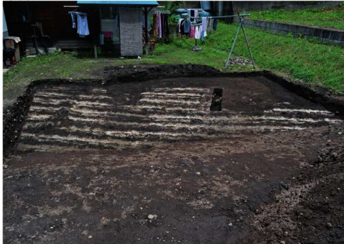
1. 町遺跡Ⅱ全景①（南西から）