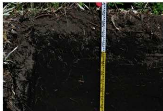
5. 2トレ土層 (西から)