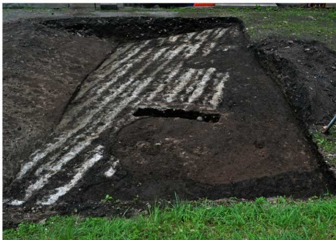
2. 町遺跡Ⅱ全景②（南東から）