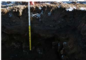
2. 3トレ土層 (西から)