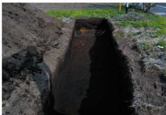
5. 4トレ (北西から)