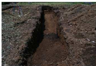
4. 2トレ (南西から)