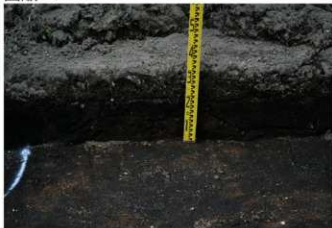
1. 2トレ土層1 (南東から)