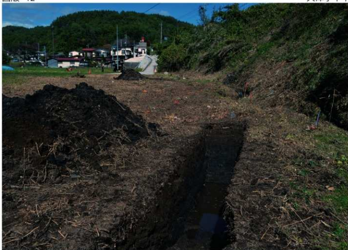
1. 大津字下平<1・2トレ> (南から)