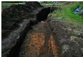
5. 3トレ (南東から)