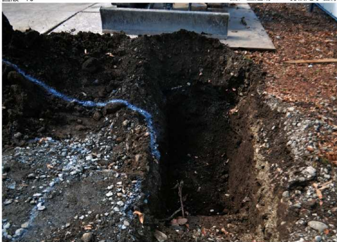
1. 西ノ上遺跡Ⅱ（東から）