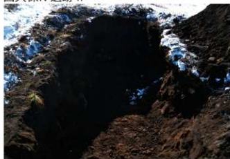
1. 3トレ (北東から)