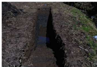
3. 2トレ (南西から)