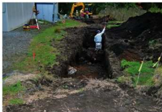
8. 測量風景 (北東から)