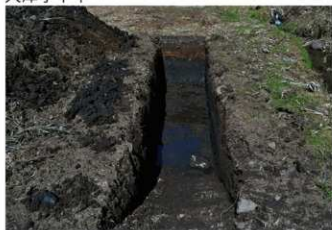
1. 1トレ (南東から)