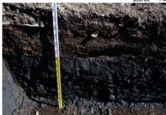
2. 1トレ土層 (南西から)