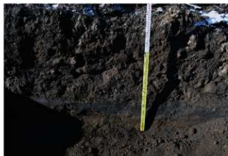
5. 4トレ土層2 (南東から)