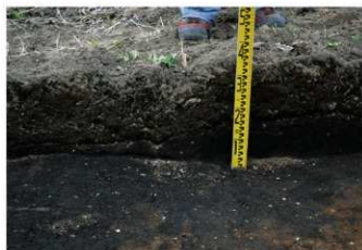
3. 1トレ土層1 (南東から)