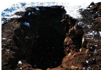
4. 2トレ (北東から)