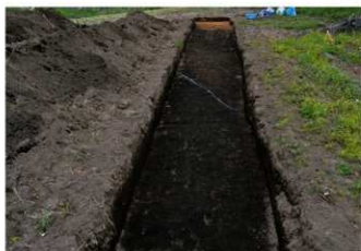
2. 1トレ (南西から)