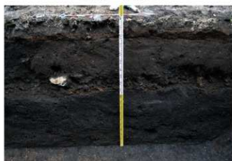
7. 3トレ土層1 (東から)