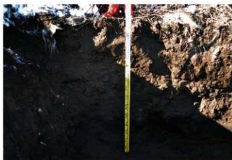
4. 4トレ土層1 (南東から)