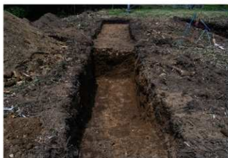
2. 1トレ (南西から)