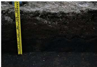
4. 3トレ土層 (南東から)