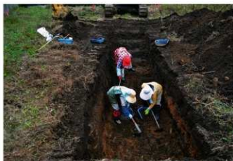
7. 作業風景 (北東から)