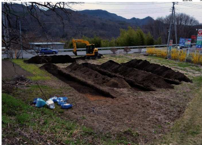
1. 坪井遺跡X (北東から)