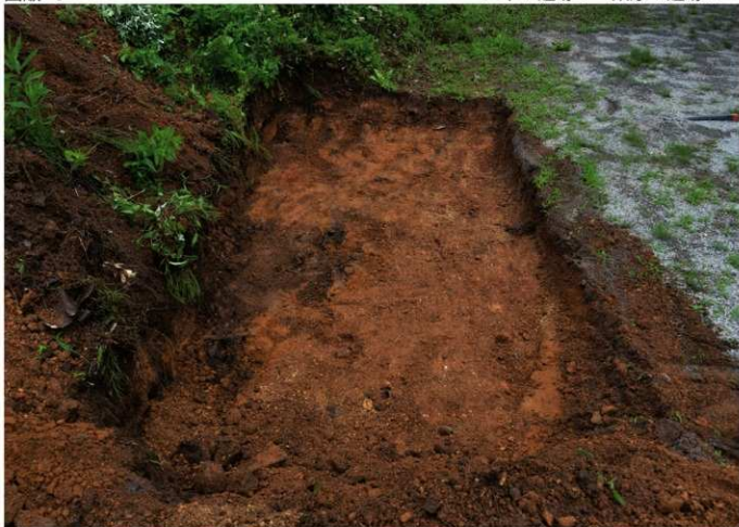
1. 三平 I 遺跡 II (南から)