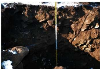
5. 2トレ土層 (南東から)