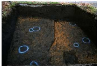
1. 調査区全景（南から）