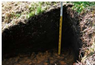
3. 1トレ土層 (東から)