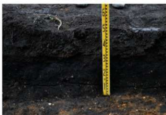
8. 3トレ土層2 (北東から)