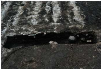
1. サフトレ (南東から)