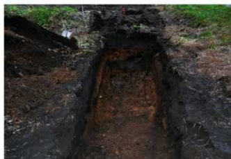
5. 5トレ (南西から)