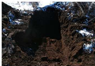
3. 4トレ (北東から)