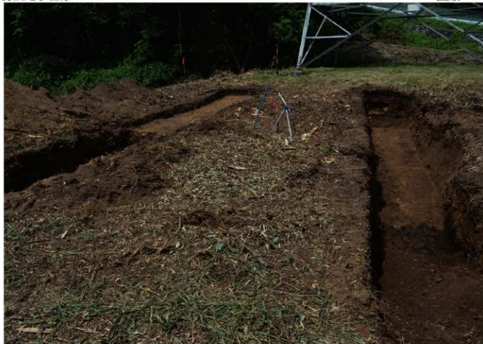
1. 羽根尾字宮原<No 50 > (南西から)