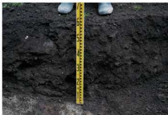
3. 1トレ土層 (北西から)