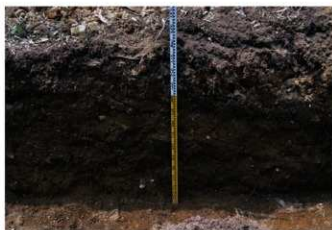
3. 1トレ土層 (南東から)