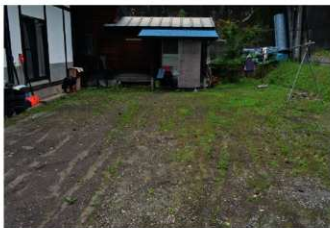
4. 調査前風景 (南西から)