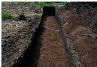
2. 1トレ (南から)