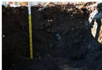
7. 5トレ土層 (南東から)