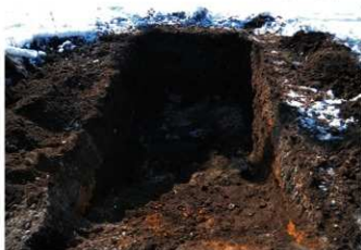
2. 1トレ (北東から)