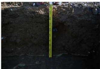
3. 1トレ土層 (北西から)