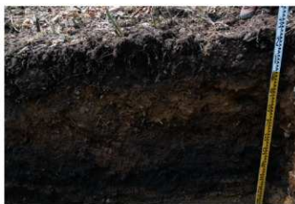
5. 2トレ土層 (南東から)