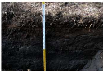
4. 2トレ土層 (南東から)