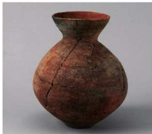
1 E区第7号井戸跡 (第320图130)