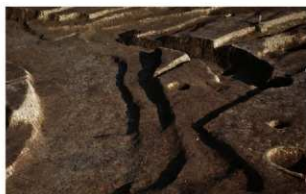
7 D区第76号溝跡、E区第2号墳(左)