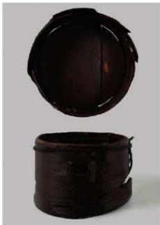
3 第35号井戸跡 (第322图18)