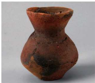
3 D区第35号周满状遗構 (第145图6)