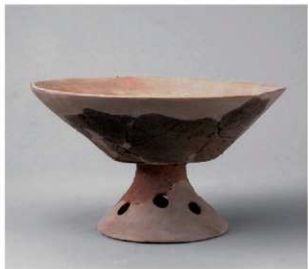
1 第27号周满状遗構 (第80图11)