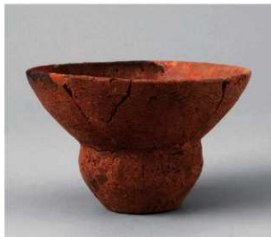
1 D区第34号周溝状遺構 (第143图11)