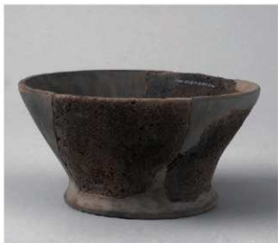
3 D区第44号周满状遗構 (第169图4)