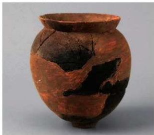
4 第28号周满状遗構 (第83图16)