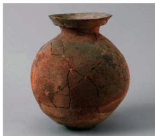
5 E区第15号周溝状遺構 (第206图1)