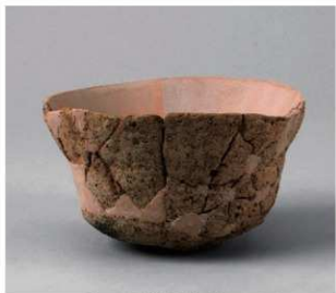
2 第28号周满状遗構 (第83图1)