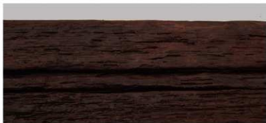
1 第9号井戸跡 (第321图11)