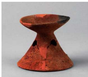
2 D区第34号周溝状遺構 (第143图4)