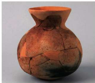
4 D区第50号周满状遗構 (第172图9)