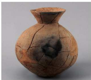
2 E区第3号井戸跡 (第319图120)