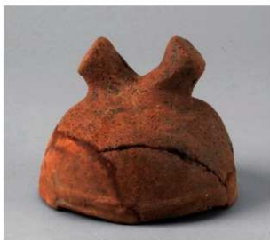
2 D区第2号埴 (第332图40)