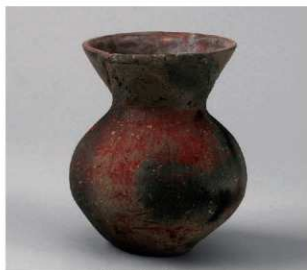
5 D区第9号井戸跡 (第314图48)