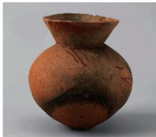
4 D区第1号井戸跡 (第313图38)