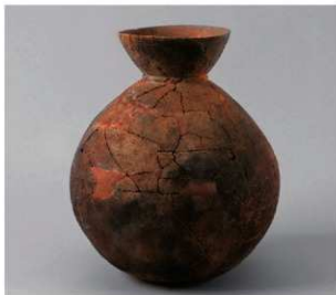
1 第5号方形周满墓(第225图11)