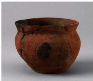
5 第29号周满状遗構 (第86图6)