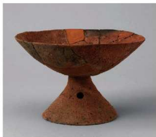
4 D区第41号满跡 (第378图43)