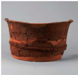
2 D区第16号溝跡 (第345図1)