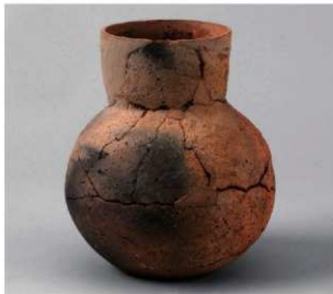
1 D区第10号周溝状遺構 (第109图4)