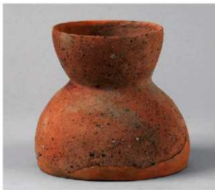
6 D区第13号土坑 (第294图7)