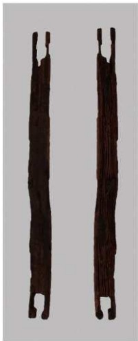
1 第9号井戸跡 (第322图12)