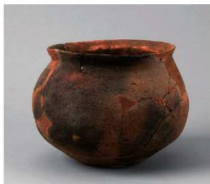
5 D区第10号周溝状遗構 (第112图49)