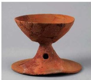
5 第5号方形周满墓(第226图21)