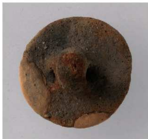
2 D区第2号墳 (第329图12)