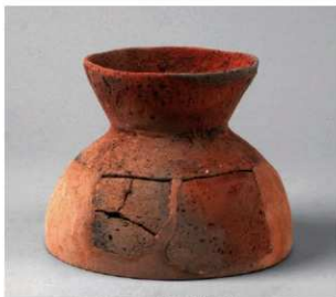
2 D区第10号周溝状遺構 (第109图6)