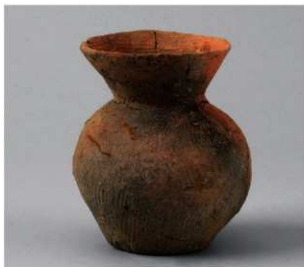
3 D区第14号井戸跡 (第315图53)