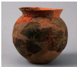
2 D区第14号井戸跡 (第317图89)