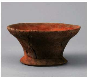
5 E区第10号周溝状遺構 (第198图3)