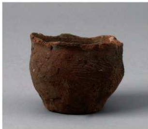
4 D区第14号井戸跡 (第315图54)