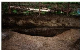
3 第2号性格不明遺構