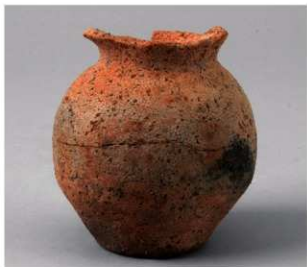
3 D区第28号周满状遗構 (第131图13)