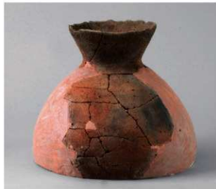
4 D区第10号周溝状遺構 (第109图10)