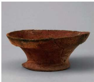
2 第1号方形周满墓 (第214图1)