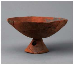
1 第8号周满状遗構 (第49图1)