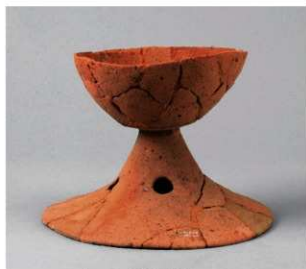
5 第3号周溝状遺構(第39图25)