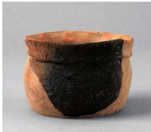
4 D区第19号周溝状遺構 (第120图3)