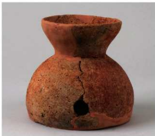
4 E区第10号周溝状遺構 (第198图2)