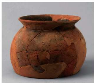
5 D区第46号周满状遗構 (第163图16)