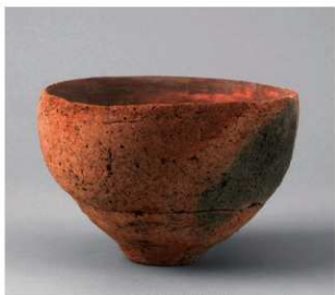
2 D区第1号周溝状遺構 (第95图10)