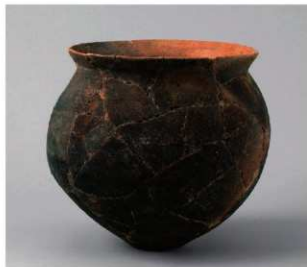
3 D区第22号满跡 (第378图38)