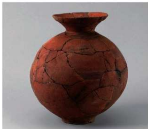
4 第5号方形周满墓(第226图19)