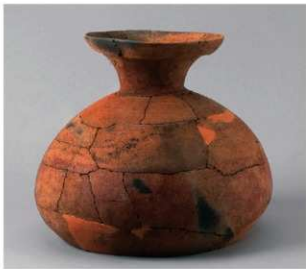
6 第2号方形周满墓 (第217图5)