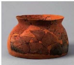
6 D区第46号周满状遗構 (第163图17)