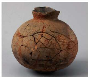
5 D区第14号井戸跡 (第316图81)