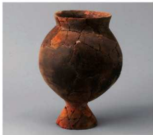
1 第19号周溝状遺構 (第68图25)