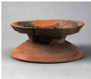
4 第19号周满状遗構 (第68图8)