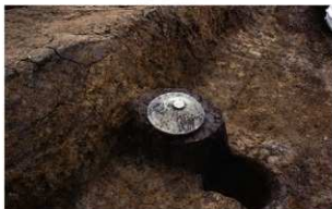
2 E区第1号溝跡遺物出土状況