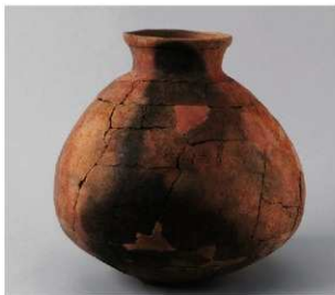
3 第5号方形周满墓(第226图18)