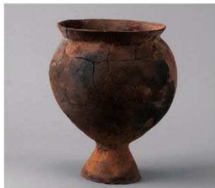
6 E区第6号周溝状遗構 (第189图12)