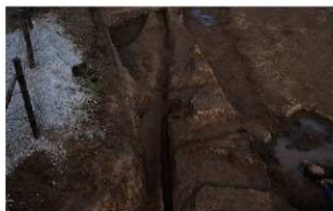
4 (左から)D区第20・58・19号溝跡