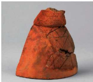
1 D区第1号埴 (第326图9)