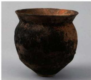
1 第41号井戸跡 (第313图27)