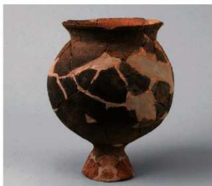
5 D区第28号周满状遗構 (第131图19)