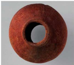
1 第5号方形周溝墓 (第225图6)