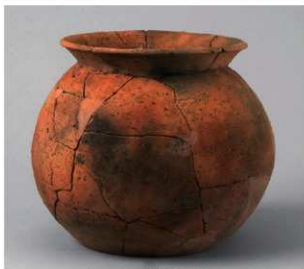
2 D区第46号周溝状遗構 (第164图21)