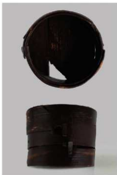
5 第47号溝跡 (第382图1)