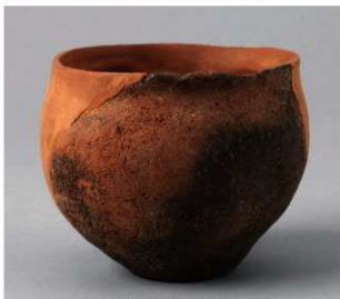
5 第2号方形周满墓 (第217图1)