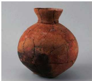
1 第6号方形周满墓 (第231图4)