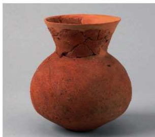
2 E区第13号周溝状遺構 (第203图2)