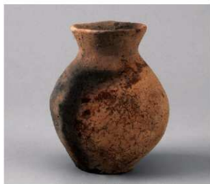
5 第27号周溝状遺構 (第80图2)