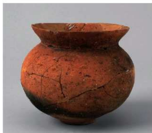
5 E区第6号周溝状遗構 (第189图9)