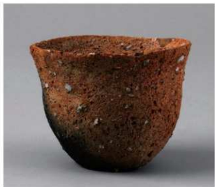
3 第19号周满状遗構 (第68图1)