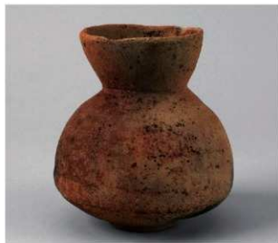
6 D区第33号井戸跡 (第319图116)