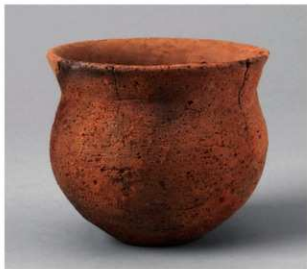
4 D区第38号周满状遗構 (第150图8)