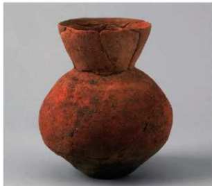
4 D区第48号周溝状遗構 (第166图2)