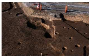
8 D区第80号溝跡、第30・28(奥)号井戸跡