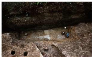
2 第1号性格不明遺構