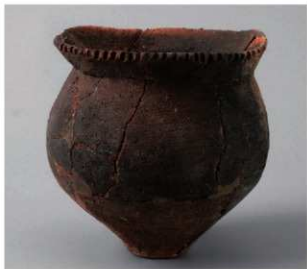
1 D区第35号周满状遗構 (第145图4)