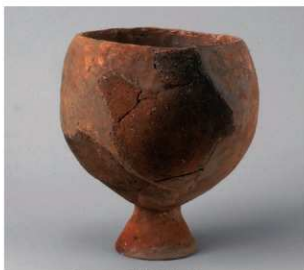
2 第 29 号周溝状遺構 (第 86 图 12)