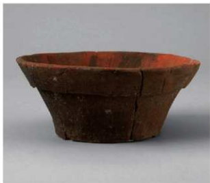
3 D区第14号井戸跡 (第315图69)