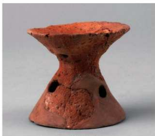
5 第19号周满状遗構 (第68图14)