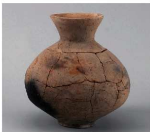
2 D区第9号井戸跡 (第314图51)