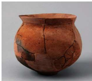
3 D区第10号周溝状遺構 (第110图37)