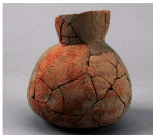
2 第1号周溝状遺構(第34图1)