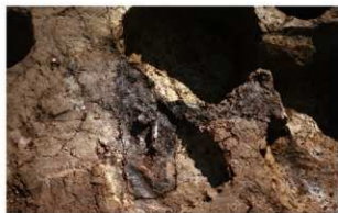
5 第1号火葬墓跡出土状況