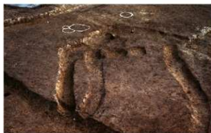
8 (左から)D区第37・36・38号溝跡