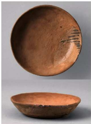
1 第16号满跡 (第377图3)