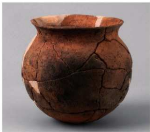
3 D区第8号周溝状遺構 (第104图1)