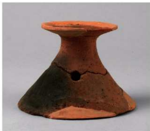
6 第19号周满状遗構 (第68图15)