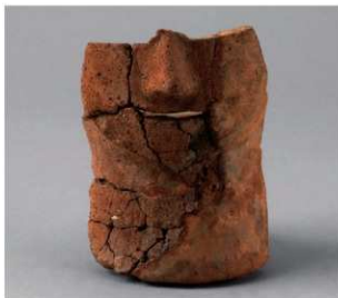
3 D区第2号埴 (第332图43)