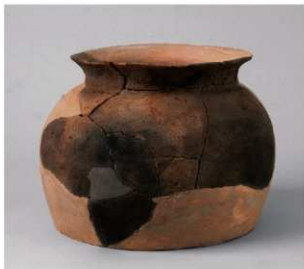
1 第 29 号周溝状遺構 (第 86 图 11)