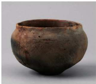
1 第34号周溝状遺構 (第93图4)