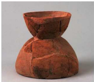
1 第3号性格不明遺構 (第388図4)