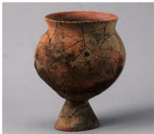
1 D区第25号周满状遗構 (第128图3)