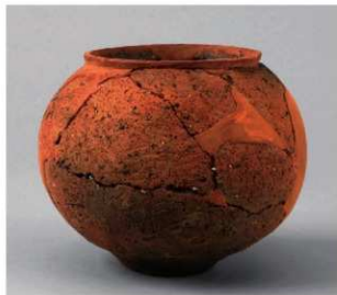
4 D区第9号周溝状遺構 (第104图7)