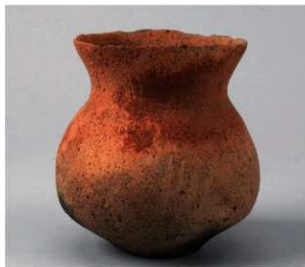
3 第3号周溝状遺構(第39图3)