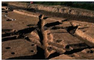
1 第80(中央)・82・81(奥)号溝跡