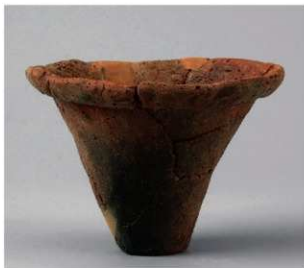
3 D区第42号周溝状遺構 (第159图26)