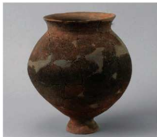
6 D区第42号周溝状遺構 (第160图52)