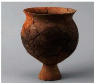
2 D区第16号周溝状遺構 (第117图4)