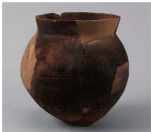
1 D区第42号周满状遗構 (第161图55)