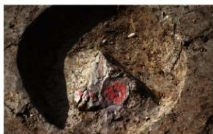
8 K-5グリッド ビット1遺物出土状況