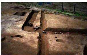
4 第3号溝跡、E区第2号方形周溝墓