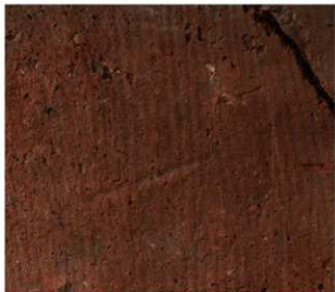
1 D区第3号墳 (第337図3)