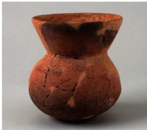
1 D区第42号周溝状遺構 (第159图4)