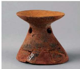
6 D区第10号周溝状遺構 (第109图22)