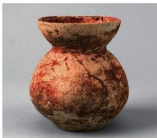
5 E区第4号井戸跡 (第319图123)