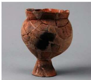
2 第19号周溝状遺構 (第68图26)