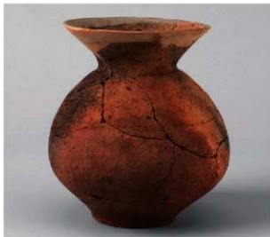
3 D区第10号周溝状遺構 (第109图8)