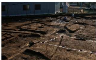
3 D区第49(中央)・50(左)号溝跡