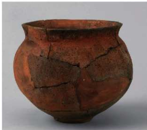
1 D区第46号周溝状遗構 (第163图19)