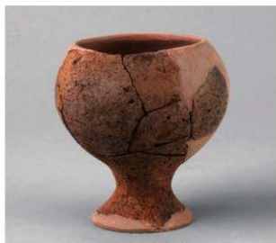
5 D区第10号周溝状遺構 (第110图31)