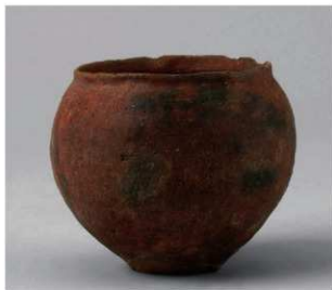
6 第6号方形周满墓(第231图1)