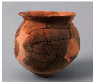
4 第 30 号周溝状遺構 (第 88 图 4)