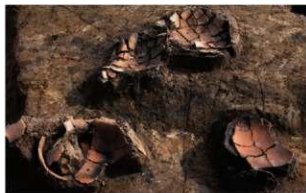
6 D区第22号溝跡遺物出土状況