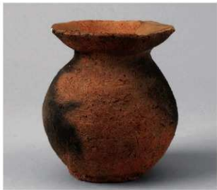
3 第1号方形周满墓 (第214图3)