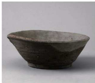
4 第53号溝跡 (第377图18)