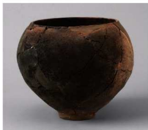
5 D区第10号周溝状遺構 (第111图43)