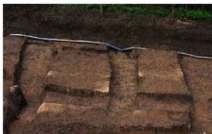
3 第2号溝跡、E区第5号周溝状遺構 (左)