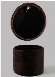
4 第35号井戸跡 (第322图17)