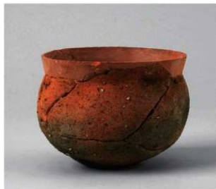
6 第3号性格不明遗構(第388图1)