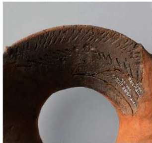
3 E区第2号墳 (第343图4)