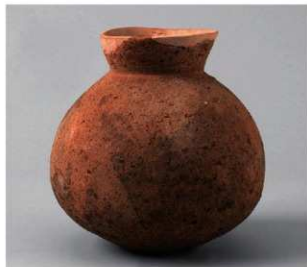
4 D区第29号井戸跡 (第318图106)