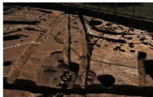
2 (左から)第85・84・83号溝跡