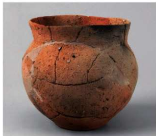
4 D区第10号周溝状遺構 (第110图38)