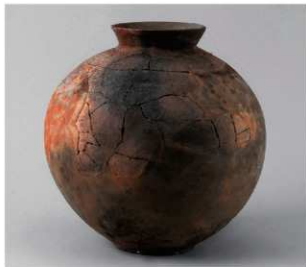
6 D区第48号周溝状遗構 (第166图7)