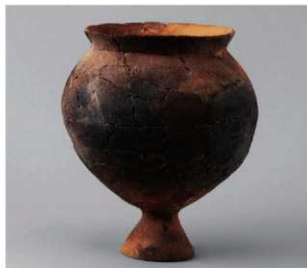
6 D区第10号周溝状遗構 (第112图50)