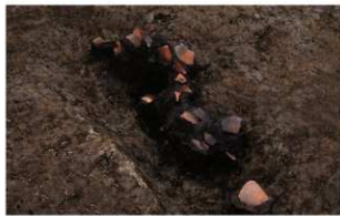
5 D区第19号溝跡遺物出土状況