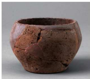
5 D区第10号周溝状遺構 (第109图1)