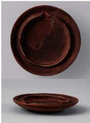
2 第8号满跡 (第377图9)