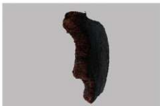
2 E区第17号井戸跡 (第323图22)