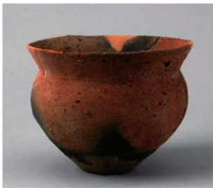
6 E区第10号周溝状遺構 (第198图10)