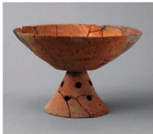
4 D区第10号周溝状遺構 (第110图28)