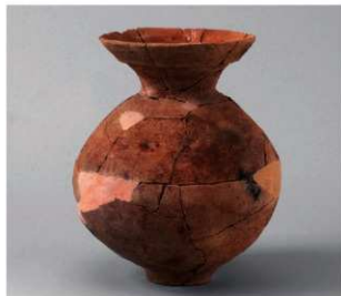
4 D区第34号周溝状遺構 (第143图12)