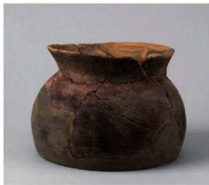
3 第19号周溝状遺構 (第68图24)