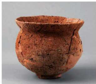
6 D区第10号周溝状遺構 (第110图34)