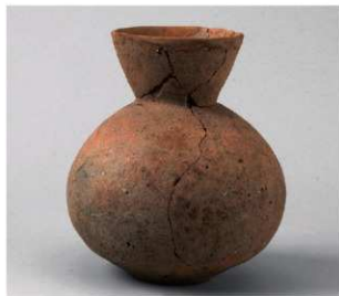
5 第5号方形周满墓 (第225图8)