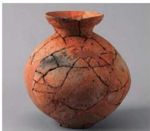
2 第3号性格不明遺構 (第388図5)