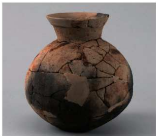
3 第3号性格不明遺構 (第388図6)