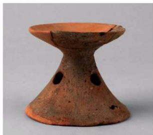
5 第 30 号周溝状遺構 (第 88 图 9)