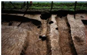
1 (左から) 第1号方形周溝墓、E区第1号溝跡、第3号方形周溝墓