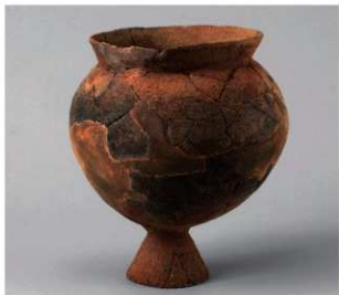
1 D区第10号周溝状遗構 (第111图45)