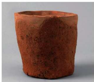
4 グリッド・表探 (第345図4)