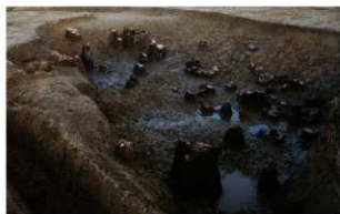
6 D区第73号溝跡遺物出土状況(2)