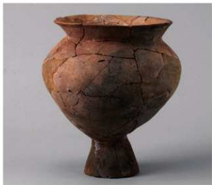
1 E区第6号周溝状遺構 (第189图13)