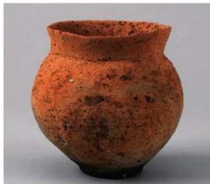
1 D区第51号周溝状遗構 (第175图5)