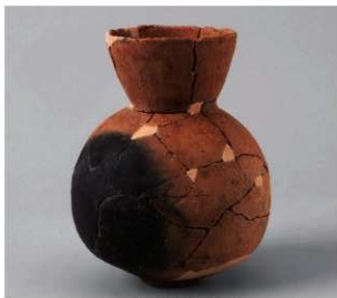
2 D区第42号周溝状遺構 (第159图5)