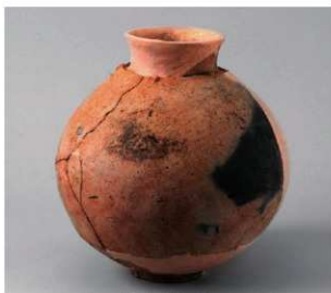
2 第5号方形周满墓(第226图17)