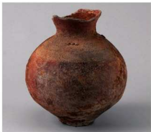
3 E区第4号井戸跡 (第319图121)