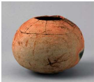
1 D区第14号井戸跡 (第315图57)