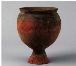
4 第19号周溝状遺構 (第69图28)