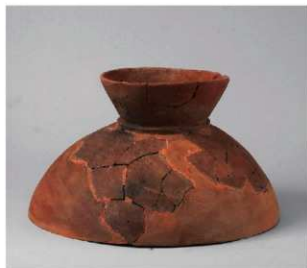
6 E区第15号周溝状遺構 (第206图2)