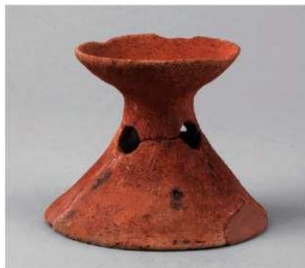
3 D区第34号周溝状遺構 (第143图5)