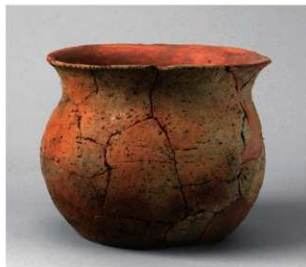
6 第4号周溝状遺構(第41图1)