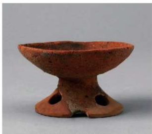
2 E区第7号周溝状遺構 (第192图9)