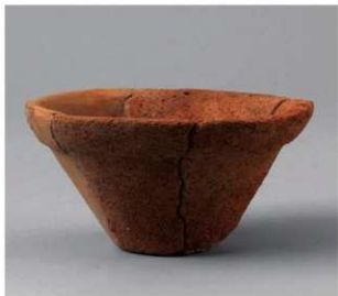
1 E区第16号周满状遗構 (第208图1)