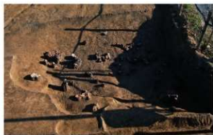
5 D区第73号溝跡遺物出土状況(1)