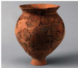
6 D区第21号周溝状遺構 (第122图5)