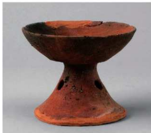
1 D区第14号井戸跡 (第316图86)