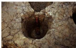
7 G-7グリッド ビット20遺物出土状況