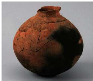
3 D区第27号井戸跡 (第318图97)