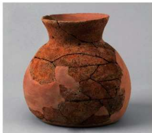
6 H-8グリッド (第394図19)