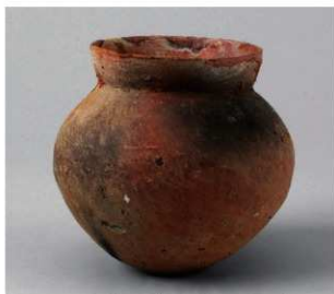
5 D区第14号井戸跡 (第315图55)