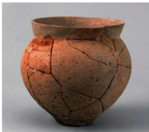
3 第 30 号周溝状遺構 (第 88 图 3)