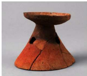
6 D区第35号周溝状遺構 (第145图1)