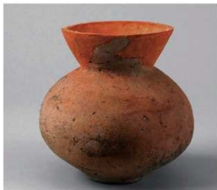
6 D区第14号井戸跡 (第315图56)