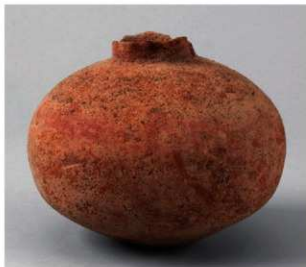
4 D区第28号周满状遗構 (第131图14)