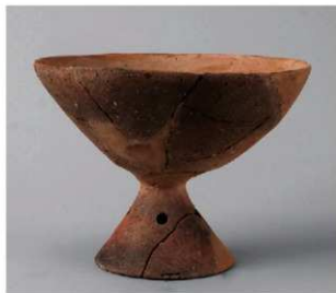
6 D区第51号周满状遗構 (第175图2)