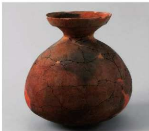
1 第2号方形周满墓 (第217图6)