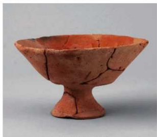
2 D区第10号周溝状遺構 (第110图24)