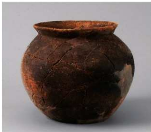
3 D区第16号周溝状遺構 (第117图5)