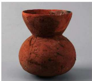
2 D区第14号井戸跡 (第315图58)