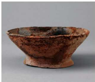
6 E区第7号井戸跡 (第320图129)