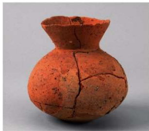
6 第27号周溝状遺構 (第80图4)