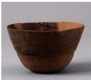
2 D区第50号周满状遗構 (第172图2)