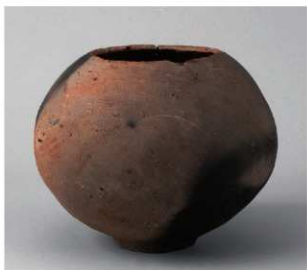
2 第42号井戸跡 (第313图30)