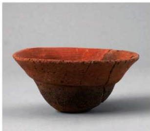
6 D区第42号周满状遗構 (第159图2)