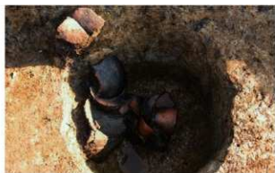
6 F-19グリッド ビット1遺物出土状況