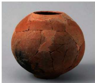
6 D区第14号井戸跡 (第316图82)