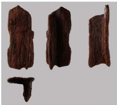
4 第39号井戸跡 (第323图20)