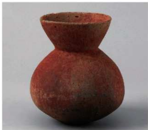
1 E区第3号井戸跡 (第319图119)