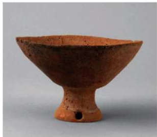
1 D区第10号周溝状遺構 (第110图23)