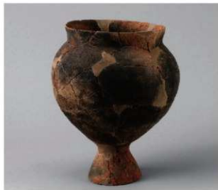
4 D区第10号周溝状遗構 (第112图48)