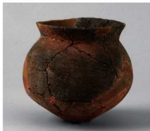
5 D区第42号周溝状遺構 (第160图48)