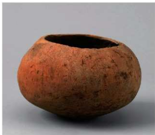
3 D区第1号井戸跡 (第313图37)