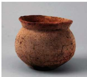
2 D区第10号周溝状遺構 (第110图36)