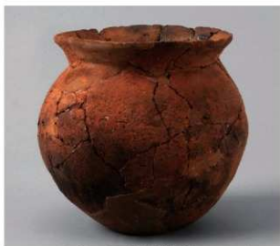
5 D区第38号周满状遗構 (第150图15)