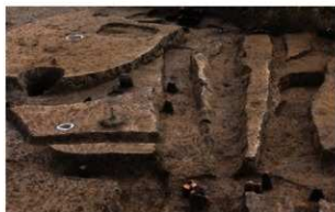
3 (左から)D区第15・4・3・91号溝跡