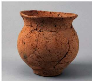
1 D区第10号周溝状遺構 (第110图35)