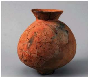
1 D区第16号周溝状遺構 (第117图2)