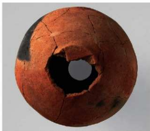
2 第5号方形周溝墓 (第227图23)