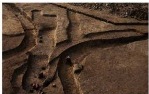
1 (右から) D区第45・42・40・39・41号溝跡