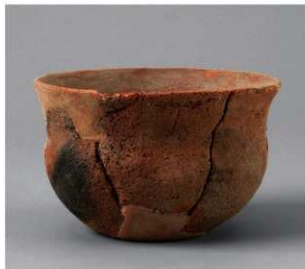
1 E区第13号周溝状遺構 (第203图1)