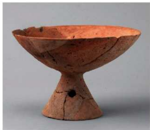
3 D区第10号周溝状遺構 (第110图27)