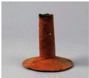
3 第28号周满状遗構 (第83图11)