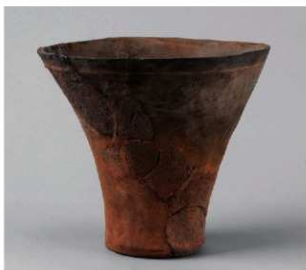
5 第28号土坑 (第23图1)