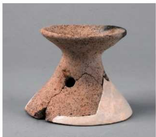
2 第8号周满状遗構 (第49图2)