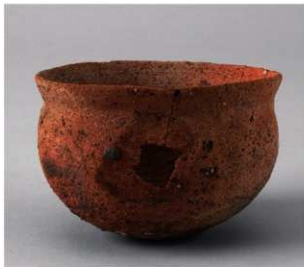
3 D区第48号周溝状遗構 (第166图1)