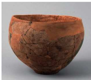
2 E区第2号周溝状遗構 (第180图1)