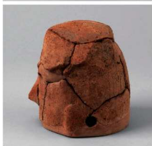
4 D区第2号埴 (第332图42)