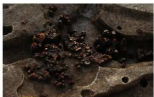
4 第3号性格不明遺構遺物出土状況