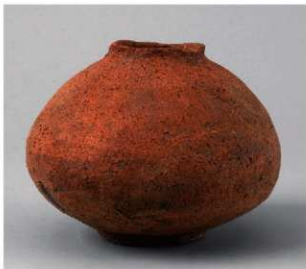
4 第1号方形周满墓 (第214图4)