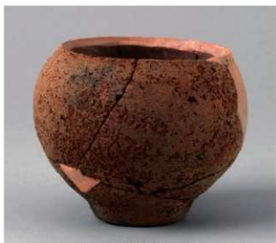
2 D区第44号周满状遗構 (第169图2)