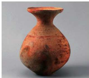
6 D区第9号井戸跡 (第314图49)