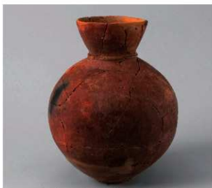
2 第2号方形周满墓 (第217图7)