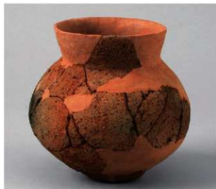
6 第 34 号周溝状遺構 (第 93 图 2)