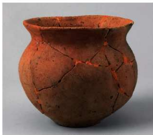
5 D区第48号周溝状遗構 (第166图4)