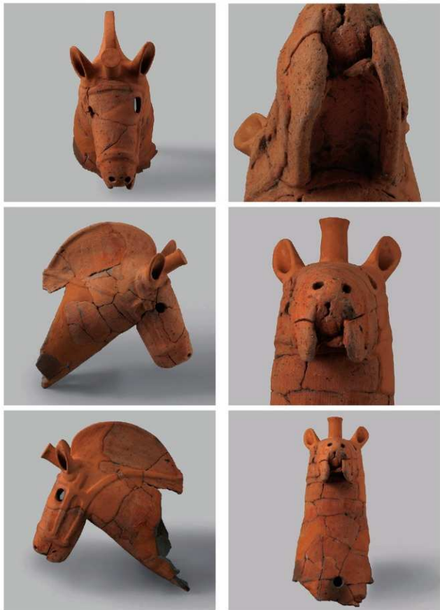
1 D区第2号填 (第334图54)