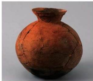
4 E区第6号周溝状遗構 (第189图5)