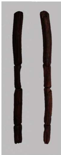
3 第35号井戸跡 (第322图19)