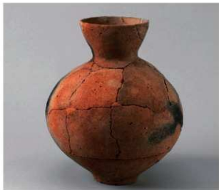
3 第5号方形周溝墓 (第225图10)