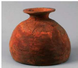
4 D区第46号周满状遗構 (第163图5)