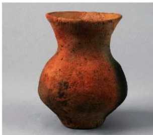
3 第5号方形周满墓 (第225图1)