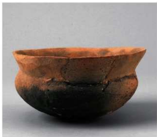
3 D区第50号周满状遗構 (第172图3)