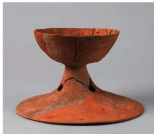
4 第3号周溝状遺構(第39图24)