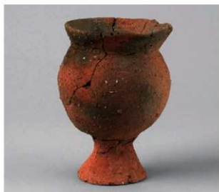
5 第3号性格不明遺構 (第388図22)