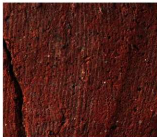
1 D区第3号填 (第337图2)