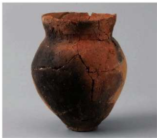
3 第6号方形周满墓 (第231图10)