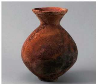
4 E区第4号井戸跡 (第319图122)