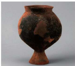
2 D区第10号周溝状遗構 (第111图46)