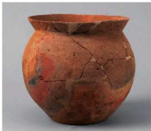
1 D区第48号周满状遗構 (第166图10)