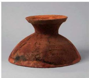
2 第6号方形周满墓 (第231图5)