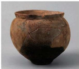
6 第29号周满状遗構 (第86图7)