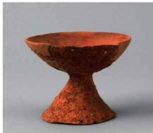
4 第3号性格不明遺構 (第388図16)