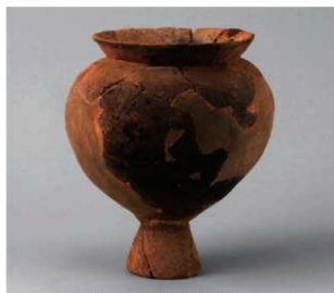
5 D区第34号周溝状遺構 (第143图13)