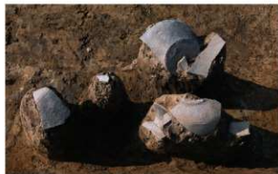
5 E区第4号溝跡遺物出土状況