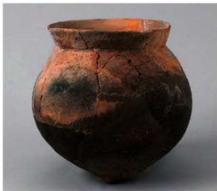
4 第6号方形周满墓 (第232图11)