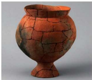
3 D区第10号周溝状遗構 (第111图47)