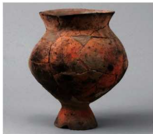
6 D区第10号周溝状遺構 (第111图44)