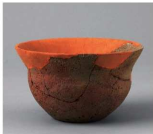
5 D区第73号满跡 (第379图51)