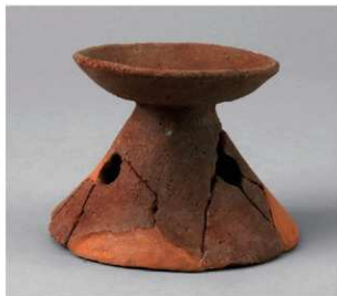
3 E区第13号周溝状遺構 (第203图16)