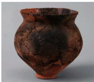
2 D区第35号周满状遗構 (第145图5)