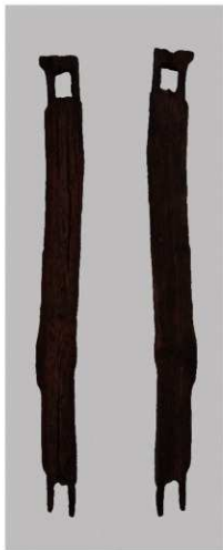
2 第9号井戸跡 (第322图13)