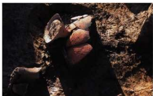
2 D区第41号溝跡遺物出土状況