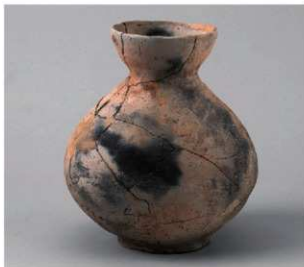
1 D区第9号井戸跡 (第314图50)