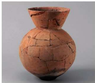
4 D区第14号井戸跡 (第316图80)