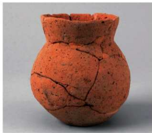
6 D区第10号周溝状遺構 (第109图3)