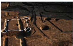
4 (左から) D区第55・84・51・53・68号溝跡