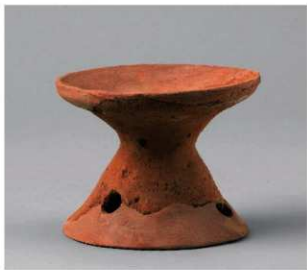
3 E区第7号周溝状遺構 (第192图10)