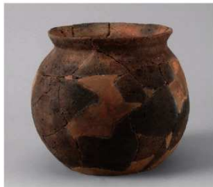
4 E区第13号周溝状遺構 (第203图18)