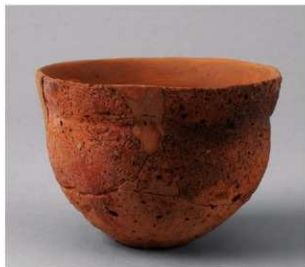
3 E区第6号周溝状遗構 (第189图1)