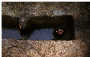
1 E区第29号溝跡遺物出土状況