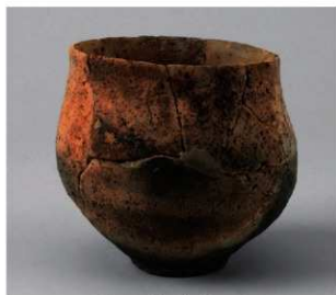
5 D区第29号井戸跡 (第318图107)