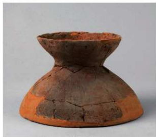
5 D区第10号周溝状遺構 (第109图11)