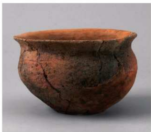
2 D区第26号周满状遗構 (第131图8)