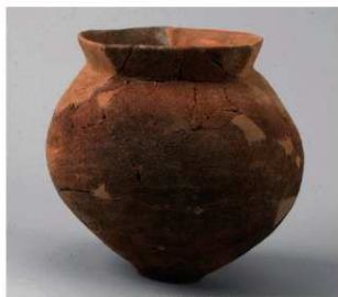
5 D区第50号周满状遗構 (第173图33)