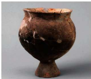
6 D区第28号周满状遗構 (第131图20)