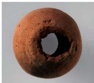
4 第5号方形周满墓 (第225图2)