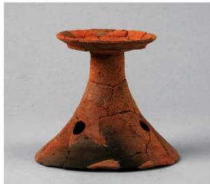
4 D区第42号周溝状遺構 (第159图30)