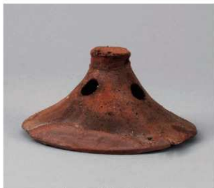
5 D区第19号周溝状遺構 (第120图5)