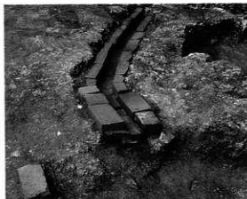
煉瓦遺構(神明前遺跡)

一方、同じ煉瓦でも、全く違う用途の煉瓦があります。俗に「白煉瓦」と呼ばれる耐火煉瓦です。溶鉱炉などに使用される耐熱性の高い煉瓦で、原料・製法も赤煉瓦と異なる特殊な技術が要求されます。近代の重