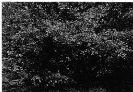
県立大磯城山公園のソメイヨシノ

北村四郎・村田源 (1971)：原色日本植物図鑑・本木編(Ⅱ)、1-18、保育社 木村陽二郎 (1991)：図説草木名彙辞典、柏書房