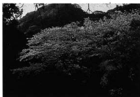
高来神社境内のヤマザクラ