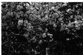
高来神社鳥居横のオオシマザクラ