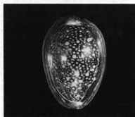
ハナマルユキダカラガイ