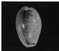
オミナエシダカラガイ