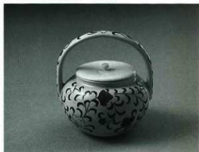
(上) 赤絵草花文茶器 (左) 赤絵獅子五角香炉