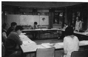
[2001年度第1回] ガイドンスの様子 (2001年4月28日撮影)