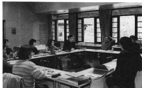
(2003年度第20回) ミーティングの様子(2004年3月20日撮影)