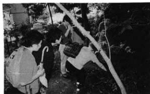
〔2002年度第6回〕ヒメヤブランの観察(2002年6月22日撮影)