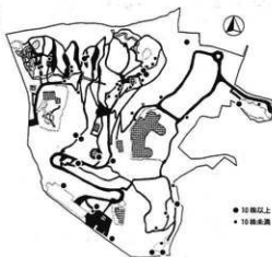
2001年度第1回調査(2001年5月12日実施) オニタビラコの集計結果

査参加者13人、それ以外の参加者14人の計27人の参加があった。調査方法に関して、前年度と同様に12月末にアンケートを実施した。回答は時間、内容共に適当というものがほとんどであった。年度の最後の講座で次年度の講座内容について意見交換会の時間を設けた。次年度以降の講座の方向性について、第2・第4土曜日すべて同じ内容で進めるのではなく、どちらか一方、知識を深めるための時間として活用してはどうか。新規受講者が植物に親しめるような内容を導入してはどうかという意見をいただいた。