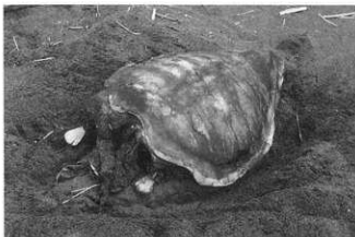
図2. 2002年7月13日に確認したアカウミガメ