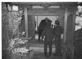
文化財防火デー巡回

開発等に伴い、埋蔵文化財にかかわる事前相談に対応した。相談件数は11件（個人住宅9件、住宅分譲・宅地造成2）で、このうち立会調査を実施したものが2件、試掘確認調査等を実施したものが4件であった。