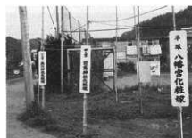
神揃山登り口手前の化粧塚