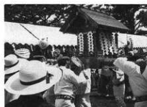
一の宮最初に大矢場にお成り