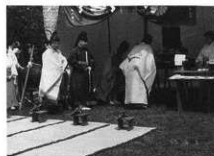
総社大矢場祭典（七十五膳献上）