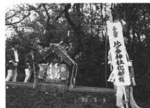
神揃山中の化粧塚