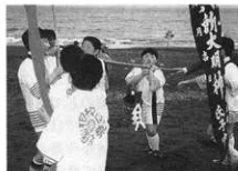
手桶に入れた砂を子どもたちが運ぶ