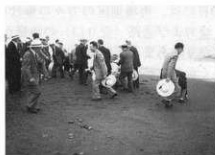
足跡のない砂を集める