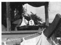
鷺・竜・獅子舞の仮面