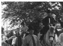
国司・宮司大矢道を行く