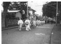
道を浄める（国府新宿）