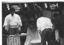
一の宮御座所入り