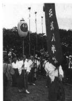
八幡宮より順次 五社還御