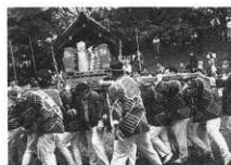
“御霊をいただく”三の宮神輿