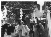
総社神輿化粧塚にお成り