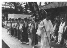
七度半の迎神の儀