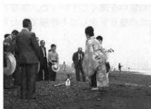
宮世話人の御浄め

浜降りは、以前は道浄めを終えた後、引き続き隊列に神官を迎え、共に浜へ降りて波打ち際に幣を立て、祝詞を奏上して一回を浄めた。そして、足跡のない砂を手桶に入れて子どもたちが担いで大矢場の行在所に撒いて浄める。これらの神事は体力がいり、お年の方には少々つらいものようで、「体力テストだ」などと囁かれていた。なお、現在は両行事を同時に行っている。