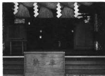
総社・五社分霊を鎮める