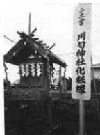
馬場道にある化粧塚