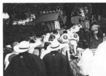
一の宮神揃山へ登る