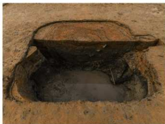
大土坑SK11960半截状況（東から）

平城京左京三条一坊二坪・平城第六五八次調査（二〇二三～二四年） 調査区東北で検出した東西約二・八m、南北約二・五m、深さ約一・〇mの方形土坑。最下層に木片を中心とした有機物を敷き込み、その上に粘土を積んで埋め、さらにこれをもう一度掘り起こして再び最下層に粟皮・木の葉を主体とする有機物を敷き込み、粒度をあえて不均一に調整した土を積み、さらにこの土を掘り起こして砂層と粘土層を交互に積んで埋める。木簡は、有機物層から二六〇〇点（うち削屑二五〇点）以上（現在洗浄中）出土した。