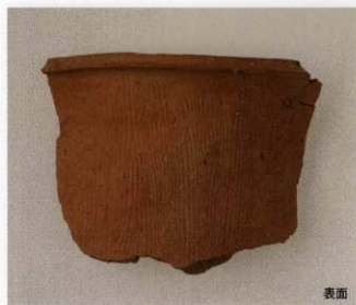
1 第16号墳 (第507图19)