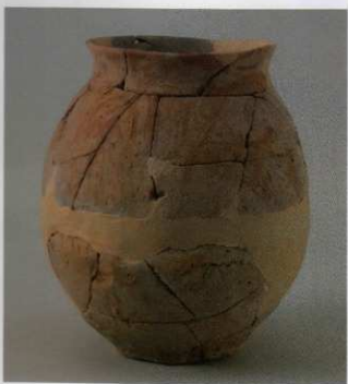
8 第23号墳 (第548图1)