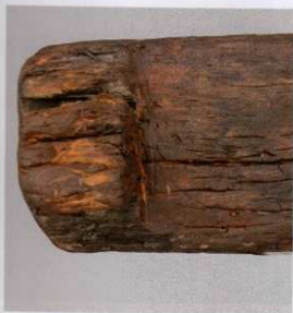
6 第 476 図 38