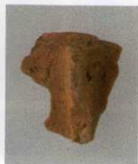
10 第17号墳 (第515图8)