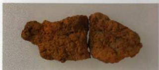
2 第17号墳 (第515图9)