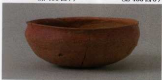
4 第14号墳 (第499图2)