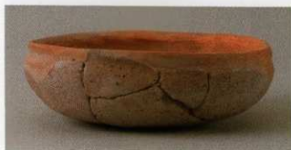
7 第27号墳 (第564图2)