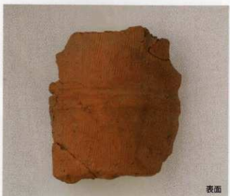
1 第16号墳 (第507图22)