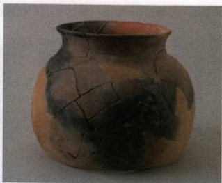
8 第16号墳 (第506图11)