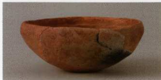
1 第24号墳 (第552图1)