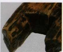
1 第 475 図 31