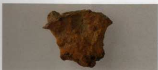
7 第22号墳 (第543图6)