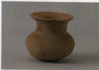
5 第14号墳 (第499图3)