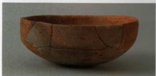
3 第19号墳 (第531图1)