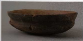
5 第20号墳 (第534图1)