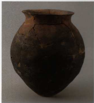
1 第17号墳 (第515图3)