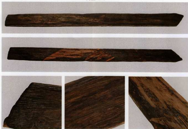
1 第 479 図 66