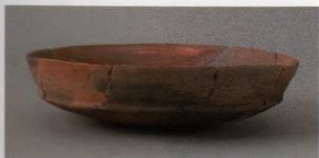
6 第21号墳 (第538图1)