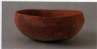
6 第15号墳 (第502图1)