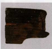
7 第 479 図 63