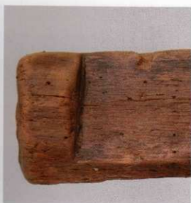
4 第 476 図 36