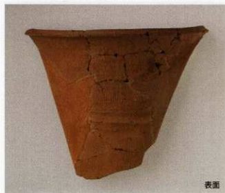
2 第16号墳 (第507图20)