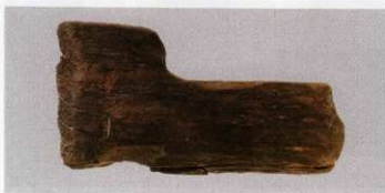
5 第 479 図 62