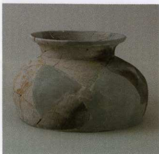
10 第27号墳 (第564图9)