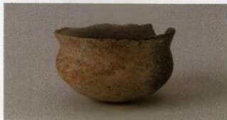
6 第25号墳 (第557图1)