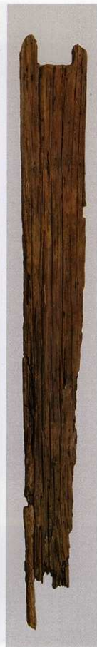
5 第 477 图 47