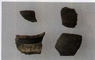
7 第16号墳 (第506图5)