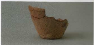
4 第19号墳 (第531图4)