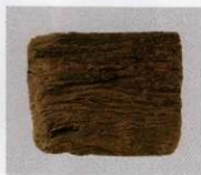
8 第 479 図 64