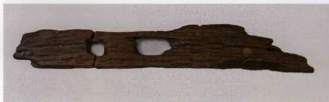
2 第 479 図 56