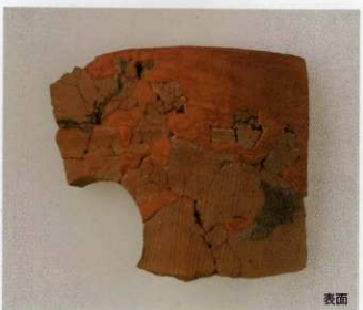
2 第16号墳 (第507图23)