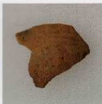
3 第24号墳 (第552图5)