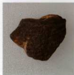
2 第24号墳 (第552图4)