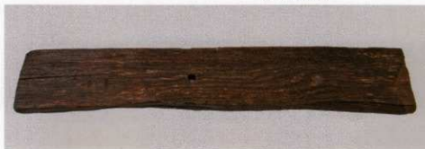
1 第 479 図 55