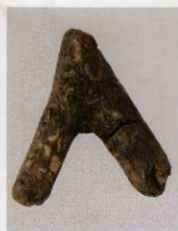
13 第 433 図 235