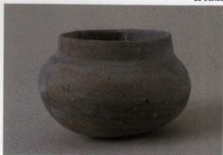
1 第13号墳 (第488图3)