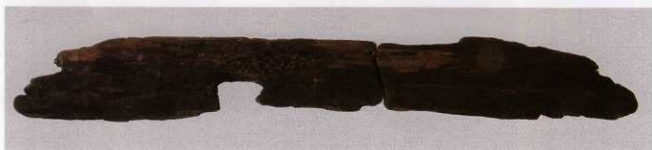
3 第 479 図 57