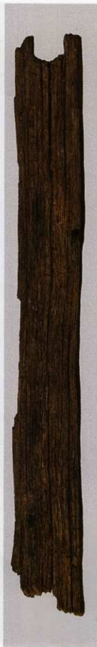
4 第 477 图 46