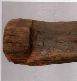
5 第 476 図 37