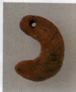
9 第16号墳 (第506图15)