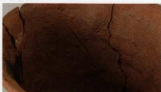
2 第16号墳(第507図17) ヘラ描き