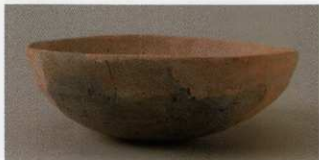
8 第27号墳 (第564图4)