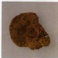
2 第13号墳 (第488图7)