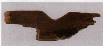
4 第 479 図 61