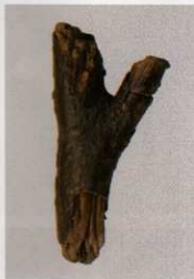
13 第 430 図 119