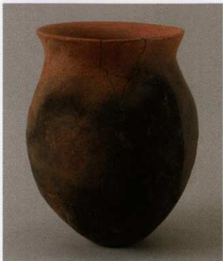
9 第27号墳 (第564图6)