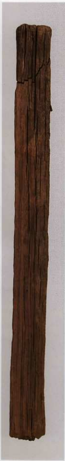
2 第 477 图 44