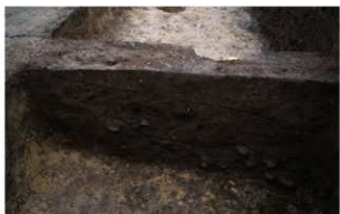
2 B区第4号溝跡土層断面 (南から)