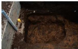
5 A区第12号土壇（北から）