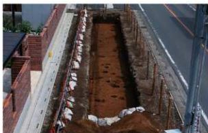
1 調査区全景 (南から)