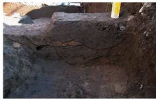
5 第1号溝跡土層断面 (1) (南から)