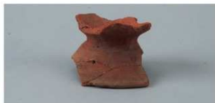
8 第3号住居跡 (第9图3)