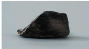
8 第4号沟跡 (第24图5)