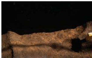
3 A区第10号土壇（西から）