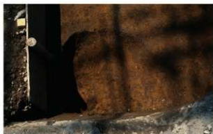
7 B区第18号土壌 (北から)