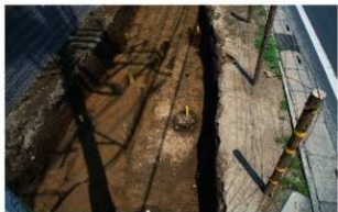
1 B区第4号溝跡 (南から)