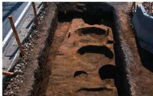
2 調査区南端部 (北から)