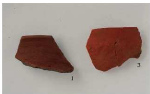
3 第3号溝跡 (第16図1・3)