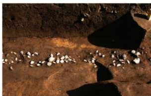
3 第1号溝跡礫出土状況(4)(西から)