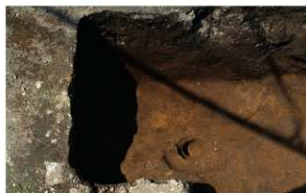
8 B区第5号住居跡（東から）