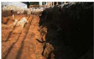
4 第1号溝跡 (3) (南から)