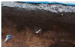
6 第1号火葬跡 (東から)