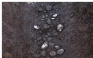
8 第1号溝跡礎出土状況 (1) (南から)