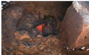
6 第3号住居跡遺物出土状況 (2) (北から)