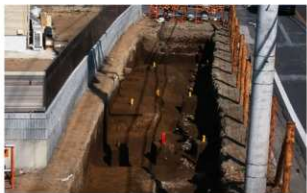
2 第1号溝跡 (1) (南から)