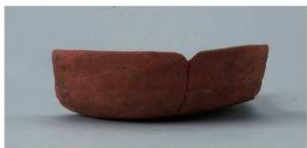
4 第2号住居跡 (第8图5)