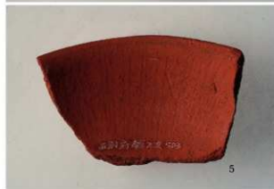
6 第3号溝跡 (第16図4・5)