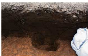
8 第2号火葬跡 P-1グリッド・ピット20 (西から)