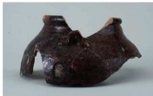
5 第1号溝跡 (第12図1)