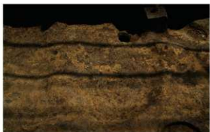
4 B区第15号土壌 (西から)