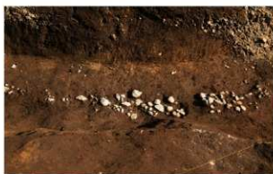
4 第1号溝跡礫出土状況(5)(西から)