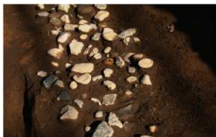
2 第1号溝跡礫出土状況(3)(南から)