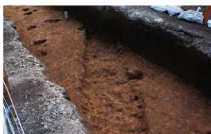
4 第3号溝跡 (北東から)