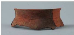
3 第2号住居跡 (第8图4)