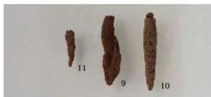
6 第15・17号土壙(第27图9・10・11)