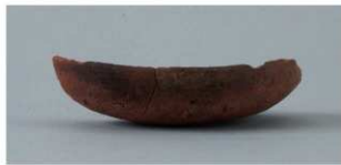
9 第3号住居跡 (第9图4)