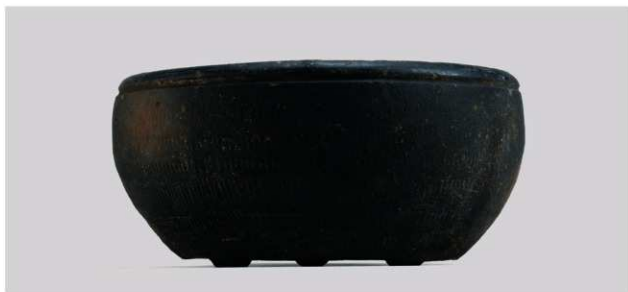
2 第14号土壙出土遺物