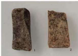
1 第4号沟跡 (第24图1·2)