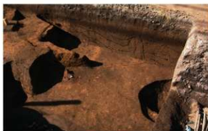
3 第1・2号住居跡 (東から)