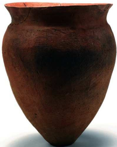
1 第2号住居跡出土遺物