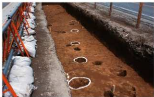
1 第1号柱穴列 (西から)