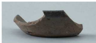
8 グリッド (第15図4)