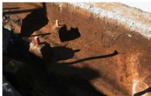
4 第3号住居跡 (東から)