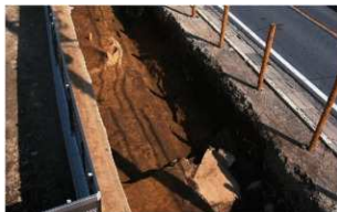
5 第3号住居跡遺物出土状況 (1) (南から)