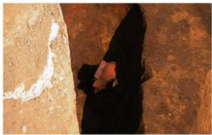
1 第4号住居跡遺物出土状況 (南西から)