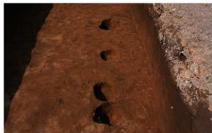
2 O-1グリッド・ピット1~4 (南から)