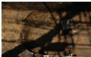
6 B区第17号土壌 (東から)