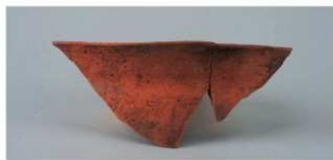
7 第3号住居跡 (第9图2)