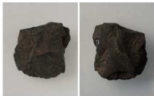
6 第1号溝跡 (第12図11)