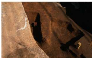
7 第4号住居跡 (南西から)