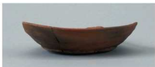
2 第1号溝跡 (第12図8)