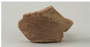
4 第1号溝跡 (第12図4)