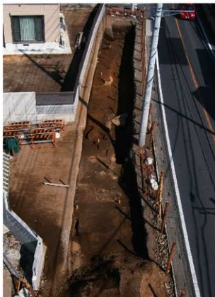
1 調査区全景 (南から)