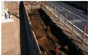
3 第1号溝跡 (2) (南西から)