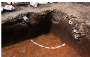
3 第8号土坑 (南東から)