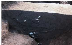
7 第1号溝跡土層断面 (3) (北から)