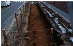
2 調査区全景 (北から)