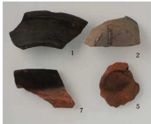
7 グリッド (第15図1・2・5・7)