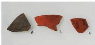
2 第1号住居跡 (第7图1・4・6)