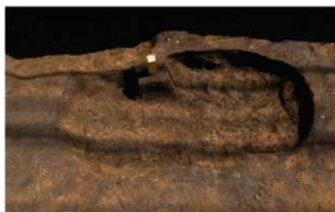
4 A区第11号土壇（西から）