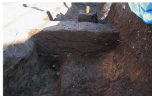
6 第1号溝跡土層断面 (2) (南から)