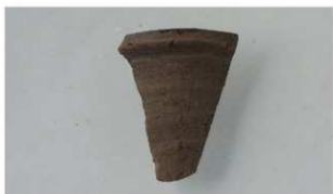
4 第3号溝跡 (第16図10)