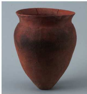
6 第2号住居跡 (第8图1)