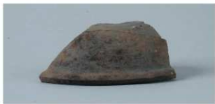
5 第2号住居跡 (第8图6)