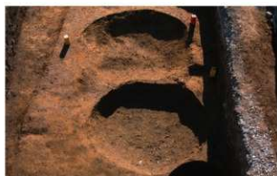
7 第3・4号土壇(北から)