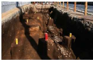
1 第1号溝跡礫出土状況(2)(南から)