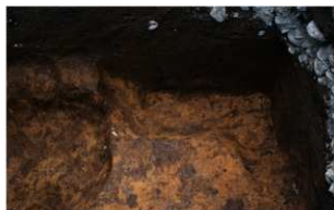
6 A区第13号土壇（北から）