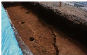
5 第3号溝跡 (南西から)