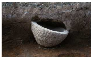
8 石白出土状況(東から)