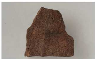
2 第4号沟跡 (第24图3)