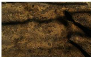
8 B区第19号土壌 (西から)