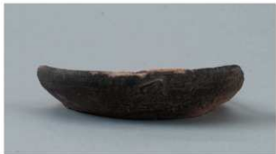
3 第4号沟跡 (第24图8)