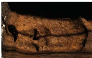
2 A区第9号土壇（西から）