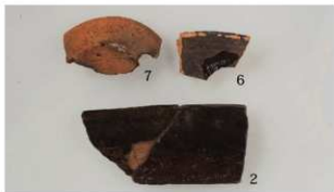
3 第1号溝跡 (第12図2・6・7)