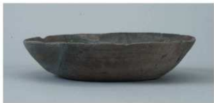
1 第1号住居跡 (第7图5)