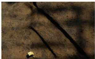
3 B区第5・6号溝跡 (西から)