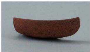
5 第3号溝跡 (第16図6)