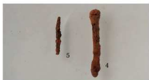
7 第4号住居跡(第10图5)·第4号土壙(第13图4)