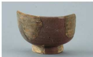
7 第4号沟跡 (第24图7)