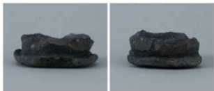
1 第1号溝跡 (第12図10)