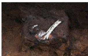
7 第1号火葬跡人骨出土状況 (東から)