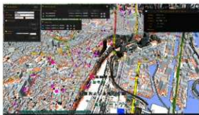
東京(高輪築堤)周辺図 ビルと文化財位置データの表示 (プロジェクト PLATEAU のデータを利用)