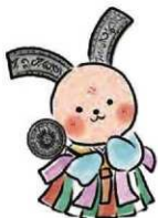
かわらびつとちゃん