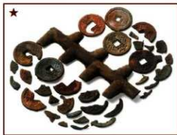
<富本銭鑄造関係遺物>

とりわけ、 富本銭 鑄造関連遺物（★）は、日本最古の鑄造貨幣である富本銭がこの場所で造られていたことを示す重要な発見。