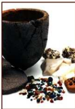
&lt;ガラス生産関係遺物&gt;