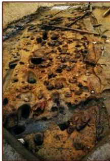
<東の谷東岸の工房の炉跡群>

南地区は工房とそれに伴う遺構・遺物群。北地区は飛鳥寺東南遮蔽施設とその関連遺構及び飛鳥寺付屋敷園とみられる建物や堀、井戸などの遺構群。