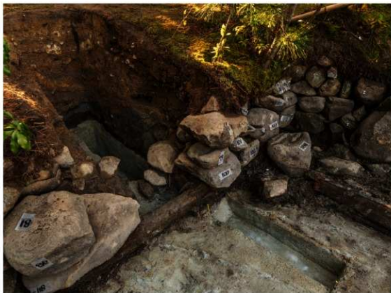
図2 1トレンチ完掘状況 東から