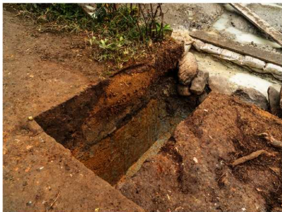
図5 3トレンチ完掘状況 北から