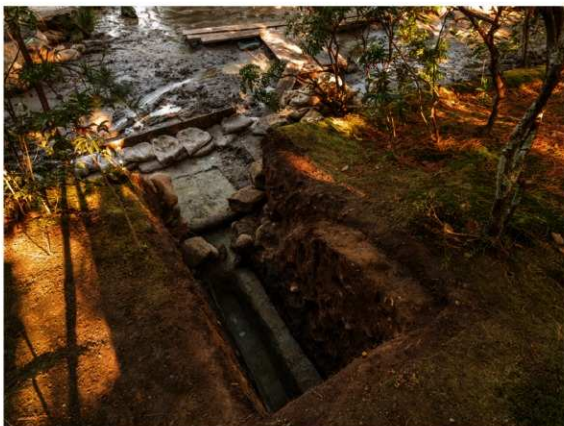
図3 1トレンチ完掘状況 西から