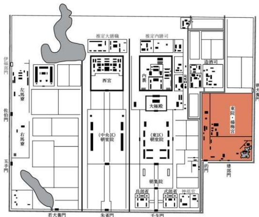
図1 奈良時代後半の平城宮 (井上和人『日本古代都城制の研究』所収図に加筆)