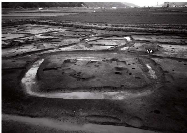
(1)ST 1 全景(西より)