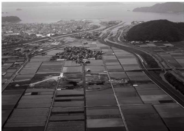
(1)調査地遠景(東上空より)