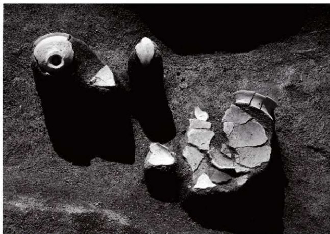
(2)ST18南溝 遺物出土状況(東より)