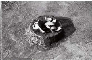
(3)ST17東溝 遺物出土状況(東より)