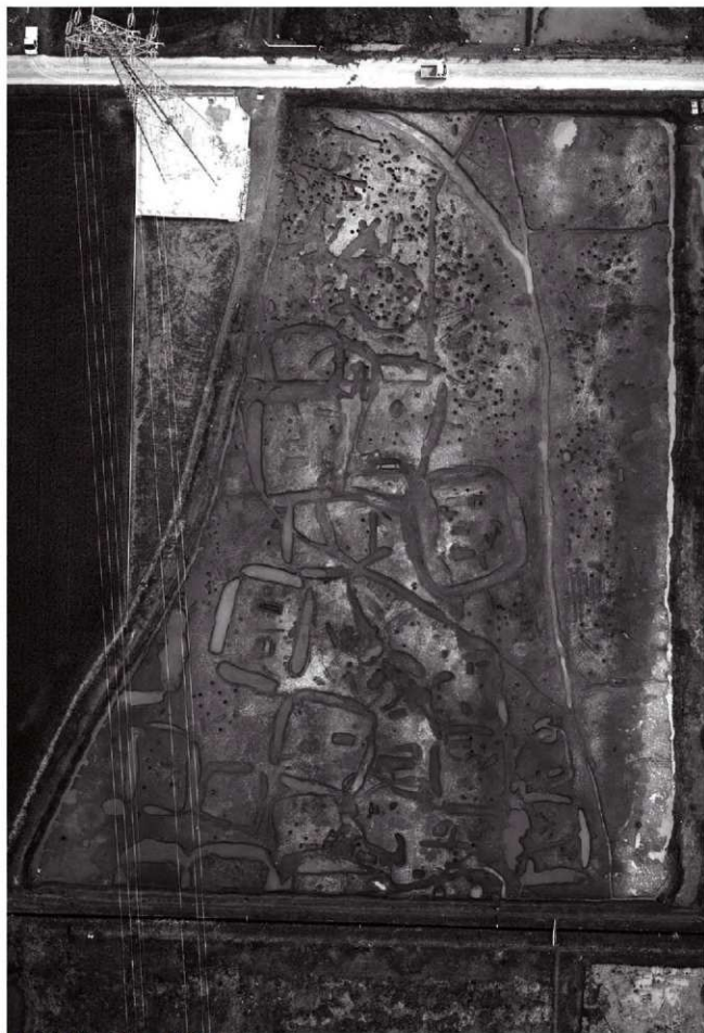
Ⅱ区全景(上空より) ※北は写真下方