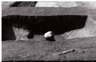
(2) ST9 北溝 遺物出土状況(東より)