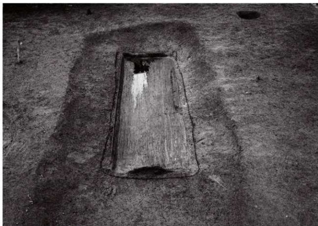
(5)ST 5 木棺出土状況(東より)