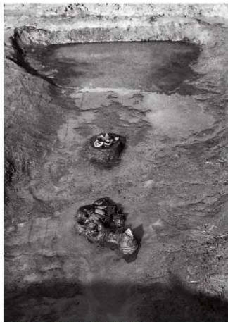
(2)ST17東溝 遺物出土状況(南より)