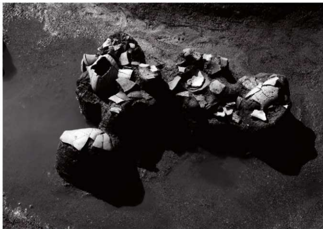
(1)ST18東溝 遺物出土状況(東より)