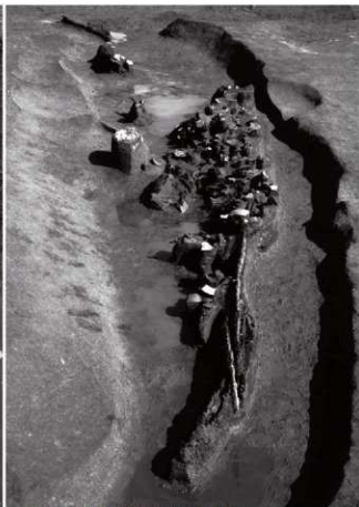
(3)ST 1 南溝 遺物出土状況(西より)