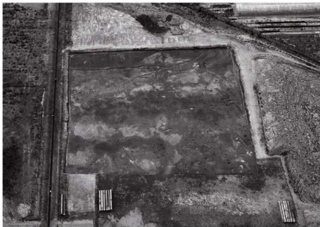
(1) III区全景(東上空より)