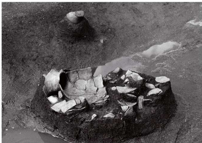
(1)ST17北溝 遺物出土状況(東より)