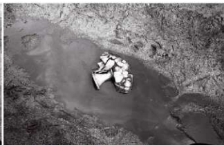
(3) ST9 東溝 遺物出土状況(西より)