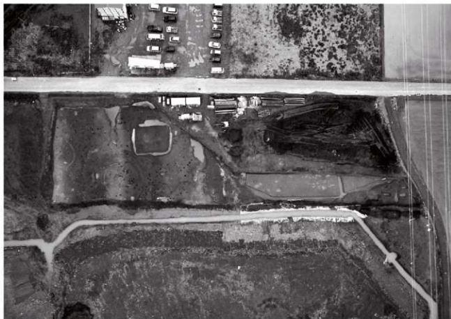
(1)Ⅵ区全景(南上空より)