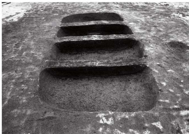
(1)ST9第1埋葬施設(西より)