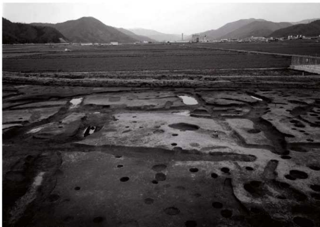
(1)ST 2 全景(西より)