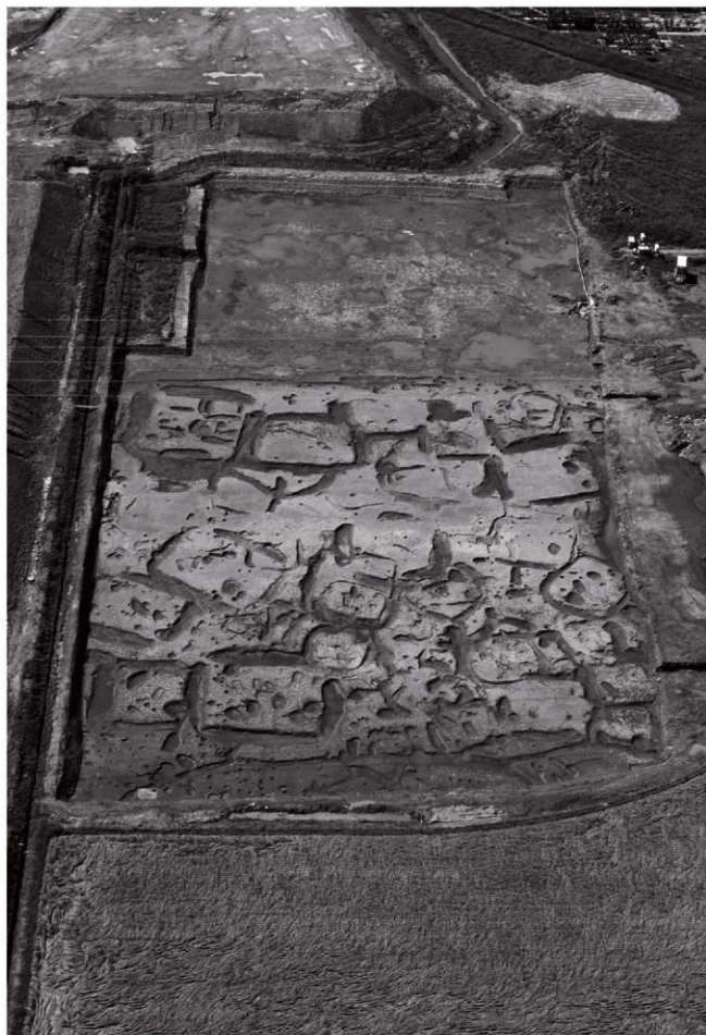
IV区全景(東上空より) ※西半は未調査