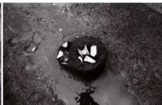
(5) ST9 南溝 遺物出土状況(南より)