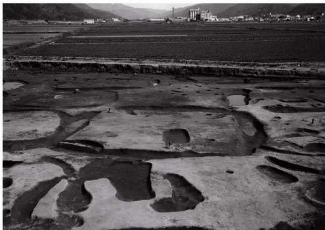
(1) ST9 全景(西より)