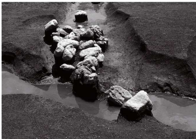
(2)ST21東溝 礎出土状況(北より)