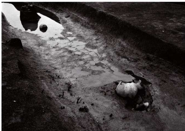
(2)ST 5 西溝 遺物出土状況(北より)