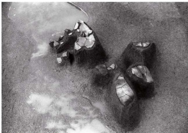
(2)ST8 東溝 遺物出土状況(南より)