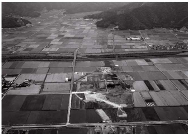
(2)調査地遠景(南上空より)