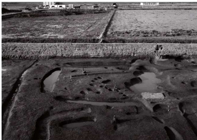
(1)ST 6 全景(南より)