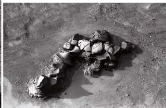
(4)ST17東溝 遺物出土状況(東より)