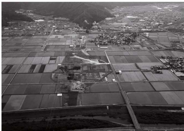
(2)調査地遠景(北上空より)