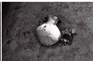
(2)ST 5 西溝 遺物出土状況(東より)