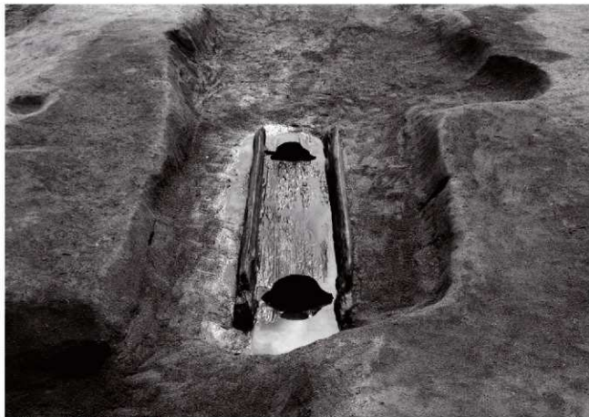
(2)ST 2 木棺出土状況(西より)