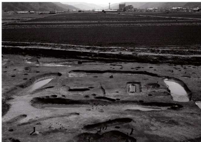
(1)ST 5 全景(西より)