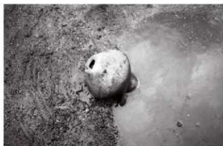
(3)ST 5 西溝 遺物出土状況(西より)