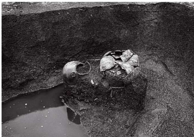
(1)ST3西溝 遺物出土状況(西より)