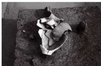
(1)ST 5 北溝 遺物出土状況(西より)