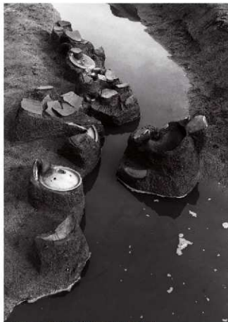
(2)ST 1 東溝 遺物出土状況(南より)