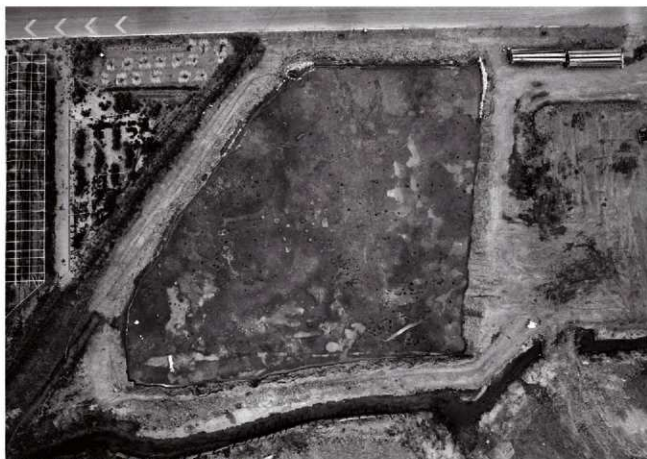
(2)Ⅶ区全景(上空より) ※北は写真上方