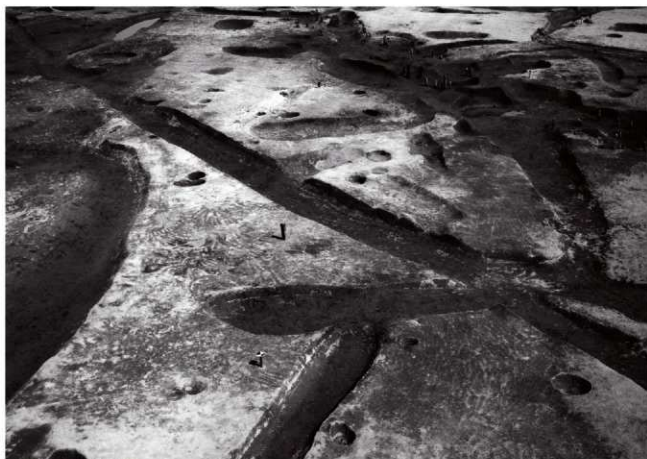
(2)ST 7 全景(南より)