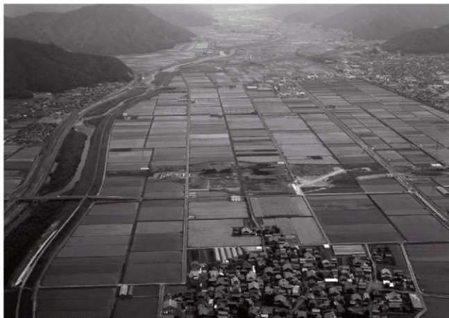
(1)調査地遠景(西上空より)