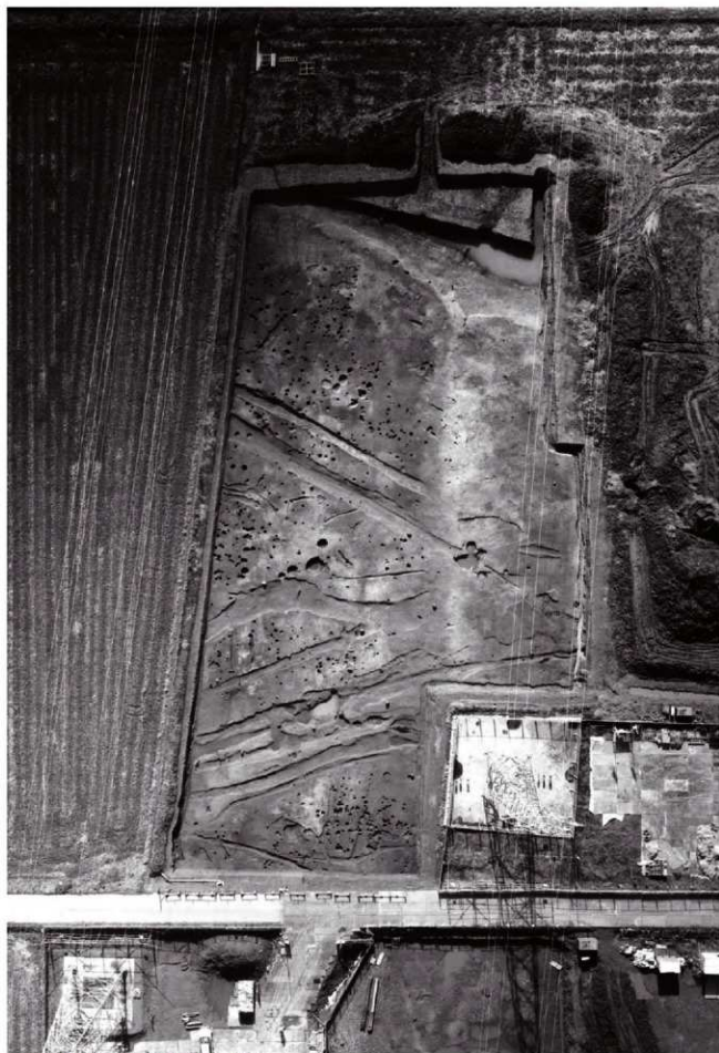
I区全景(上空より) ※北は写真下方