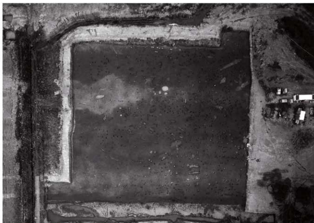
(2) IV区西半(上空より) ※北は写真右側