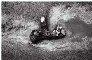
(4) ST9 南溝 遺物出土状況(南より)