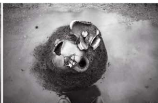
(4)ST 5 西溝 遺物出土状況(西より)