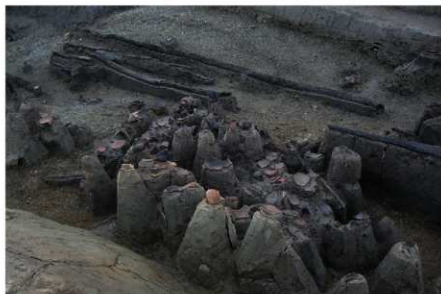
1 B区第36号溝跡P 66 G 付近（古墳時代前期） 遺物出土状況（1）