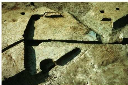
3 B区第18号住居跡 (東から)