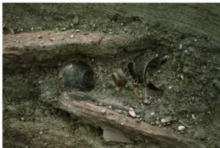
3 B区第36号溝跡 遺物出土状況