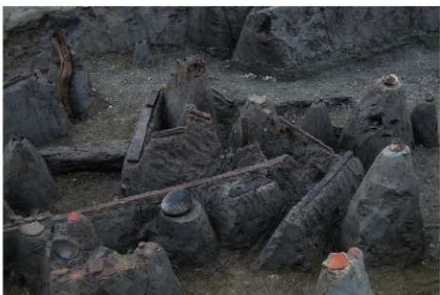
2 B区第36号溝跡 P 66 G 北側遺物出土状況