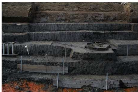
2 B区第36号溝跡 西壁断面 (2)