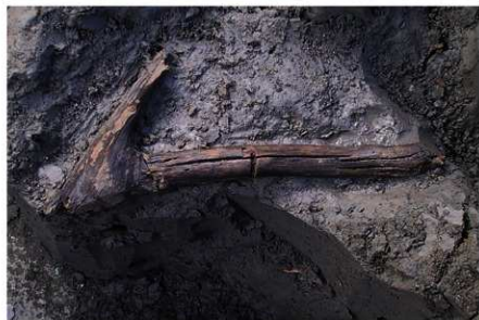
3 B区第36号溝跡 (木製品No 3) 出土状況