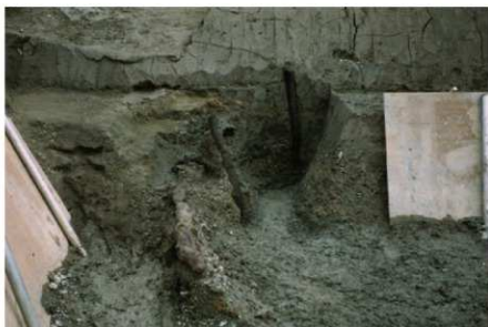
2 B区第36号溝跡北岸杭列