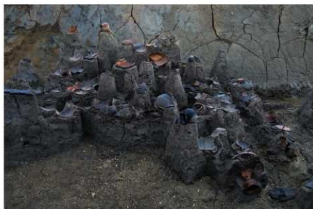
2 B区第36号溝跡P 66 G 付近（古墳時代前期） 遺物出土状況（西から）