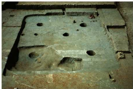
1 B区第38号住居跡 (南から)