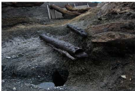
1 B区第3号清淤施設 2 (3)