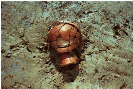
3 B区第20号住居跡 (No.12) 遺物出土状況