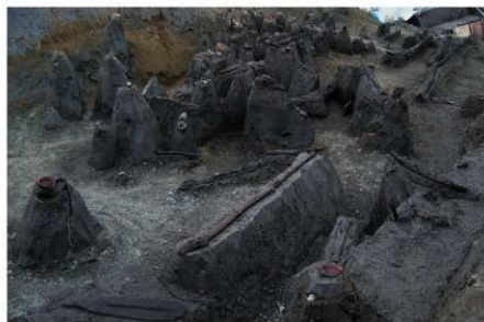
3 B区第36号溝跡P 66 G 付近（古墳時代前期） 遺物出土状況（南から）