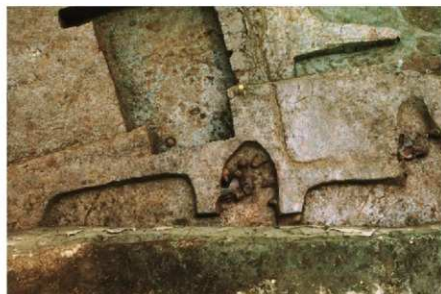
2 B区第29号住居跡 (西から)