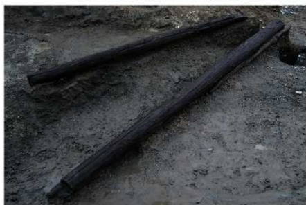
3 B区第3号溝跡施設2 (木製品No.7・8) (2)