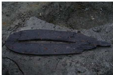
2 B区第36号溝跡 (木製品No 1) 出土状況