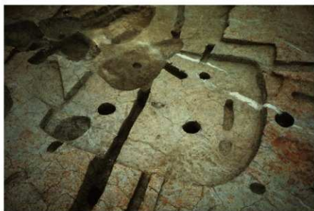
3 B区第38・39・40号 住居跡