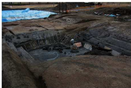
1 B区第3号溝跡全景 (南から)