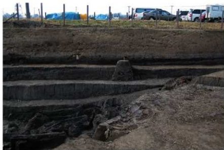
1 B区第36号溝跡 西壁断面 (1)