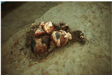
2 B区第20号住居跡 遺物出土状況(3)