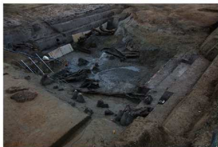
3 B区第3号溝跡全景 (北から)