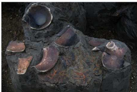
3 B区第36号溝跡 遺物集中出土状況 (1)