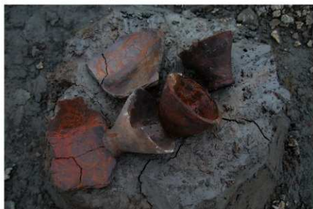
3 B区第36号溝跡 遺物出土狀況 (3)