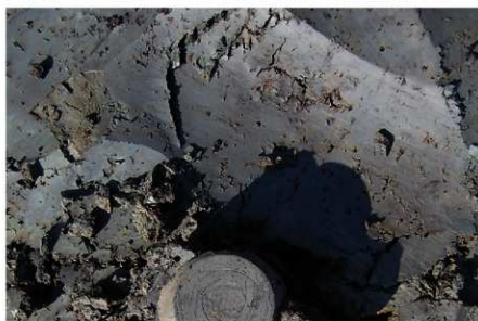
3 B区第3号满跡墨書土器 「三田万呂」出土状況 (3)