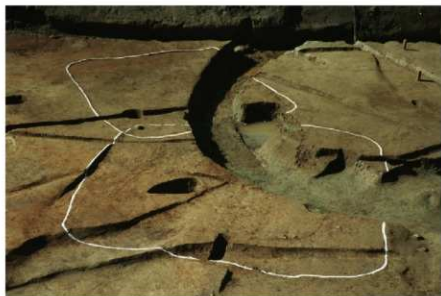
1 B区第15・21号住居跡 (東から)