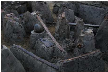
1 B区第36号溝跡P 66 G 北側木製品出土状況