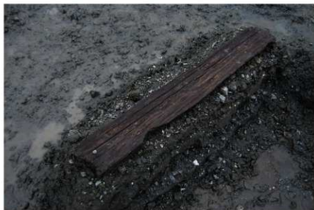
1 B区第3号溝跡出土状況 (木製品No.6)