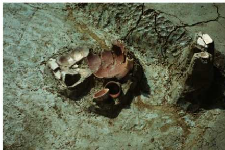
2 B区第38号住居跡北東 コーナー遺物出土状況