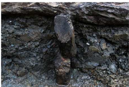
3 B区第3号清淤施設 1 (2)