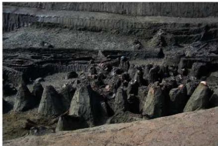
1 B区第36号溝跡北岸 (古墳時代前期) 遺物出土状況 (1)