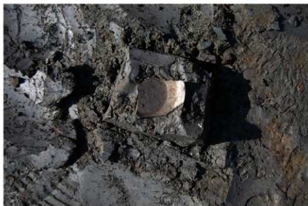
1 B区第3号满跡墨書土器 「三田万呂」出土状況 (1)