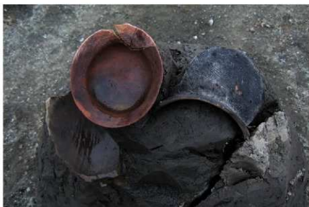
2 B区第36号溝跡 遺物出土状況