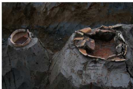
2 B区第36号溝跡 遺物出土狀況 (2)