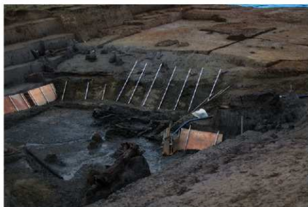
2 B区第3号溝跡全景 (南東から)