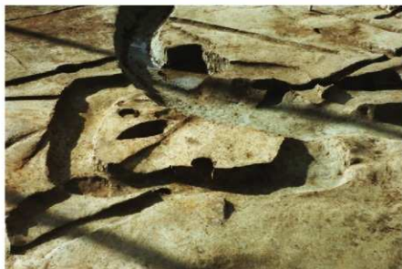
2 B区第15号住居跡掘り方 (東から)