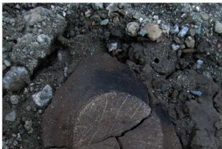
3 B区第36号溝跡 (No. 40) 遺物出土状況