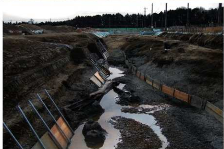
3 B区第36号溝跡全景 (中央から南)