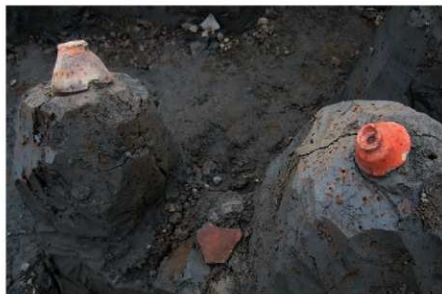
1 B区第36号溝跡 遺物出土狀況 (1)