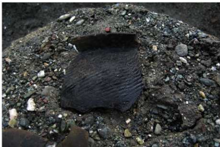
2 B区第36号溝跡 (No.152) 遺物出土状況