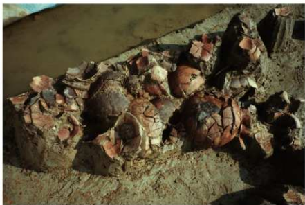
1 B区第20号住居跡 遺物出土状況(2)