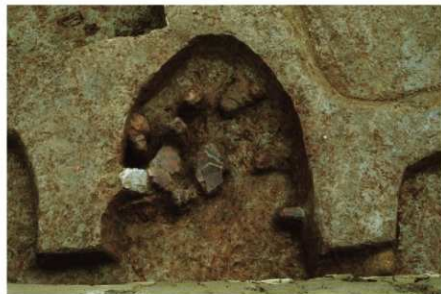
3 B区第29号住居跡力マド