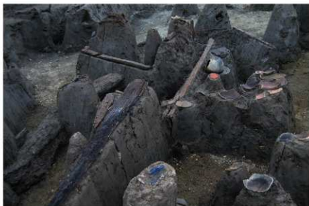
1 B区第36号溝跡P 66 G 付近遺物出土状況 (南から)