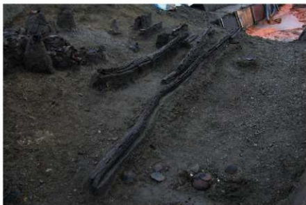
1 B区第36号溝跡施設 (北から)