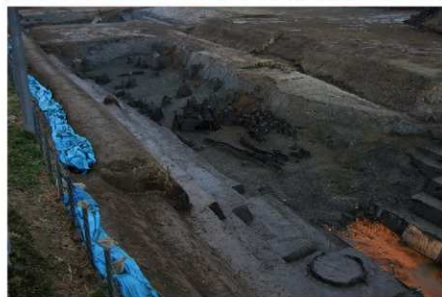
3 B区第36号溝跡北岸 (古墳時代前期汀線)