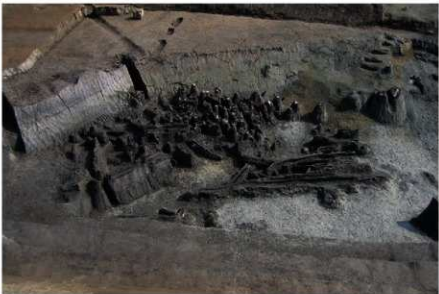
3 B区第36号溝跡北岸 (古墳時代前期) 遺物出土状況 (3)