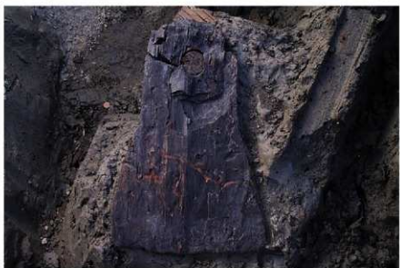
3 B区第36号溝跡 (木製品No 2) 出土状況