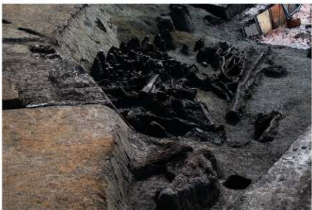
2 B区第36号溝跡北岸 (古墳時代前期) 遺物出土状況 (2)