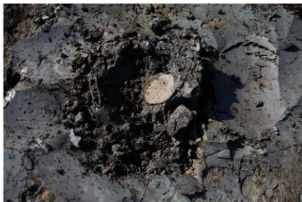
2 B区第3号满跡墨書土器 「三田万呂」出土状況 (2)