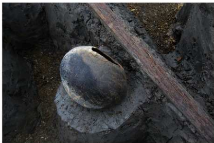
1 B区第36号溝跡 (No. 75) 遺物出土状況