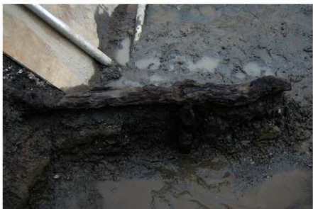
2 B区第3号清淤施設 1 (1)