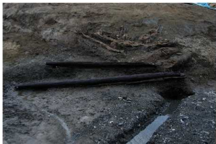
2 B区第3号溝跡施設2 (木製品No.7・8) (1)