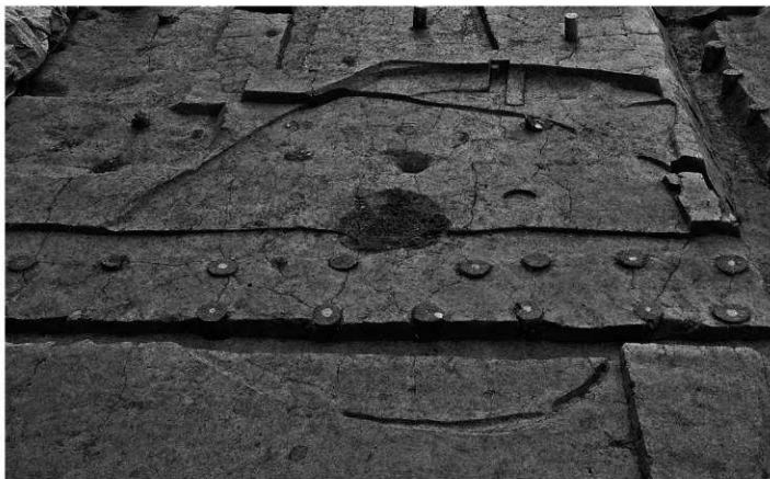
1. 竪穴住居1・2 (北から)