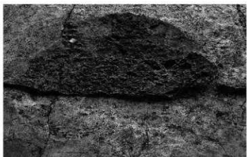
2. 竪穴住居1 中央穴と炭化物 (北から)