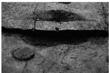
3. 竪穴住居1 中央穴断面 (北から)