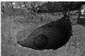
5. 竪穴住居3 柱穴 (西から)