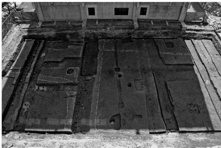
2. 近代畦畔と土坑全景（西から）