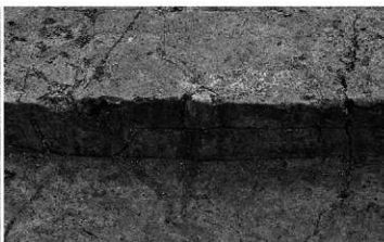
4. 竪穴住居1 東西a断面一壁体溝と床面一 (北から)