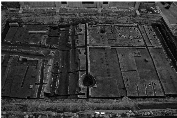
1. 遺構全景 (西から)