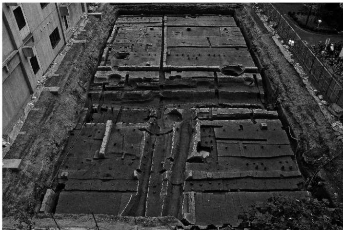
2. 遺構全景 (北から)