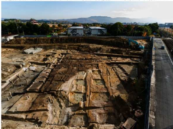
一条南大路と南北両側溝（西から）