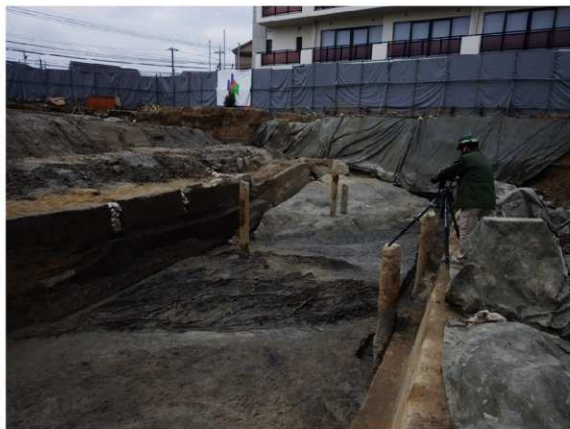
調査区中央部の最下層敷葉・敷粗朶（東から）