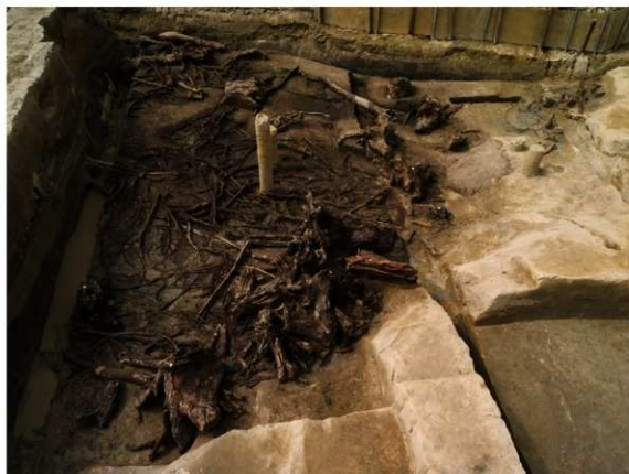
調査区西部の下層敷粗朶と切株（東から）