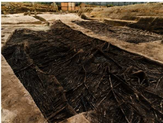
調査区東南部の敷粗朶（北東から）