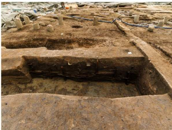
一条南大路北側溝のしがらみによる護岸（北から）