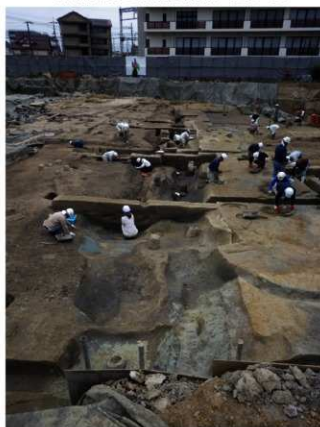
一条南大路北側溝（東から）