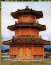
6 〈鼓楼(八角形建物)〉 歴史公園鞠智城のシンボルです。 音声解説