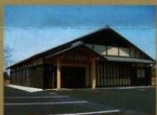
15 <研修施設> 講座などを実施しています。