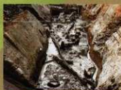
11 <貯水池跡> 木簡や百済系銅造菩薩立像、建築用材などの貴重な遺物が数多く見つかっています。