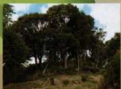
14 <涼みヶ御所> 望楼があったと伝えられています。