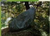
13 <ワクト石> その名のとおりカエルそっくり!