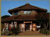
16 <長者館> 地元の物産品がいっぱい。食事でもできます。