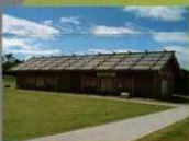
8 <兵舎> 防人たちの生活の場です。