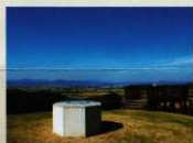
1 〈灰塚〉 360°大パノラマ、雲仙普賢岳も見えます。