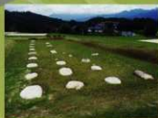
10 <宮野礎石> 当時の礎石をそのままに展示しています。