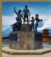
4 〈温故創生之碑〉 音声解説 鞠智城のシンボルです。「温故」は「調査研究」、「創生」は「整備による利活用」を意味します。