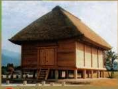
9 <板倉> 武器を保管した倉庫です。