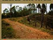
12 <西側土塁> 城の西側の防衛ラインです。