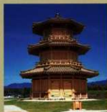
6<鼓楼(八角建物)> 歴史公園鞠智城のシンボルです。