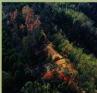
〈西側土塁線 シャカンドン〉 やせ馬状の尾根の外斜面上に土塁が築かれています。