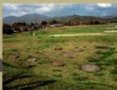
9<宮野礎石> 当時の礎石をそのまま展示しています。