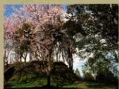
14<涼ヶ御所> のろし台があったと伝えられています。