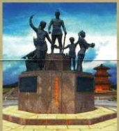
④〈温故創生之碑〉 鞠智城のシンボルです。音声解説