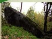
12<ワクド石> その名のとおりカエルそっくり！