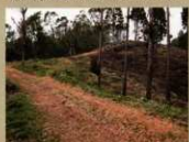
13<西側土塁> 城の西縁の防衛ラインです。