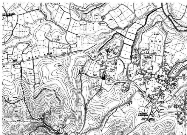
第2図 調査区位置図