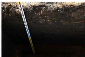
9. T 3 上層堆積状況