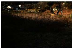
1. 調査区近景（北から）