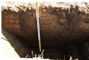
10. T 4 上層堆積状況