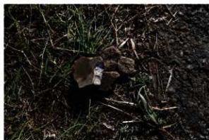
11. 調査区内出土（現代）