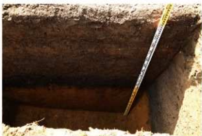
5. T1 上層堆積状況(1)