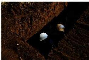
4. トレンチ精査状況