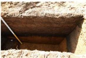
6. T1 上層堆積状況(2)