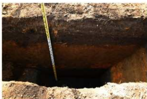
7. T2 上層堆積状況(1)