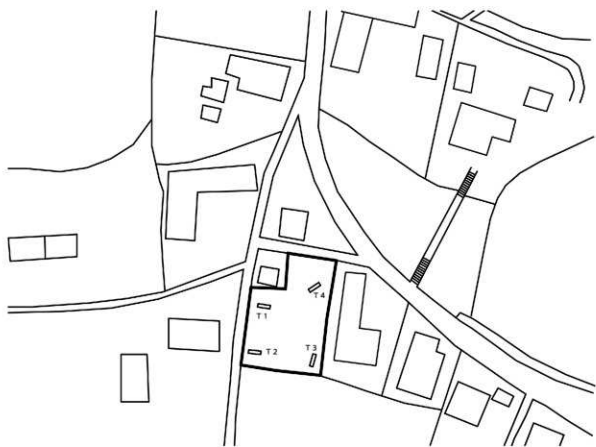
第3図 トレンチ配置図