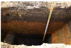
8. T2 上層堆積状況(2)