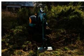
3. トレンチ掘削状況