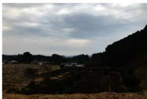
2. 調査区遠景（大迫遺跡方向から）