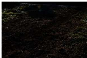
15. 作業後の様子（T 1）