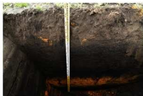
2. Tr.2 土層堆積状況 西から