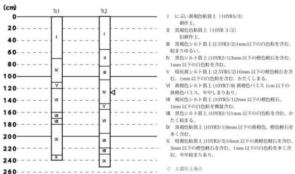
第4図 各トレンチ土層柱状図