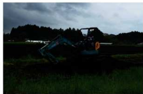
3. トレンチ埋め戻し状況