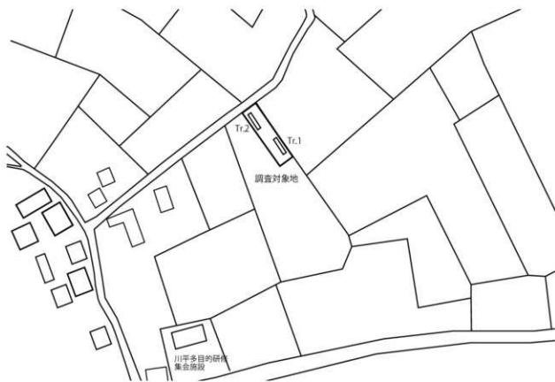
第3図 トレンチ配置図

このことより、当該地では耕作土より下はアカホヤ火山灰上の遺物包含層が残存していると考えられる。