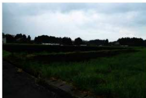
4. 調査終了状況 北から