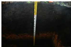
1. Tr.1 土層堆積状況 西から