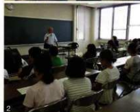
1.2.さかいでっこガイド隊の活動の様子