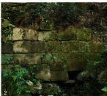
1.横尾谷水門 2.女山神籠石長谷水門