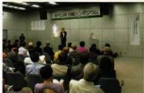
古代山城日韓シンポジウムの様子