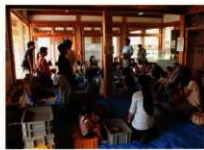
親子で勾玉づくり