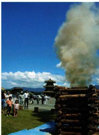
8月に実施したイベントでは、大宰府政庁跡から鞠智城まで見事に烽火によるリレーが成功した。写真は、最終中継ポイント米野山であった煙を確認して点火された鞠智城の烽火

「日本書紀」によると、古代、九州には唐と新羅の侵略に備え、大宰府政庁と各山城などを結ぶ「烽火」(のろし)による通信網があったとされている。今回の「古代山城サミット 山鹿・菊池大会」では、その烽火を再現、大宰府と鞠智城間を古代と同じ方法で結ぶ「烽火リレー」を実施する。烽火は、狼煙とも書き、その由来は、煙が多くでる狼の糞を燃料にしたことがあったからとされる。また狼の糞を加えると、煙が直上したとも言われている。