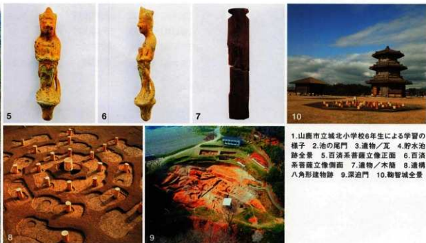
1.山鹿市立城北小学校6年生による学習の様子 2.池の尾門 3.遺物/瓦 4.貯水池跡全景 5.百濟系菩薩立像正面 6.百濟系菩薩立像側面 7.遺物/木簡 8.遺構八角形建物跡 9.深泊門 10.鞠智城全景