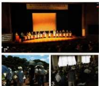
1.太宰府市景観・市民遺産会議 2.水城跡学習会 3.文化遺産ボランティア

太宰府市は、福岡市の南東約16kmに位置。約1350年前に市の西～北部にかけて水城・大野城が築かれたことを端緒に、西海道総轄、また軍事・外交にも携わった大宰府が設置された。現在、特別史跡3件、国史跡4件をはじめ市域の約15%が史跡指定されている。大宰府史跡の他にも学問の神として著名な太宰府天満宮があり、市内には年間600万人の観光客が訪問。また文教都市としても知られ、約9千人の学生が勉学に勤しんでいる。来年市制30周年を迎え、史跡・緑に恵まれた福岡都市圏の住宅都市として発展を続けている。