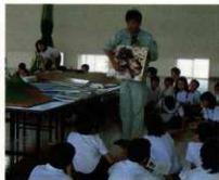
小学生を対象とした総合学習

毎週土曜日・日曜日の午前10時から午後3時（冬季・夏季休業あり）の間に屋島山上、高松城跡（玉藻公園）で観光ボランティアガイドが待機し、依頼に応じて現地でガイドを実施している。