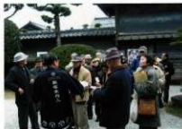
旧伊藤邸を説明する観光案内人

長崎街道飯塚宿（現在の本町商店街）での街あるき解説を行っている。（イベント企画時のみ）