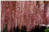
1.阿志岐山城跡第12トレンチ列石検出後像（正面から） 2.阿志岐山城跡第3水門全景 3.二日市温泉の夜景 4.武蔵寺の春