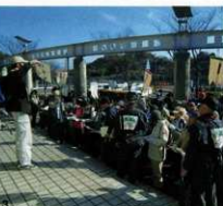
1.基肆城水門跡 2.基肆城跡シンポジウム 3.クロスロード文化研究会歴史散歩