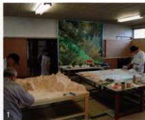
1.永納山の部屋 2.出前展示の様子

市のホームページ内で、永納山城跡を紹介するページを設け、永納山城跡の概要や、設置の背景、古代山城についての知識を深めてもらっている。また調査成果については、市報でも情報発信も行っている。