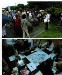
1.ファミリーふれあい史跡めぐり 2.おつぼ山神籠石ワークショップ