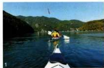
1.シーカヤック風景 2.金田城探訪会

対馬は、日本の中で朝鮮半島に最も近いという地理的条件から、大陸からの石器文化、青銅器文化、稲作、仏教、漢字などを伝える日本の窓口であった。また、朝鮮半島の間では古くから貿易などの交流が盛んで、この活発な交流から、数多くの書物、仏像、建造物、朝鮮式山城の金田城跡や古墳などの文化財が残っている。