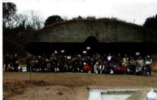
史跡ガイドボランティアによる「ゆくはし探訪」

平成23年度新規事業。市内小中学校児童・生徒とその保護者が対象。夏休みの1日を利用して、市バスで市内の遺跡、歴史資料館を見学。