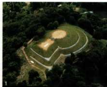
1. 妙見山古墳 2. 村上水軍博物館

また、毎年度末には、能島城跡の発掘調査の成果を市民に知ってもらうための説明会を開催している。