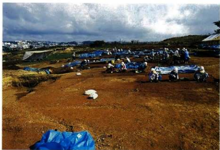
発掘調査作業の風景