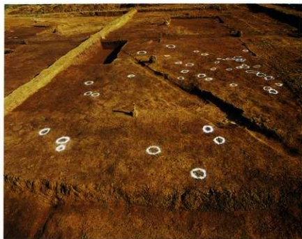
検出されたピット群