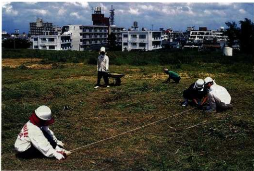
調査の開始 (グリッド設定作業)