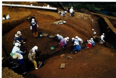
発掘調査作業の風景