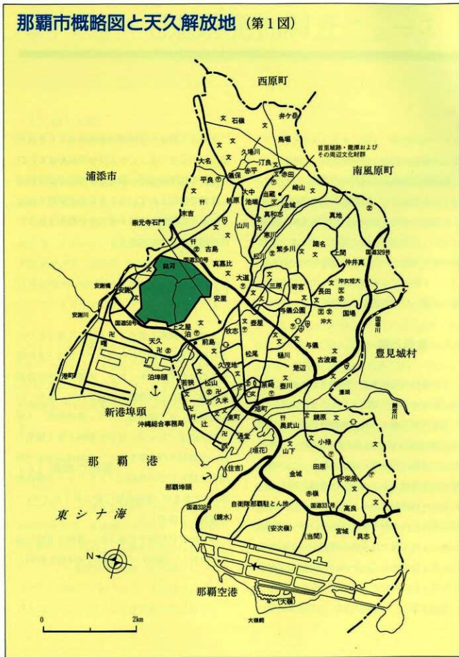
那覇市概略図と天久解放地 (第1図)