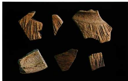
タイ産半線（土器）の壺と蓋