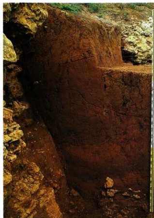
崖下の第2貝塚層序