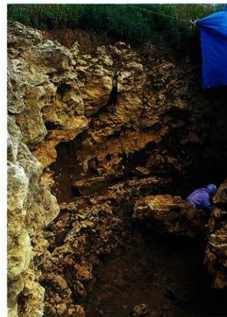
崖下第2貝塚の発掘