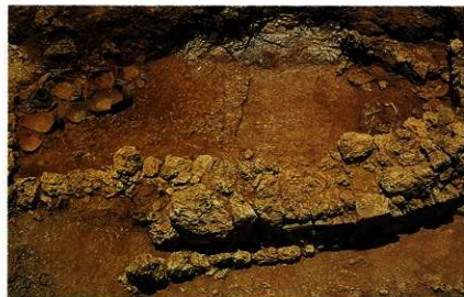
崖下の第47号墓（風葬墓） の人骨出土状況