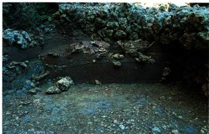
崖下47号墓（風葬墓） 内の層序