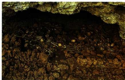
崖下4号墓（風葬墓） の人骨出土状況