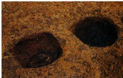
炉跡（左が煮炊用、右が火種用）