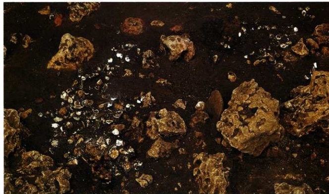
崖下の第3貝塚の遺物出土状況