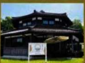
16 (粟と空) 山農和菓のスイーツカフェです。