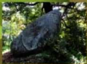
14 (ワクド石) その名のとおりカエルそっくり!