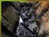
11 (貯水池跡) 菩薩立像や木龍の出土地です。