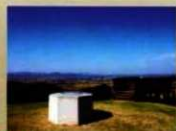
① (灰塚) 360°大パノラマ、雲仙普賢岳も 見えます。