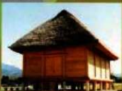
9 (板倉) 武器を保管した倉庫です。