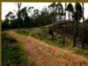
12 (西側土塁) 城の西側の防衛ラインです。