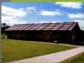
8 (兵舎) 防人たちの生活の場です。