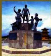
④ (温故創生之碑) 鞠智城のシンボルです。