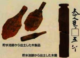
貯水池跡から出土した木製品

貯水池跡の上流部では貯木場が発掘調査されました。束ねた材木や藁などの建築材が出土しています。