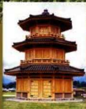
⑥ (鼓樓(八角形建物)) 歴史公園鞠智城のシンボルです。