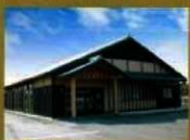
15 (研修施設) 講座などを実施しています。