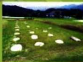
10 (宮野礎石群) 当時の礎石を展示しています。