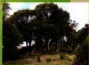
13 (涼みヶ御所) 望楼があったと伝えられます。