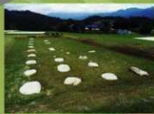
10 〈宮野礎石〉当時の礎石をそのままに展示しています。