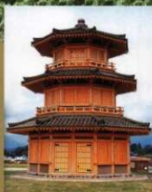
6 〈鼓楼（八角形建物）〉 歴史公園鞠智城のシンボルです。