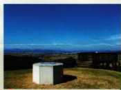
1 〈灰塚〉 360° 大パノラマ、 雲仙普賢岳も見えます。