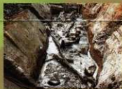
11 〈貯水池跡〉木簡や百済系銅造菩薩立像、建築用材などの貴重な遺物が数多く見つかっています。