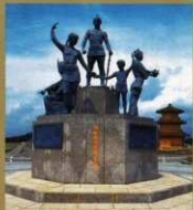
4 〈温故創生之碑〉 鞠智城のシンボルです。 「温故」は「調査研究」、「創生」は「整備による利活用」を意味します。