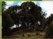
14 〈涼みヶ御所〉望楼があったと伝えられています。