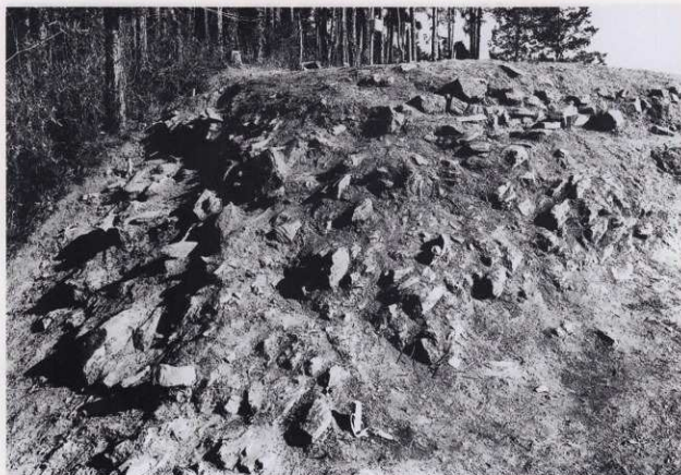
平場 1 石積3