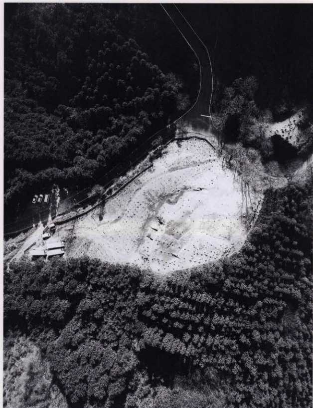
要害山城（直上より）