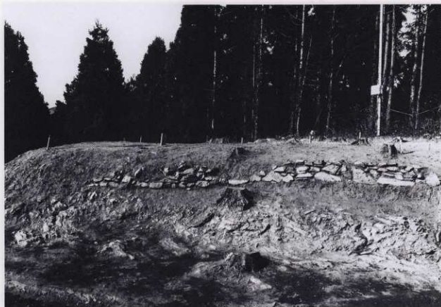
平場 1 石積 1 (遠景)