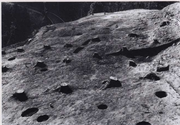
平場 2 (北東から)