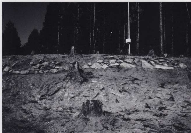
平場 1 石積 1 (近景)