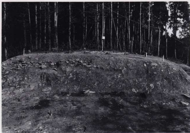
平場 1 石積 2