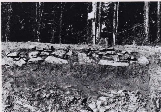
平場 1 石積 1