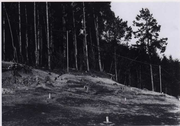
平場 2 (南から)