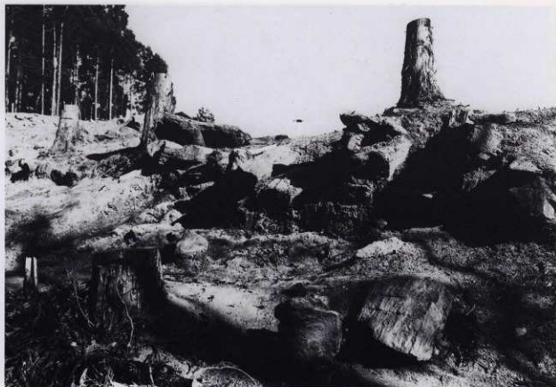
平場 3 石積