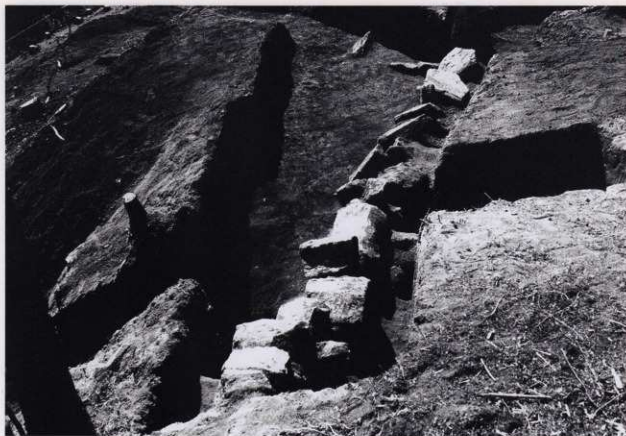
平場 2 石積 1