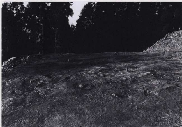
平場 2 (北から)