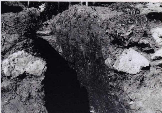
平場 1 トレンチ 1