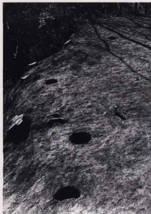
平場 3 (東端)