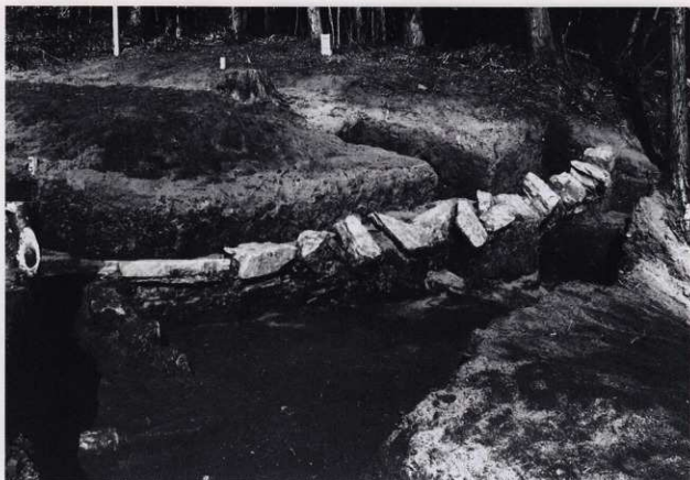
平場 2 石積 1