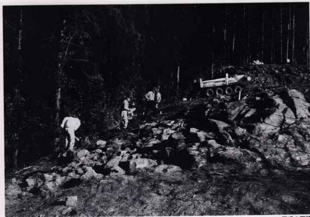
平場 3 石積