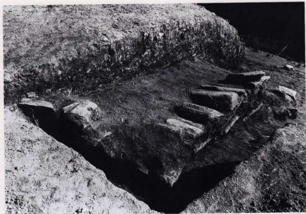
平場 2 石積 4