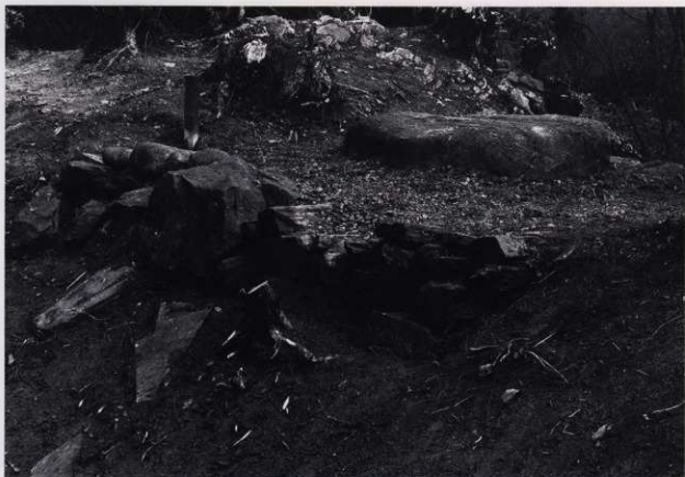
平場 5 石積