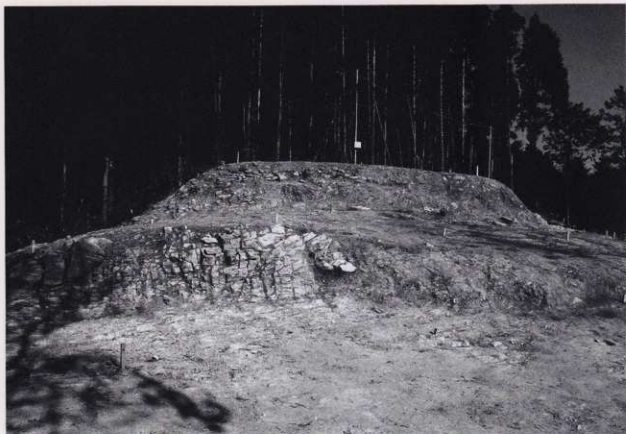
平場 1・2・3 (南から)