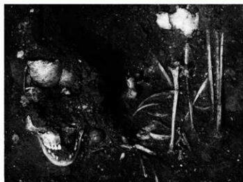
かいごう せいかつ だんせい いこつ 介護を受けて生活した男性の遺骨 いりえかいづか どうや こちょう 【入江貝塚（洞爺湖町）】