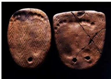
あしがたつきどばん 足形付土版 かきのしまいせき はこだてし 【垣ノ島遺跡（函館市）】