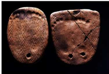
こあしがたどはん 子どもの足形のついた土版

垣ノ島遺跡（函館市）には6000年という長い期間にわたり、人々がくらしていました。出土したものには、真っ赤な漆をぬった土器や、変わった形の土器などがあります。約7,000年前のお墓からは、小さな子どもの足形がつけられた「土版」も見つかっていて、縄文人の、子どもを愛する心が伝わってきます。