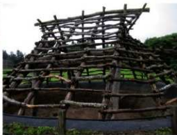
おおふね おおふね せき せき はこだて はこだて し