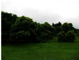
ばし ばし いし いし いしぎら いしぎら クリ林 クリ林 とすり石 とすり石 ・石皿 ・石皿