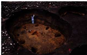
たてあな たてあな たても たても のあと のあと 復元 ほくげん とその骨組 ほねぐみ の復元 ふくげん (大船遺跡【函館市】)