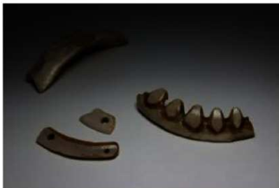
きば づ そしやくびん イノシシの牙で作られた装飾品