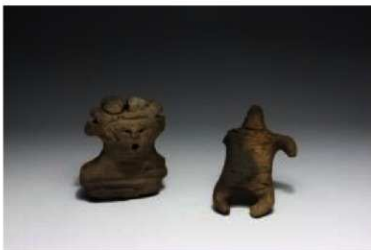
どぐう やく ねんまえ 土偶 (約2,800年前)

たかさご かいづか どう や こちょう かいづか ほか み ほかあな どき 高砂貝塚（洞爺湖町）では貝塚のほかにお墓がいくつも見つかっています。墓穴には土器など そのもの いたい ぬば ほかあな の供え物があり、遺体にはベンガラという赤い粉がふりかけられています。虫歯でもないのに歯 ぬ ふうしゅう し ほね あか かあ おな ほかあな ほねあな を抜いてしまう風習を示す骨や、赤ちゃんとお母さんを同じ墓穴に葬ったものも見つかりました。 かいづか かいりい ほかあな しつど 貝塚からは、タマキビ、ホタテ、アサリなどの貝類や、マグロ、シカ、イルカなどの骨が出土 しました。特にアサリやカレイが多くみられることから、かいづか しゅうへん すな はま はったつ 貝塚周辺には砂浜が発達していたこと しゅうもん じたい お きこう さむ うみ とお し がわかり、縄文時代の終わりごろには気候が寒くなって海が遠のいていったことを示しています。