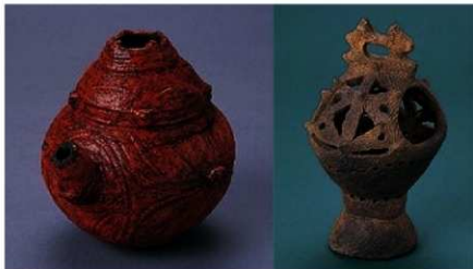
うるしぬりどきびだりごころかたちどきみぎ 漆塗りの土器（左）と香炉のような形の土器（右）