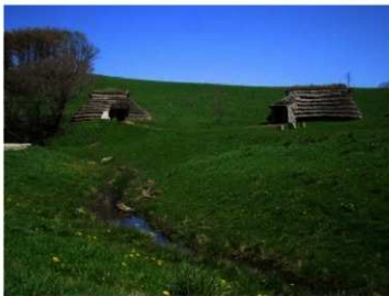
ふくげん たてあなでのもの 復元された竪穴建物