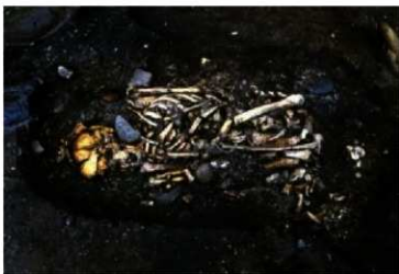
てあし お ま ねいそつ いたい 手足を折り曲げて埋葬された遺体 やく ねんまえ (約4,500年前)