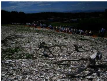
ふくげん かいづか 復元された貝塚

きた こがね かいづか だてし ふん か わん かいづか なか おお ちた 北黄金貝塚（伊達市）は噴火湾にある貝塚の中でも大きなもので、豊かなくらしがあつたこと わ が 分かります。ホタテの貝がらやシカの骨が、きちんと重ねられたり、ならべられたりした状態 しつど ひと ほね まいそう じやうたい み す で出土しました。また、人の骨も埋葬された状態で見つかっています。ただ捨てたのではなく、 ひと どうぶつ もの いのち よ おく おく ば しんせい ばしょ 人や動物、そして物の命をあの世へ送る「送り場」として、とても神聖な場所でした。