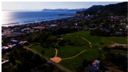
ひがしかの み いせき 東側から見た遺跡