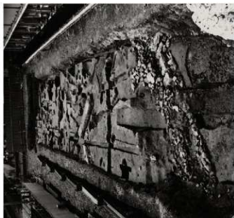
(1) FKJ06-2 南 調査区全景 (北)