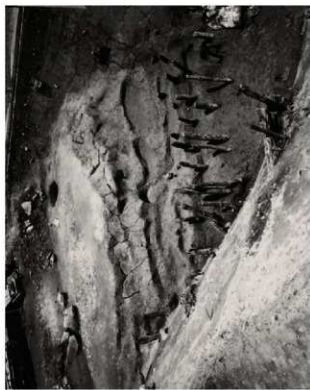
(4) FKJ06-4 外堀東岸（西）