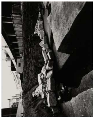
(4) FKJ06-1-2 土橋南面石垣背後の石列 (北)