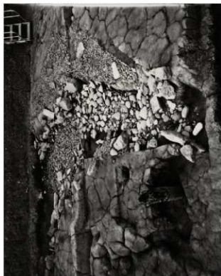
(4) FKJ06-3 北 池① (東)