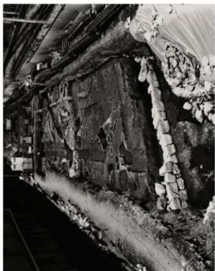
(1) FKJ06-2 北 調査区全景 (南)