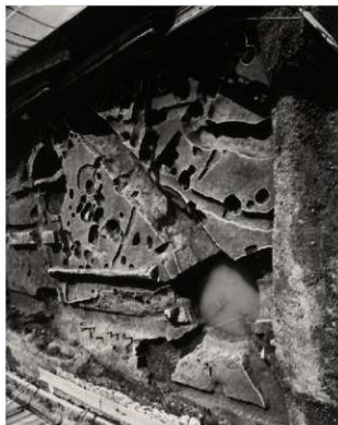
(2) FKJ06-3 古代の遺構 (南)