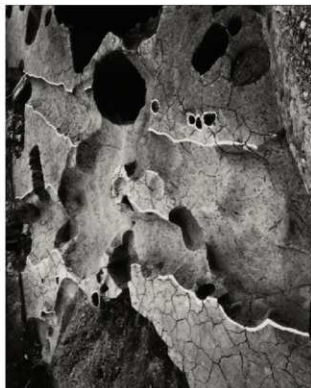
(3) FKJ06-4 古代の遺構 溝 64247・249 (西)