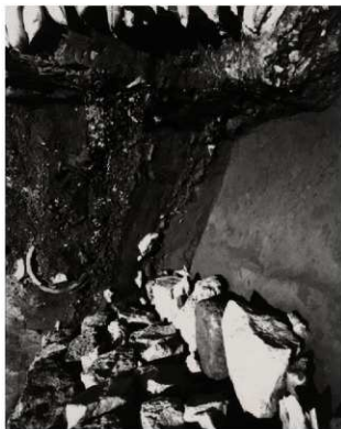
(2) FKJ06-1-1 石垣根固め状況