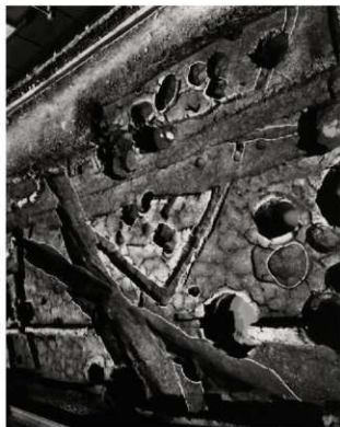
(1) FKJ06-2 古代の遺構 (北)