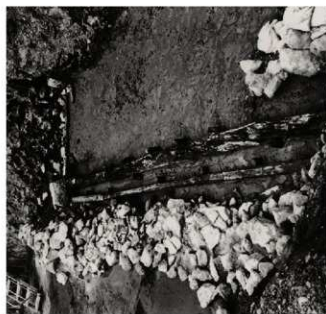
(4) FKJ06-2 南 北面石垣胴木組 (東)