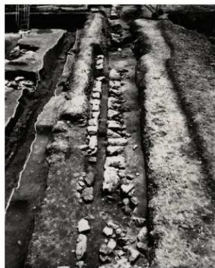
(3) FKJ05-4 南側立会部分 石組溝 (西)