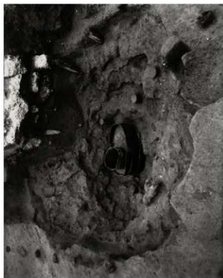
(4) FKJ05-3 井戸 53064 (南西)