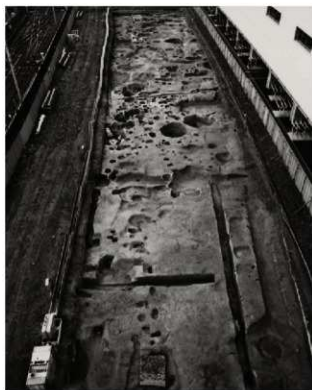
(2) FKJ05-4 調査区全景 (北)