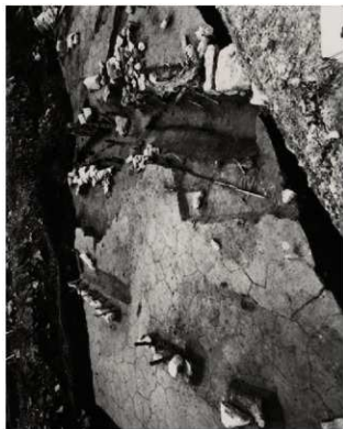
(4) FKJ06-3 南 (西)