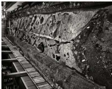
(1) FKJ06-3 北 調査区全景 (南)