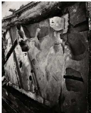
(3) FKJ06-1-3 (西) 手前：06-6-2 (福井市分)