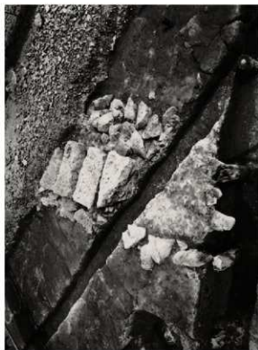
(2) FKJ06-2 南 北人分門北面枡形石垣 (西)