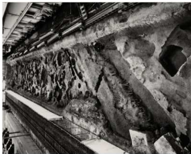
(1) FKJ06-4 調査区南側（土居から南）