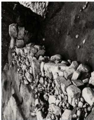
(2) FKJ06-1-2 土橋北面石垣 (東)