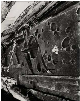
(3) FKJ06-3 南 調査区全景 (南)