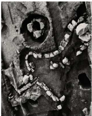
(3) FKJ06-2 北 池③ (北西)