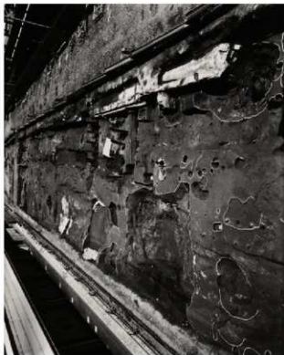
(1) FKJ05-3 調査区全景 (南)