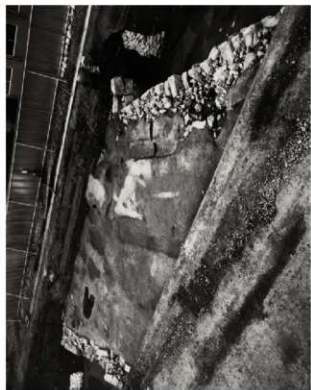
(1) FKJ06-1-2 土橋上面 (東)