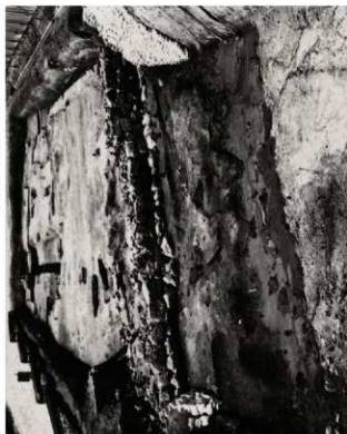
(1) FKJ06-1-1 調査区全景 (北)