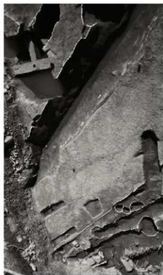
(2) FKJ06-3 北 砂利敷道路 (西)