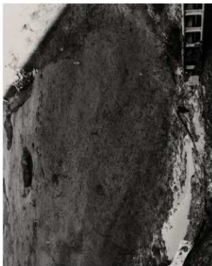
(4) FKJ06-1-4 (南)