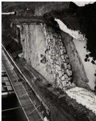
(3) FKJ06-1-2 調査区全景 (南)