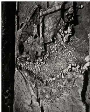
(3) FKJ06-3 北 池① (西)