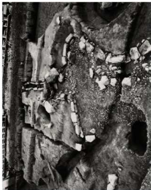
(2) FKJ06-2 北 池② (西)