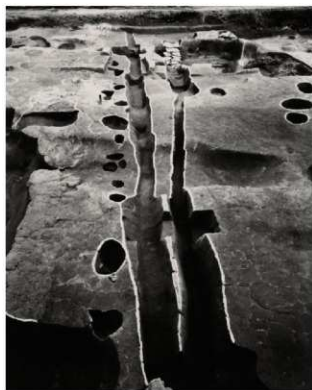
(4) FKJ05-4 区画溝 54049・70 (西)