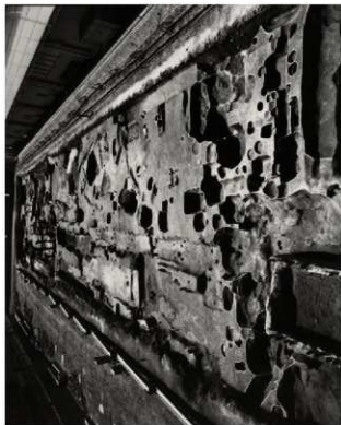
(2) FKJ05-3 調査区全景 (北)