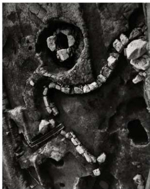
(4) FKJ06-2 北 池④ (北西)