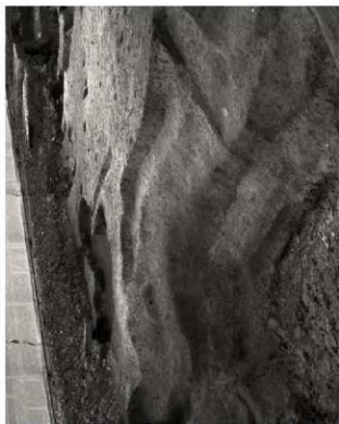
(3) FKJ06-4 外堀西岸・土居東斜面（北）