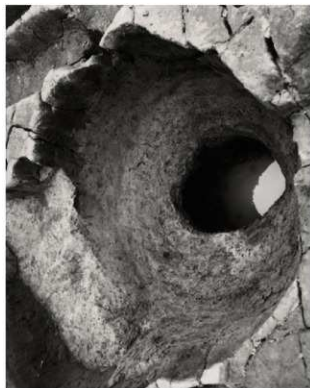
(4) FKJ06-4 古代の遺構 井戸 64245 (東)