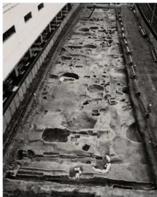
(1) FKJ05-4 調査区全景 (南)