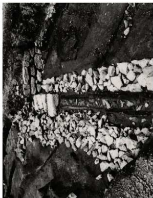
(3) FKJ06-2 南 北面石垣 (東)