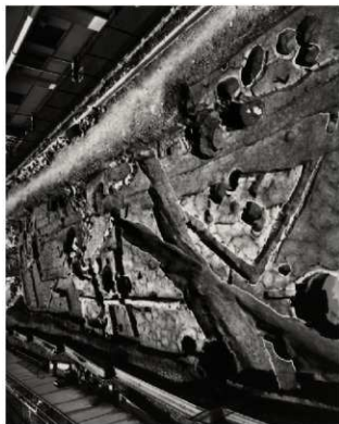
(2) FKJ06-2 北 調査区全景 (北)