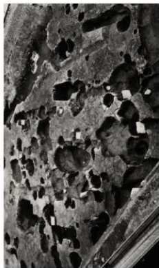
(2) FKJ06-4 屋敷地③柱穴群（西）