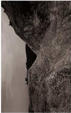
(1) 堀切SD01検出状況(西より)