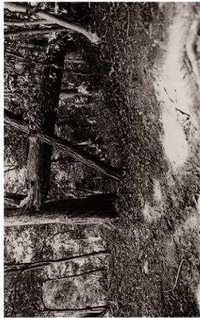
(3) 堀切SD05東半部確認状況(北西より)