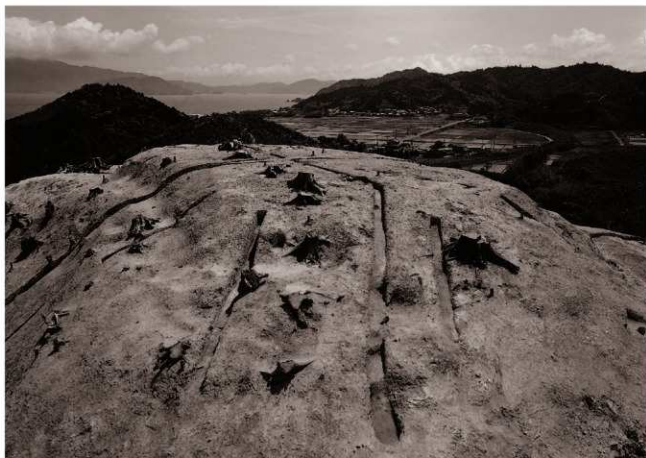
(1) 平坦面C1～C5検出状況（南西より）