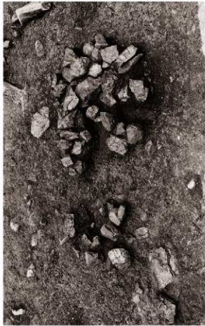
(3) 集石1検出状況 (南西より)