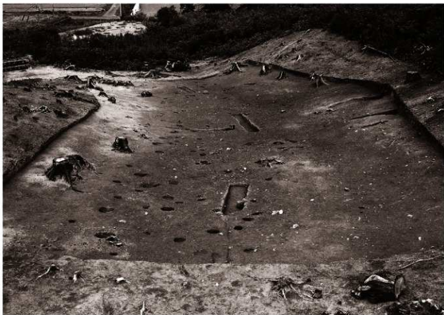
(2) E地区全景 (南東より)