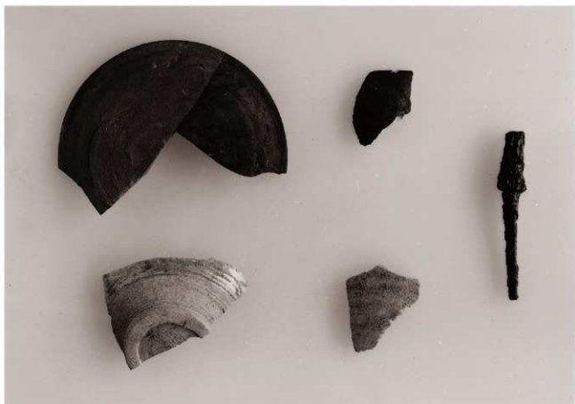
(1) A・C地区出土土器・鉄器