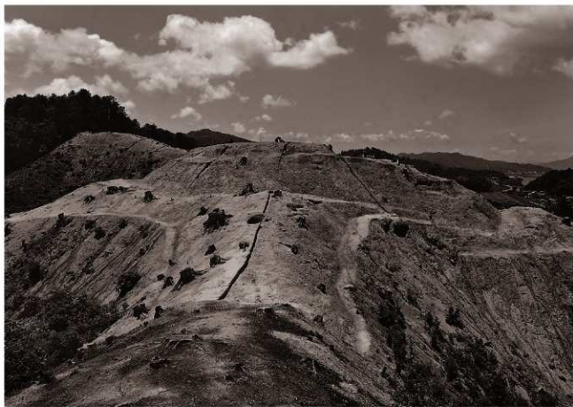
(1) C地区全景 (北東より)