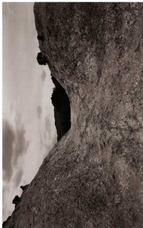
(4) 堀切SD04検出状況(北西より)