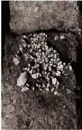
(1) 土器集中地区1検出状況 (南東より)