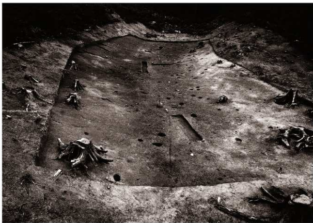
(1) E地区全景 (北西より)