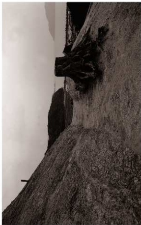
(2) 堀切SD02検出状況(南より)