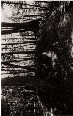
(1) 土塁SA01確認状況(北東より)