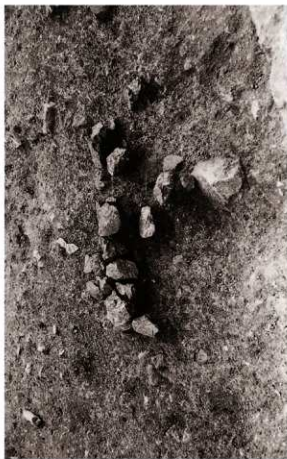
(4) 集石2検出状況 (南西より)