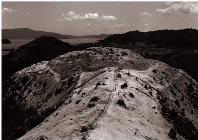
(2) C地区全景 (南西より)