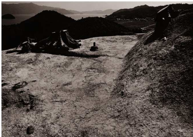
(2) 平坦面C4検出状況（南西より）