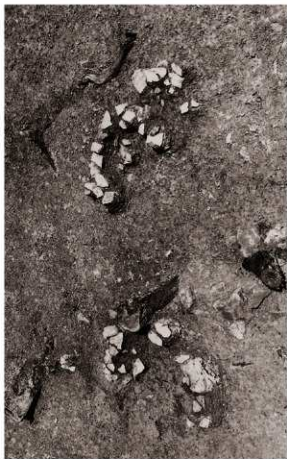
(2) 土器集中地区2検出状況 (南より)