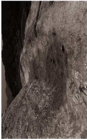
(3) 堀切SD03検出状況(南西より)