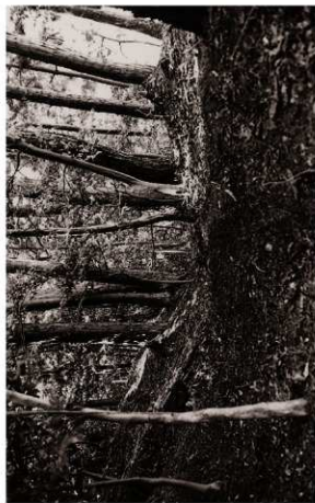
(4) 堀切SD05西半部確認状況(南東より)