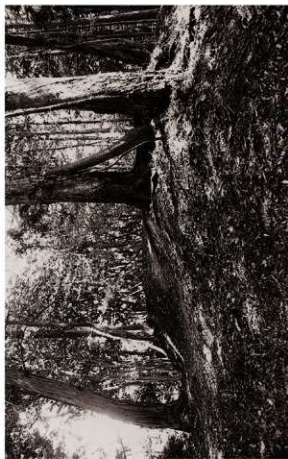
(2) 土塁SA01確認状況(北西より)