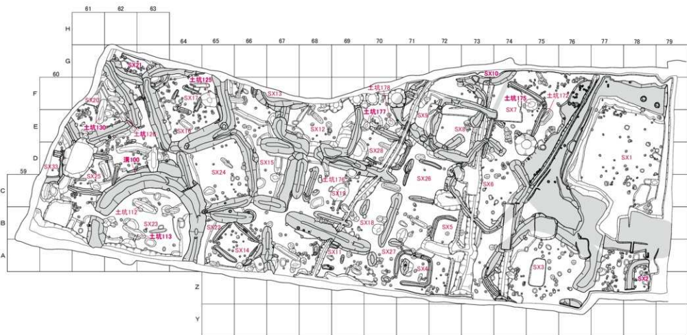
第10图 調査Ⅱ区下層遺構図(2) 平成13・14年度(縮尺1/400)