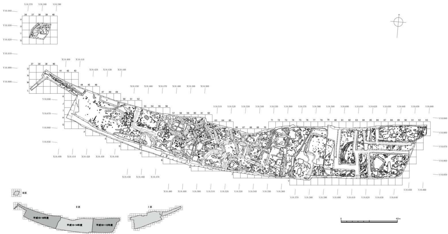
第7図 調査Ⅱ・Ⅲ区下層遺構全体図（縮尺1/800）