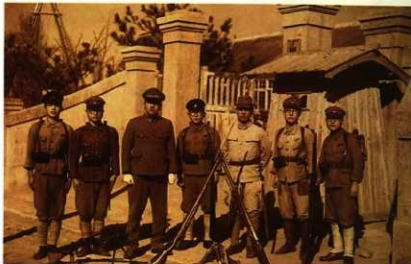
旧種子島中学校の正門と中学生

幸い私の家は市街地より離れた木々に囲まれた中野部落でしたから、少しは気が楽でした。それでも空襲警報のサイレンが鳴る度に壕に