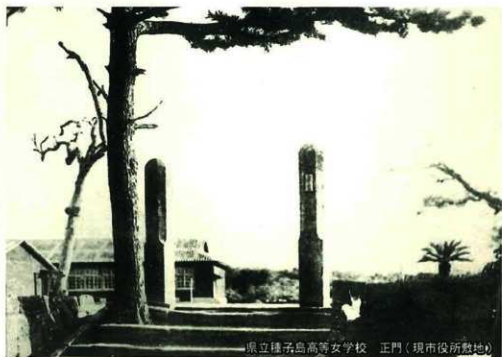
県立種子島高等女学校 正門（現市役所敷地）