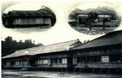
古田校舎全景 古田尋常高等小學校増築記念写真