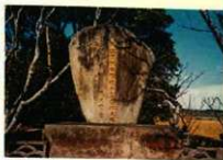
飛行場跡地に建つ石碑