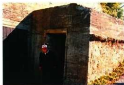
飛行場の司令室の入口

徴用工員や私達の宿舎の跡がどうなっているのか、どうしても見たかったからです。勿論当時の姿など何も残っていませんでしたが、宿舎の横に流れていた川は変わりありませんでした。宿舎の跡地は一面の田圃になり、収穫の後で雑草が生えていました。