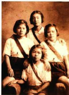
昭和17年女学校の友人達と