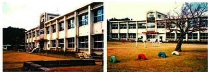
現在の古田小学校

いらしたそうですが、高齢になり大阪の息子さんの所へ行き、もう亡くなられたと話して下さいました。 思いがけない事だったので、とっても嬉しかったです。時々当時の頃を思い出し、あの人、この人はその後どんな人生を送られただろうか。と思っていた一人の消息が分かったので……。