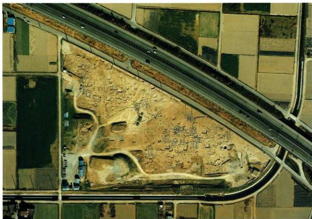
中堀遺跡空中写真