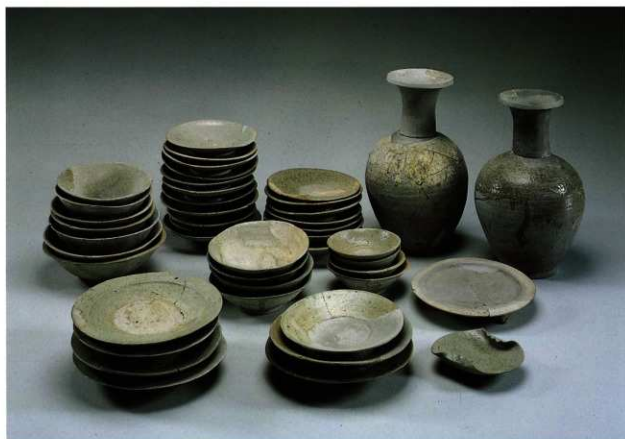
第54号掘立柱建物跡出土灰釉陶器