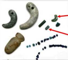
石製品・ガラス製品

鉄製品の出土量や砥石の使用痕に加えて、小型の工具、鉄製品の裁断片も出土していることから、大原遺跡において鉄製品の生産が行われていた可能性もあります。