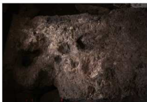
岩陰部 7号灰ブロック検出状況 (北東から)