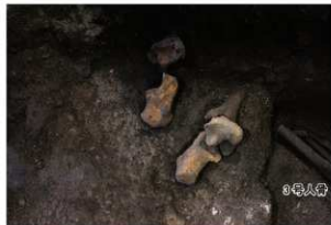
5号人骨出土状況 下肢（北東から）