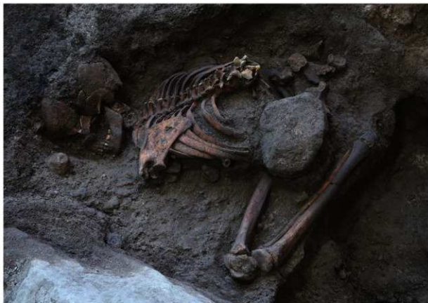
4号人骨出土状況 第2面（北から）