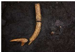
前底部緩斜面 A1 9 層 鹿角・押型文土器出土状況