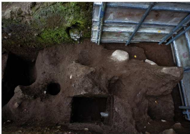
前庭部緩斜面 A0 ~ A2 10 層検出状況 (第 5 次調査終了時)