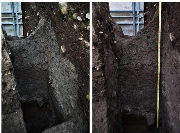
前底部緩斜面 A1 深掘区 10 層堆積状況