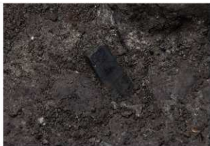
前庭部緩斜面 A1 深掘区 10 層 黒曜石原石出土状況