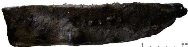
岩陰部 第1セクションベルト オルソ画像