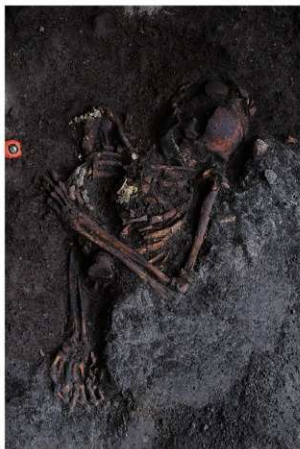
10号人骨出土状況 第2面 (南西から)