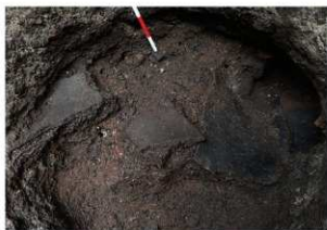
前底部緩斜面 凹形落とし 土器出土状況