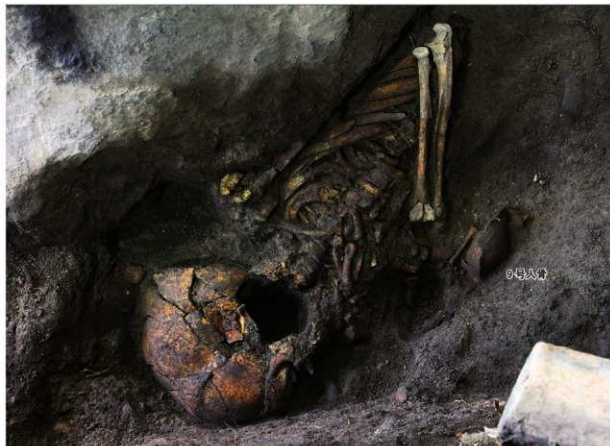
8号人骨出土状況 第1面（北東から）