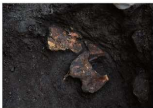
前底部緩斜面 凹形落とし 獣骨出土状況