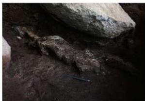
岩陰部 8号灰ブロック検出状況 (南から)