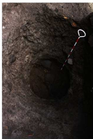
前底部緩斜面 円形落とし遺物出土状況（左：最上面 獣骨、右：2層中 土器）