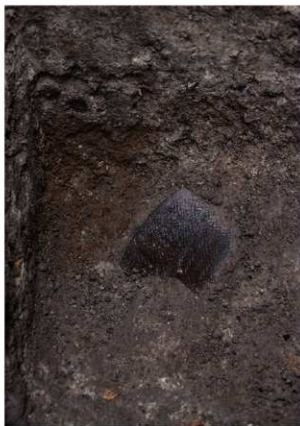
前庭部緩斜面 A1 深掘区 10 層最下面 押型文土器出土状況