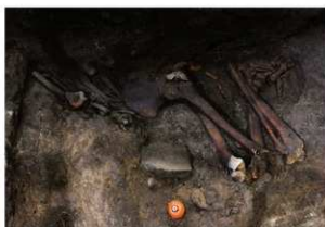
3号人骨出土状況（北東から）