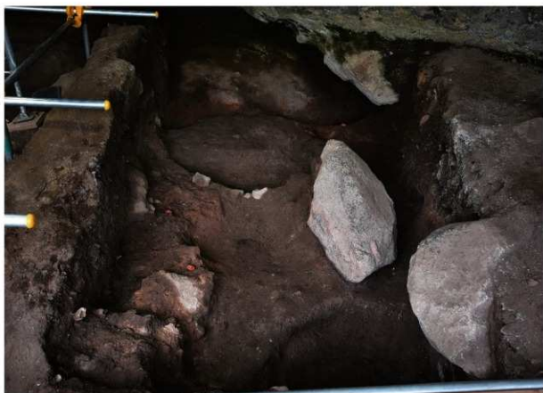
岩陰部 8・9列 第5次調査終了時掘削面