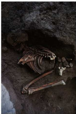
4号人骨出土状況 第3面（北西から）