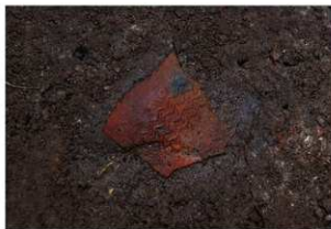
前庭部緩斜面 A1 深掘区 10 層 押型文土器出土状況