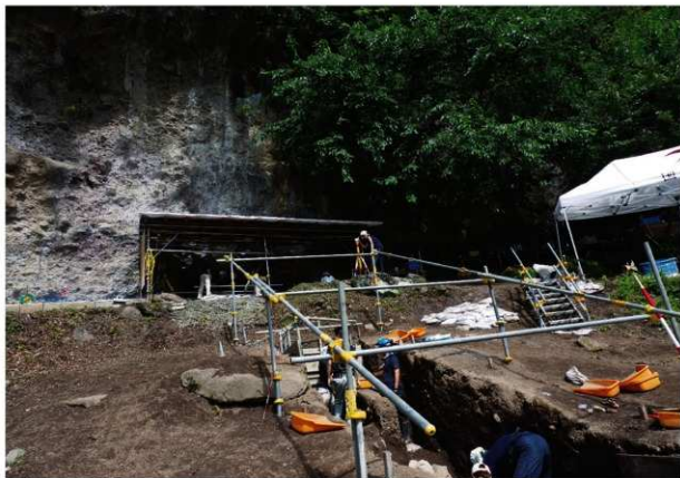
遺跡近景 (第 5 次調査・2018 年 9 月撮影)