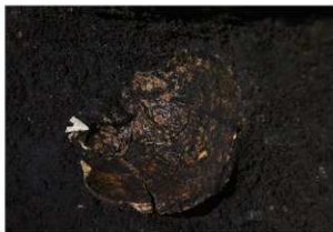
前底部緩斜面 A1 9 層 石鏃・獣骨出土状況