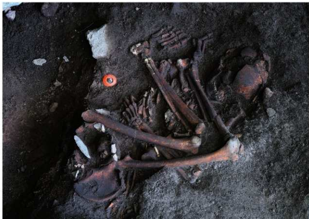
10号人骨出土状況 第1面 (南西から)