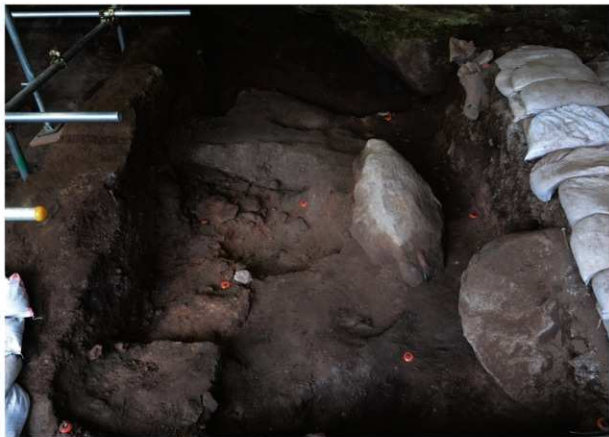
岩陰部 8・9列 第4次調査終了時掘削面