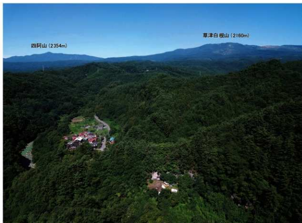
遺跡遠景と周辺地形（第8次調査・2022年8月撮影）