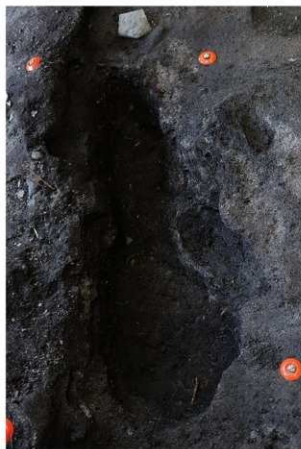
岩陰部 性格不明遺構 (北東から)