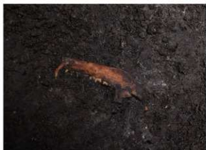
前庭部緩斜面 A1 深掘区 10 層 獣骨出土状況 (2)