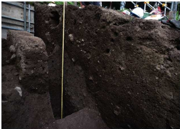
前底部緩斜面 A0 - A1 北東壁 土層堆積状況