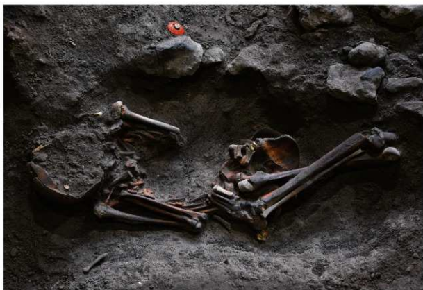
15号人骨出土状況 第1面（北西から）