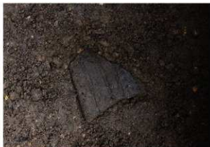
前底部緩斜面 A2 9 層 沈線文土器出土状況