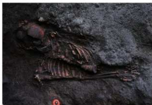
10号人骨出土状況 第2面 (北西から)