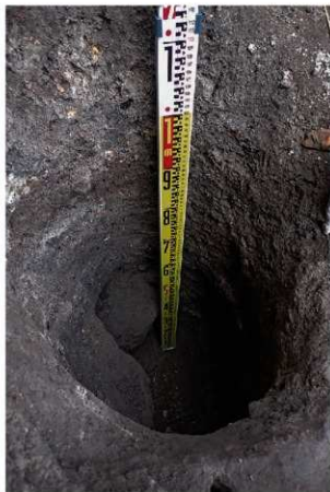
前底部緩斜面 円形落とし検出状況（第7次調査撮影）