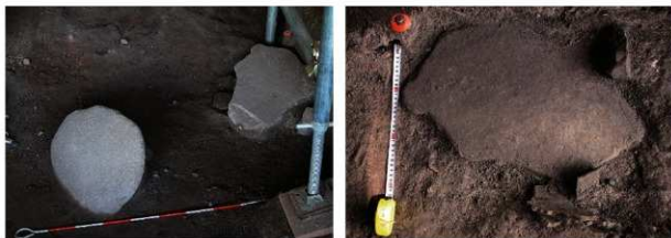
岩陰部 ハ6・ハ7 埋葬に関連する可能性のある板状礫 (左：南東から、右：南西から)