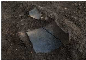
前底部緩斜面 A0 8 層 沈線文土器出土状況