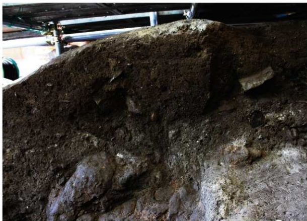
岩陰部 第2セクションベルト土層断面 (ロ・ハ列)