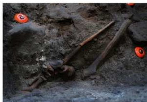
2号人骨出土状況 右下肢（北西から）