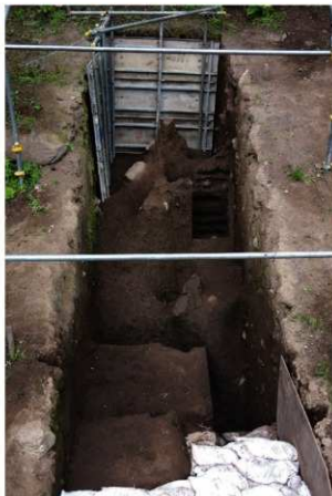
前庭部緩斜面 A トレンチ 第 5 次調査終了時検出面