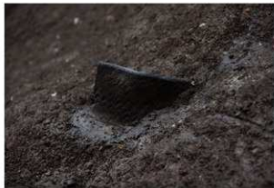
前底部緩斜面 A1 10 層最上面に露出する押型文土器