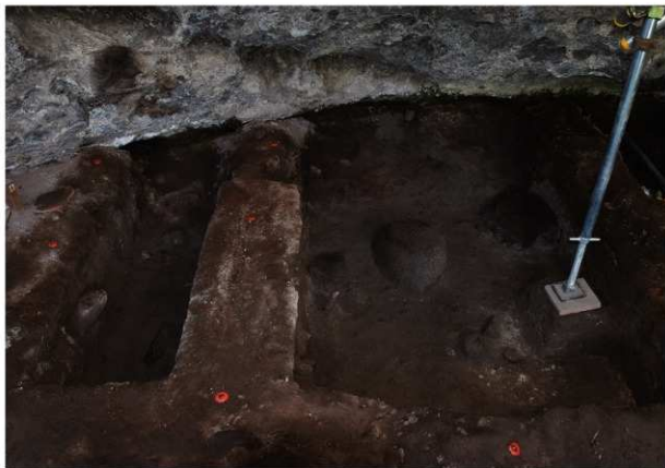
岩陰部 5～7列 第4次調査終了時掘削面