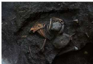
4号人骨出土状況 第1面（北西から）