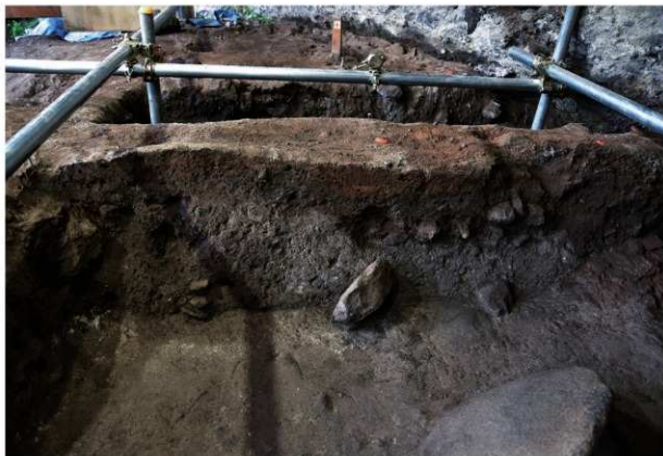
岩陰部 第1セクションベルト土層断面