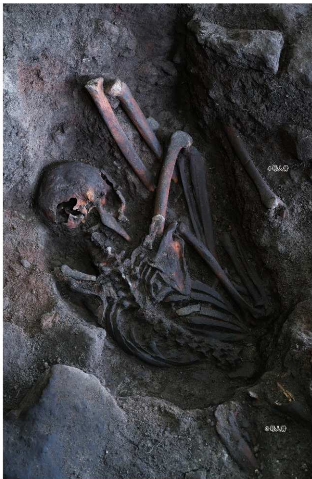
1号人骨出土状況 第1面 (第3次調査・南西から)