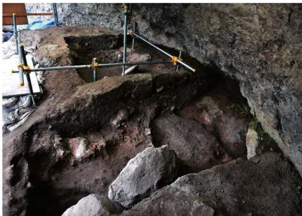
岩陰部 調査区全景 (第 5 次調査終了時)