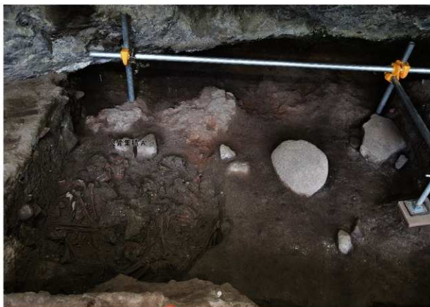
岩陰部 5～7列 第5次調査終了時掘削面