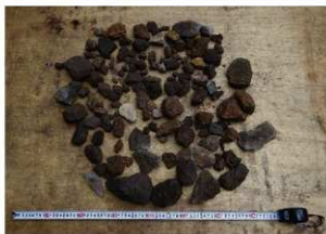
岩陰部 2号集石 (左: SB1 包含状況、右: 礫)