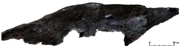
岩陰部 第2セクションベルト オルソ画像