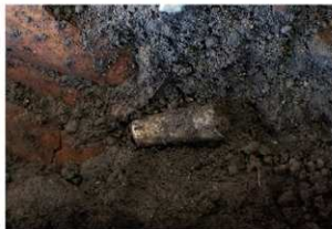
4号人骨 肋骨付近 ツノガイ製ビーズ出土状況