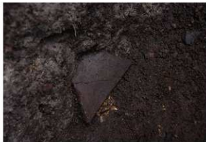
前底部緩斜面 A2 10 層最上面 押型文土器出土状況