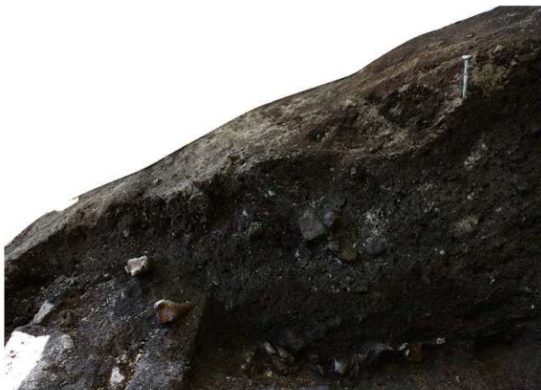
岩陰部 第2セクションベルト土層断面 (イ・ロ列)