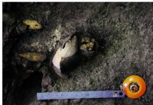
9号人骨出土状況（北東から）