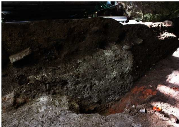
岩陰部 第2セクションベルト土層断面 (ハ・ニ列)