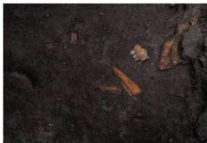
前庭部緩斜面 A1 深掘区 10 層 獣骨出土状況 (1)