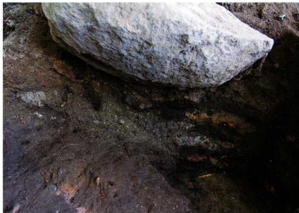
岩陰部 19 北東壁土層断面