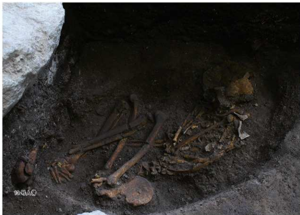
12号人骨出土状況 第1面（北西から）