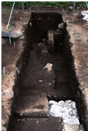
前庭部緩斜面 A トレンチ 第 4 次調査終了時検出面