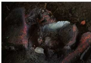
10号人骨寛骨付近 スクレイパー出土状況 (北から)