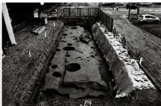
(2) 北端部全景 (南西から)