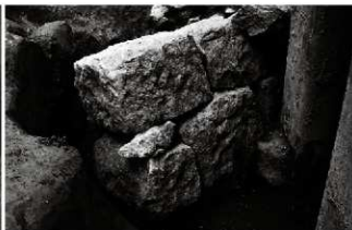
(3) 石垣 156-161 下層 (南西から)