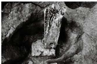
(1) 柱穴 065-53 (南西から)