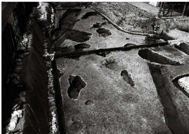
(1) V街区古代面（北東から）