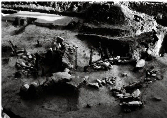
(2) 池状遺構 156-52 の木組・石組検出状況 (西から)