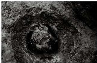
(6) 土坑 153-84 漆桶出土状況 (南西から)