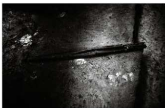
(6) 竹樋 2 (北東から)