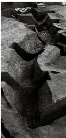
(7) 溝 154-49 (西から)