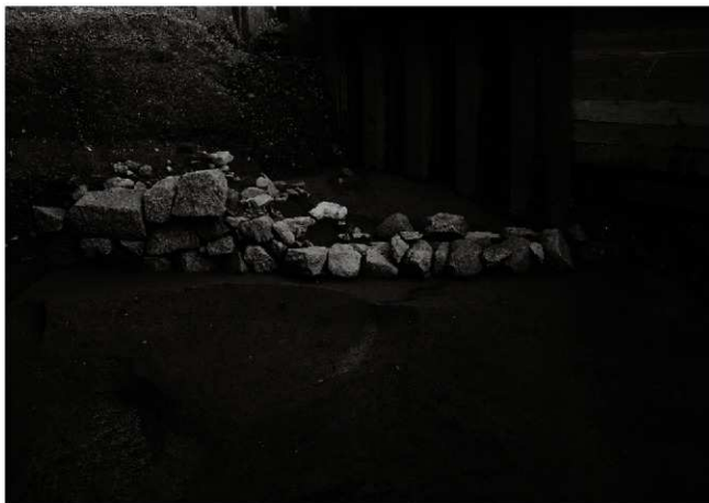
(2) 割場西面石垣（南から）