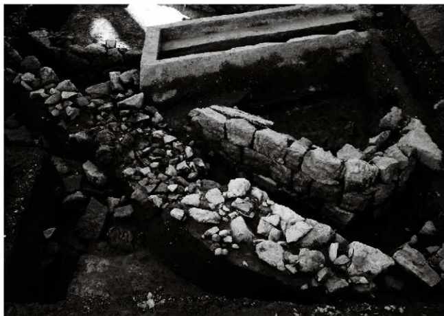
(1) 区画溝 156-144・145 (北東から)