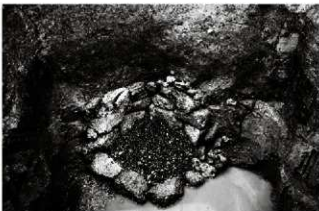
(4) 石組井戸 154-74 (南東から)