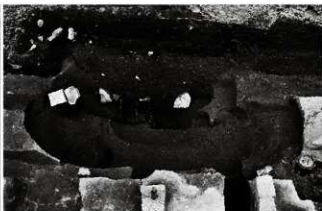
(6) 井戸 153-115 (南東から)