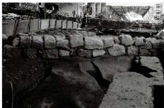
(1) 松原南面石垣 154-52 (南西から)