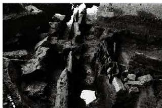
(3) 区画溝 156-144 割木組 (北から)