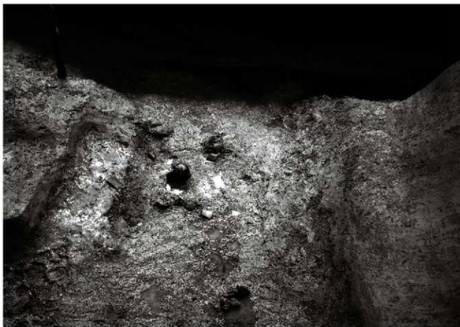
(2) 溝 155-15 (北西から)