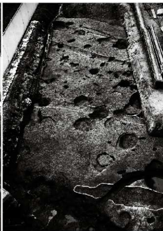
(4) 下層全景 (北西から)