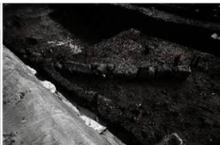
(5) 石列 155-6 (西から)