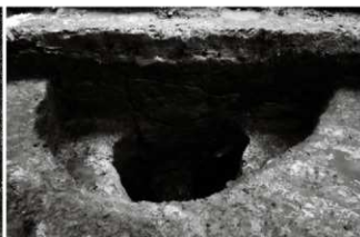
(2) 井戸 156-115 (北西から)