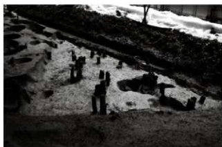
(4) 土坑 156-14 (西から)