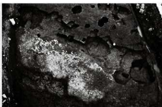
(8) 砂利敷道 065-124 (南西から)