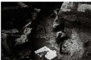
(4) 区画溝 156-153 (北から)