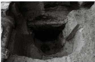
(7) 井戸 153-63 土層断面 (北から)