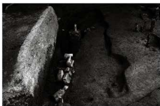
(6) 区画溝 156-148 東半部 (南から)