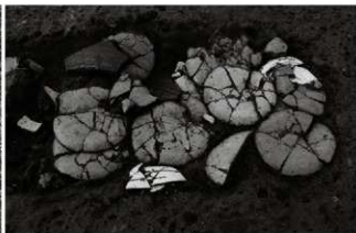
(5) 溝状土坑 153-18 近接 (南東から)