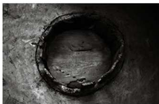
(4) 小穴 156-128 埋設桶検出状況 (西から)