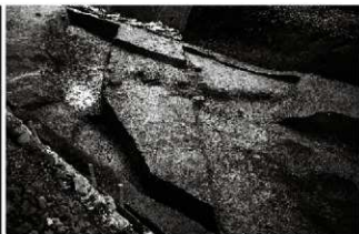
(6) 落込み 154-25 (西から)