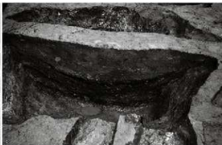
(4) 廃棄土坑 065-102 (西から)