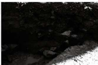
(8) 区画溝 156-144・153 土層堆積状況 (北西から)