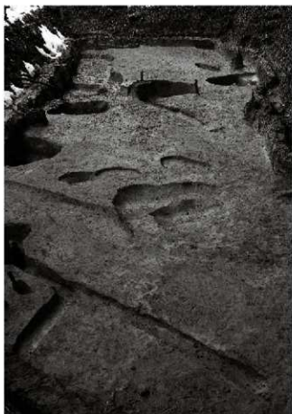
(1) 屋敷地Ⅵ-1 (北東から)