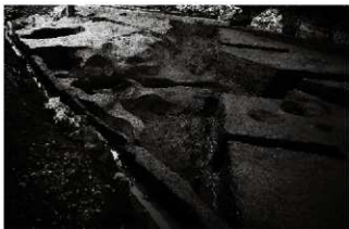
(7) 自然流路 154-10 (東から)