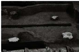
(3) 礎石列 153-95 (南東から)