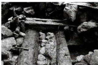
(5) 割場北面石垣 154-12 剥木検出状況 (西から)