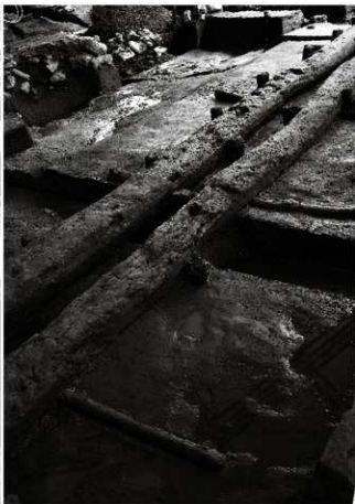
(6) 割場北面石垣 154-12 剥木検出状況 (南西から)