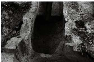
(2) 土坑 153-12 (南西から)