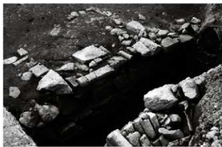
(1) 石組水路 065-2 (南東から)