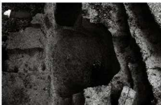
(3) 土坑 153-13 (南西から)