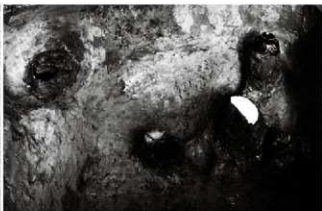
(3) 土坑 156-108 遺物出土状況 (南東から)