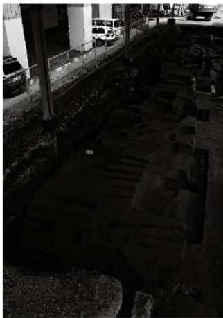
(1) 3区全景 (南西から)