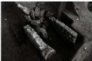
(2) 石組溜橋 153-81 (南東から)