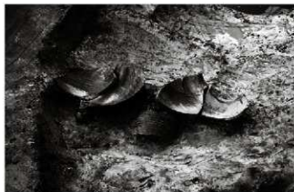
(2) 土坑 156-67 遺物出土状況 (北から)