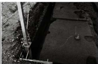
(7) 溝 153-24・25 (北から)