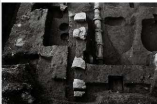
(3) 礎石列 153-49 (北東から)