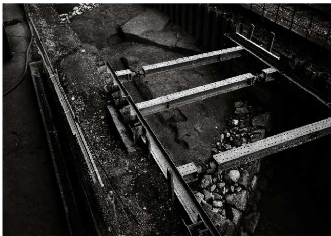
(1) 土橋遠景 (西から)