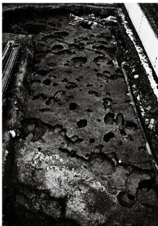
(1) 上層全景 (南東から)