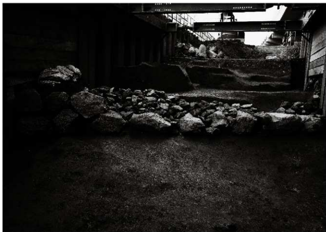
(1) 中之馬場北面石垣（北から）