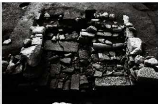
(6) 洗い場 065-121 (北から)