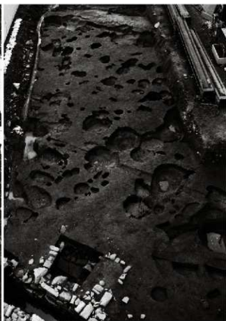
(2) 上層全景 (北西から)