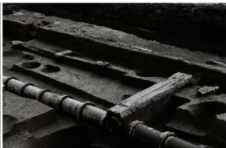
(4) 礎石列 153-89 (西から)