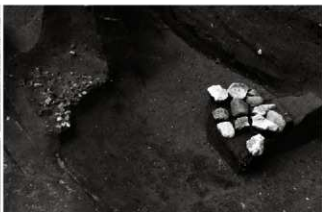
(2) 土坑 153-105 石組 (南から)