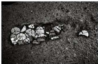
(4) 溝状土坑 153-18 (北西から)