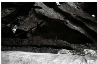
(7) 土坑 155-86 (北西から)