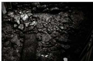
(4) 土橋南面石垣崩落状況 (南から)