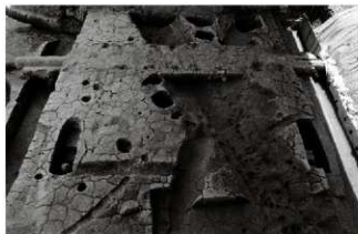
(2) V街区古代面（北東から）