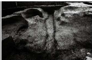
(8) 溝 154-26 (北から)