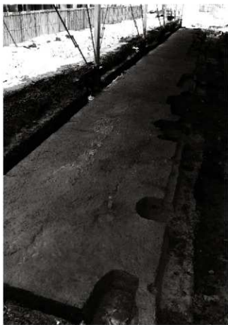
(1) 砂利敷道路 153-1 2区 (北から)