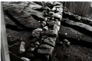
(2) 松原南面石垣 154-52 (西から)