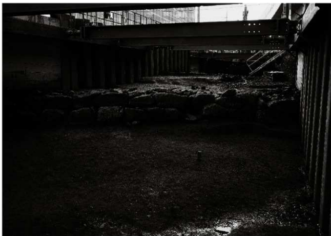
(1) 土橋北面石垣（北から）