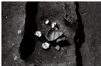
(5) 土坑 132-1 遺物出土状況(北東から)