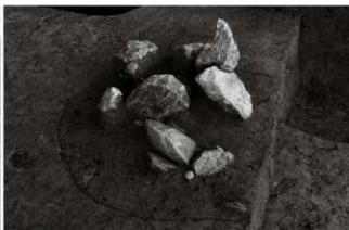
(2) 土坑 153-38 (南から)