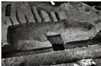
(6) 畝状遺構、土坑 153-59・60・61 (南から)