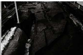
(2) N街区中世面 (北東から)