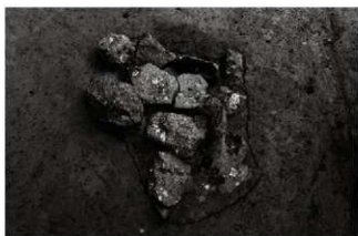
(6) 小穴 153-23 (南から)