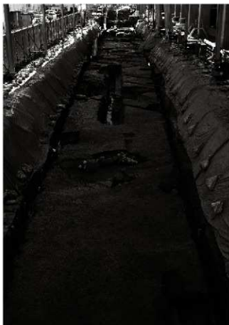
(1) 調査区全景 (北東から)