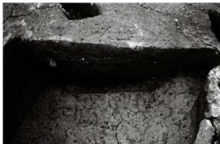
(3) 廃棄土坑 065-43 (南から)