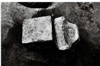
(8) 井戸 153-115 石塔出土状況 (東から)