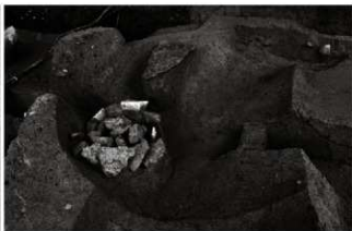
(5) 土坑 153-44・薬石 153-74 (東から)