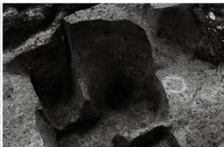
(5) 小穴 153-9 (南東から)