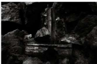
(2) 区画溝 156-144 暗渠 (西から)