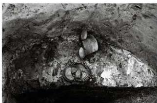
(7) 土坑 155-88 遺物出土状況 (北西から)