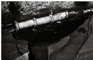
(5) 土坑 153-113 (南東から)