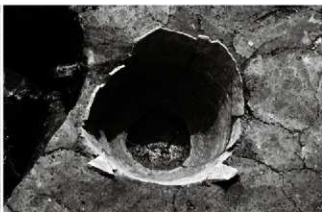
(2) 埋甕 065-83 (北から)