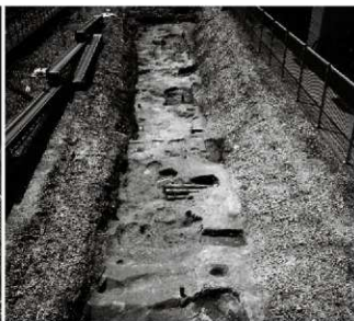
(2) FKJ13-1調査区南半部全景(北東から)