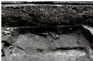
(4) 竈室土坑 131-1 (北西から)