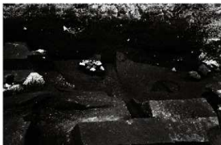
(1) 土坑 153-105・石組溝 153-106 (南東から)