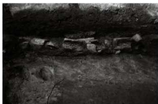
(4) 区画溝 156-148 東側石列 (北東から)