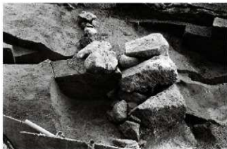
(3) 松原南面石垣 154-52 断面 (西から)