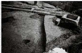
(4) 溝 154-8 (西から)