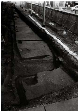
(1) 砂利敷道路 153-1 1区 (南西から)