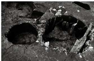
(5) 雙所跡 065-3・1 (南から)