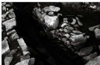
(7) 石組水路 065-2 (南西から)