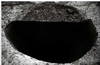
(4) 土坑 155-16 (北西から)