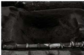
(5) 土坑 153-84 (南東から)