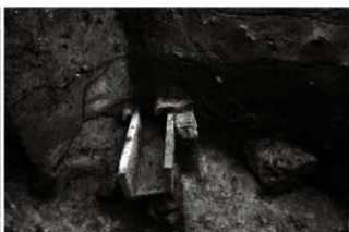
(6) 区画溝 156-153 暗渠2 (西から)