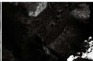
(7) 区画溝 156-148 南西端 (南西から)