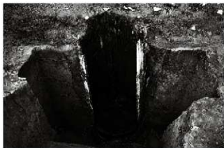
(2) 井戸 156-7 井戸欄断ち割り状況 (南東から)