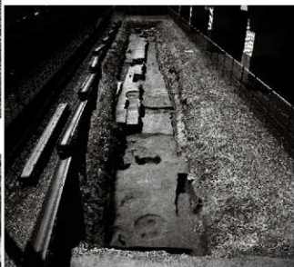
(3) FKJ13-2調査区全景(北東から)