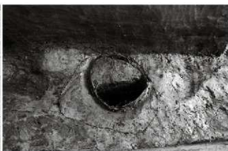
(5) 井戸 154-73 曲物出土状況（北東から）