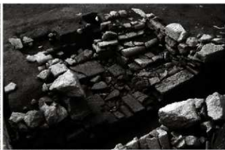
(2) 洗い場 065-121 (南東から)