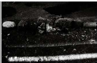
(3) 石列 156-152 (東から)