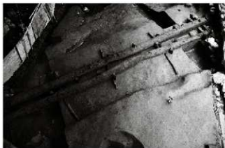
(4) 割場北面石垣 154-12 剥木検出状況 (南西から)