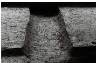
(6) 溝 153-15 (北西から)