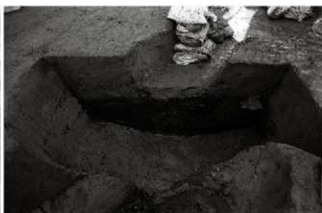
(4) 廃棄土坑 154-33 土層断面 (南から)