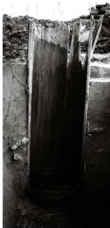
(5) 井戸 154-9 井戸側半截状況 (南西から)