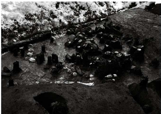
(1) 土坑 156-14 遺物出土状況 (北から)