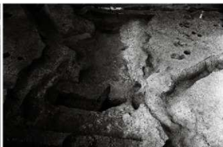
(2) 溝 155-57・113・114 (南東から)