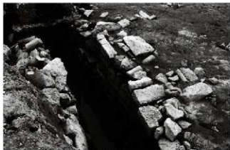
(3) 石組水路 065-2 (北西から)