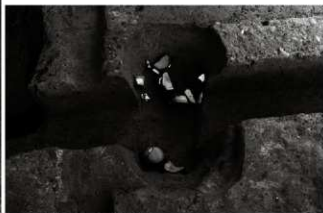
(3) 土坑 153-19 (南西から)