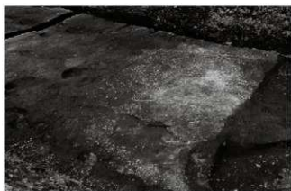
(7) 砂利敷道路 153-1 B2区 (東から)