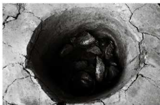
(4) 小穴 154-109 上層遺物出土状況（南東から）