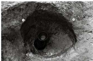
(3) 土坑 154-34 遺物出土状況 (南西から)