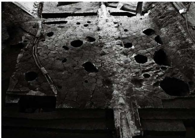
(2) V街区近世・中世面 (北西から)