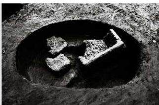
(5) 小穴 156-142 遺物出土状況 (西から)