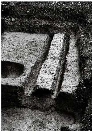
(4) 暗渠 153-14 (西から)