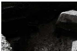
(7) 区画溝 156-153 掘方 (北から)