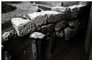
(2) 石垣 156-161 上層 (南西から)