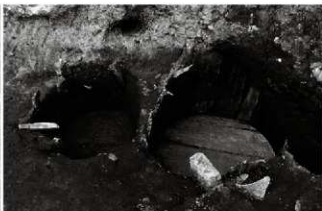
(6) 雙所跡 065-61・62 (南東から)