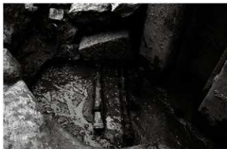
(4) 石垣 156-161 下層割木組 (西から)