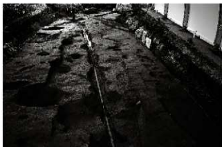
(1) N街区近世・中世面 (北東から)