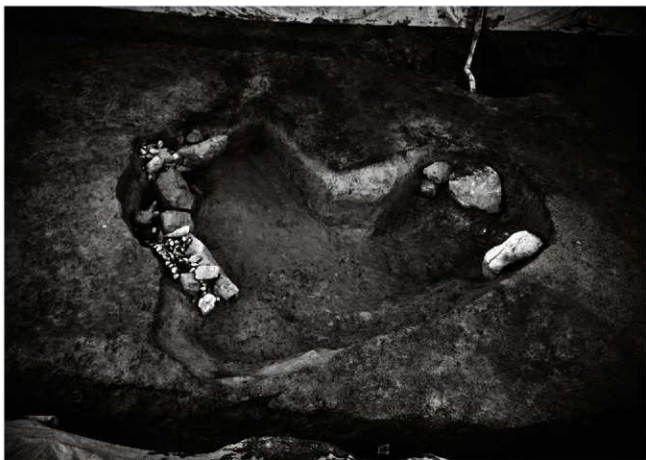
(1) 池状遺構 155-18 (南東から)