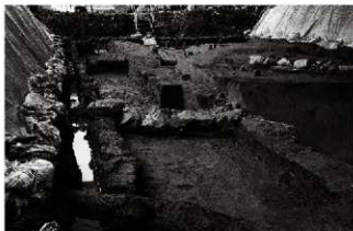
(4) 石列 155-38 (北から)