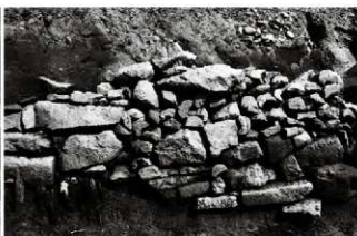
(8) 石組水路 065-2 西岸・洗い場 065-121 対岸 (西から)