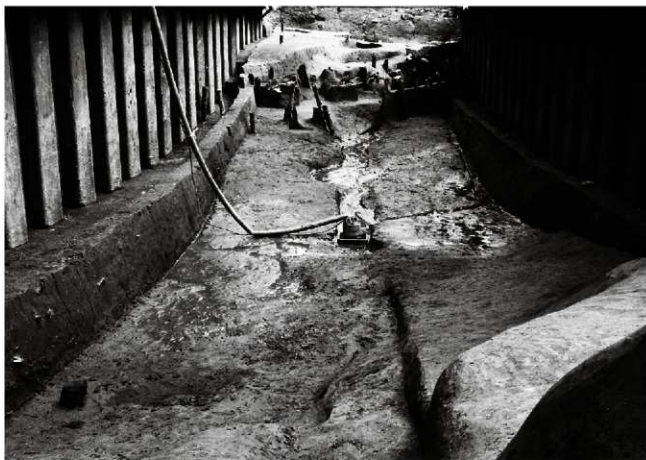
(1) 外堀 156-156 (南西から)