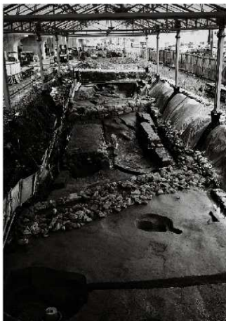
(1) 割場北壁 154-53 完掘状況 (南西から)