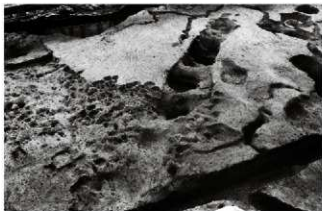
(3) 溝 155-30 (北から)