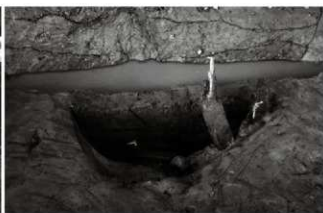
(5) 土坑 156-54 (南東から)