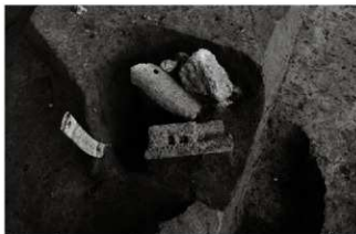
(4) 土坑 153-50 (南から)