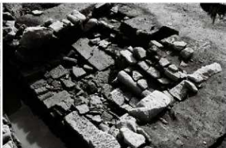
(4) 洗い場 065-121 (北西から)