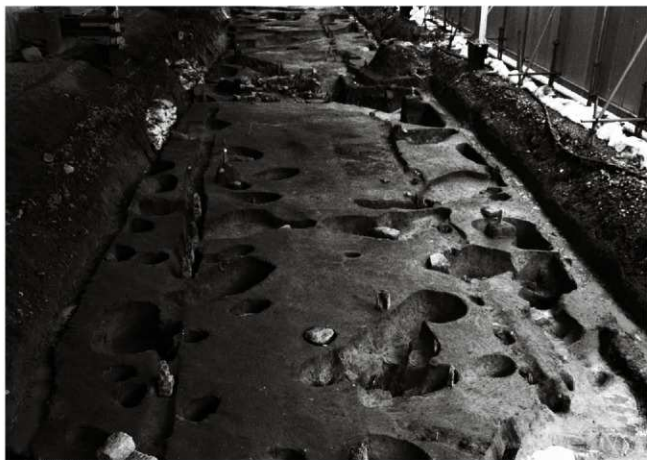
(1) 屋敷地罫-1 (南西から)