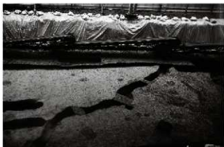
(1) 溝 155-13・84 (南東から)