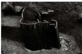
(7) 井戸 153-115 井戸側 (南東から)