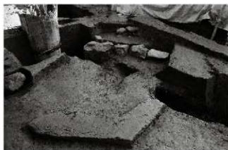
(3) 土坑 154-43 (西から)