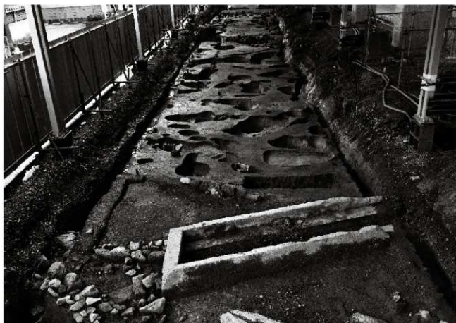
(1) 屋敷地罫-2 (北東から)