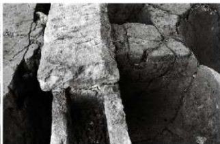
(3) 導水管 154-130 部分（西から）