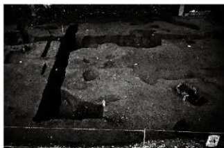
(1) III街区近世上面全景 (南東から)