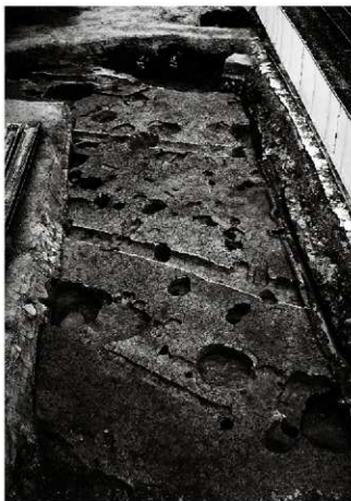
(3) 下層全景 (南東から)