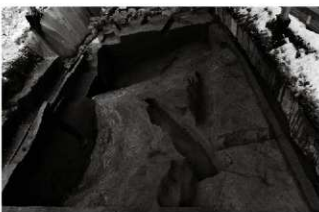
(8) 河川 154-69 (北東から)