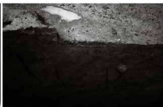
(5) 土橋土層断面・噴砂 (東から)