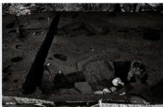
(2) III街区近世下面全景 (南東から)