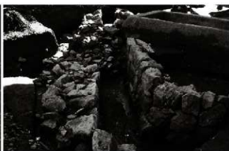
(5) 区画溝 156-144 (北から)