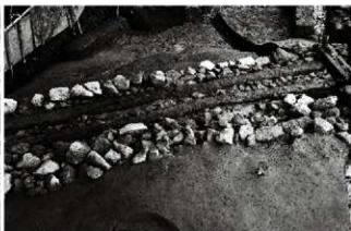
(2) 割場北面石垣 154-12 剥木検出状況 (南西から)