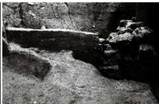
(5) 石垣 156-161 の断ち割り状況 (西から)