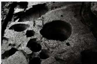
(3) 中央部 H1 区付近 (北東から)