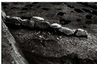
(7) 石列 065-135・砂利敷道 065-124 (西から)