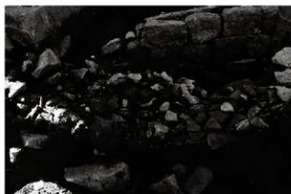
(1) 区画溝 156-144 の築石と暗渠 (東から)