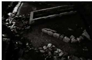
(2) 砂利敷道路 156-151・区画溝 156-144 (北東から)