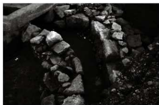
(4) 区画溝 156-145 (南東から)