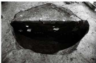
(6) 土坑 155-139 (南から)