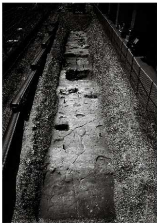
(1) FKJ13-1調査区北半部全景(北東から)