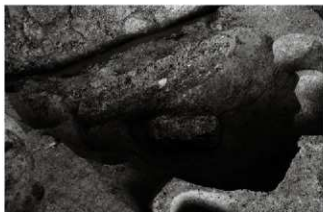
(1) 土坑 153-55 (南東から)