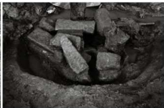
(3) 井戸 156-55 (南東から)