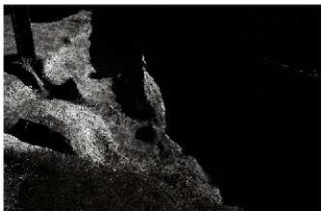
(5) 溝 154-36 (西から)