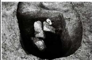
(3) 土坑 156-112 (南東から)