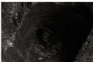
(8) 井戸 155-72 遺物出土状況 (南西から)