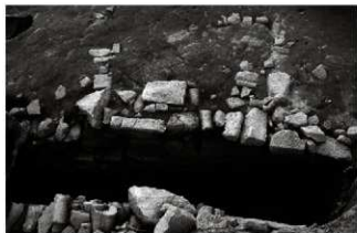
(5) 石組水路 065-2 (北から)