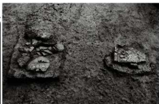
(2) 埴前夾敷 153-17 (南西から)