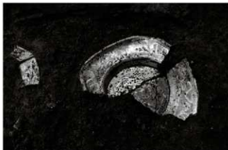
(3) 土坑 153-105 遺物出土状況 (東から)