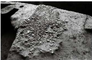
(6) 道路砂利敷 154-63 (西から)