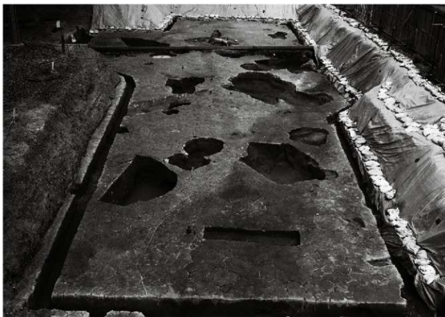
(1) V街区近世・中世面 (南西から)