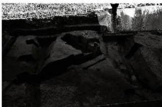
(7) 道路遺構 154-63・64・67・68 (北西から)