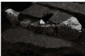
(8) 石組溝 153-106 (東から)