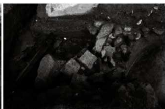
(5) 区画溝 156-148 西側石列 (南東から)