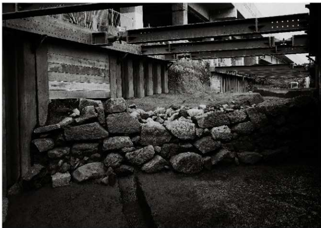
(2) 土橋南面石垣（南から）