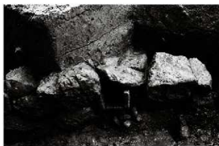
(5) 区画溝 156-153 暗渠1 (西から)