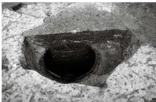
(5) 井戸 155-63 (南東から)