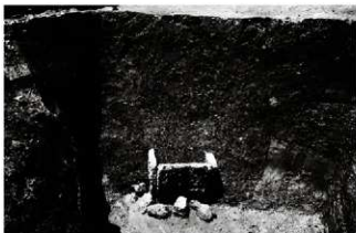
(5) 井戸 154-100 (南東から)