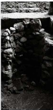
(6) 井戸 154-46 石組半截状況 (北西から)