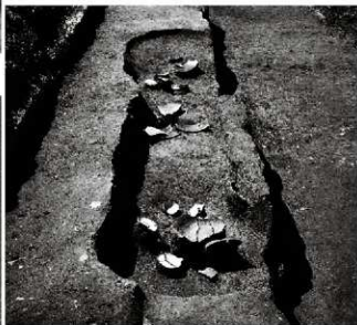
(6) 土坑 132-1 (北東から)