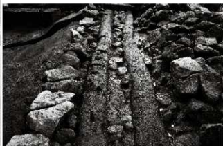
(3) 割場北面石垣 154-12 剥木検出状況 (西から)