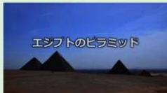
エジプトのピラミッド