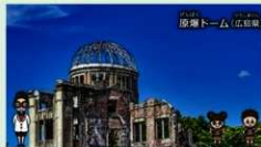
例) 広島平和記念碑(原爆ドーム)

例) メンフィスとその墓地遺跡 -ギーザからダハシュールまでのピラミッド地帯<エジプト>