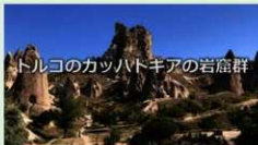
トルコのカッパドキアの岩窟群