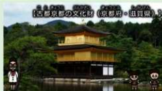
例) 古都京都の文化財