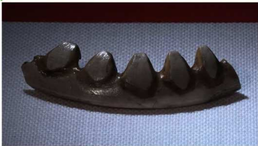
イノシシの牙【入江貝塚 (洞爺湖町)】