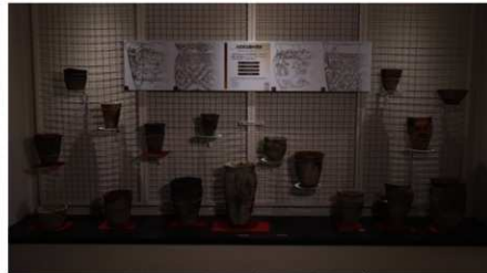
出土した土器 (入江式土器)