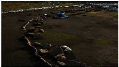
環状列石 (鷲ノ木遺跡)