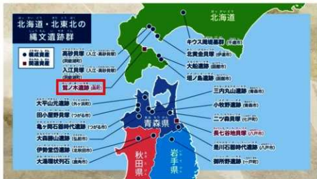
鷺ノ木遺跡の場所