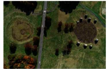
環状列石 (大湯環状列石)