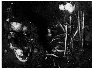
筋萎縮症にかかった男性の埋葬

入江貝塚からは、貝だけではなく、魚や動物の骨がたくさん見つかっています。また、獲物を獲るための道具も見つかっており、狩りや魚とりが活発に行われていたことが分かります。貝塚の中で見つかったお墓に埋葬されていた一人の男性は、筋萎縮症※のために寝たきりの生活でしたが、20歳頃まで周りの手助けを受けながら暮らしていました。