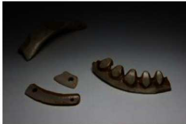
イノシシの犬歯を素材とした装身具