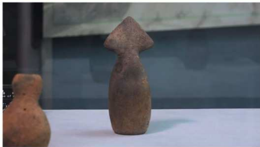
錐形土製品【鷺ノ木遺跡 (森町)】

このころ、北海道には生息していないイノシシの骨や牙が北海道内の遺跡から見つかるようになります。入江貝塚では、イノシシの牙を素材にして作ったアクセサリーが見つかっていて、儀式などに使われたと考えられています。このことから北海道に住む縄文人が、海をこえて本州にわたり、イノシシを手に入れていたことがわかります。