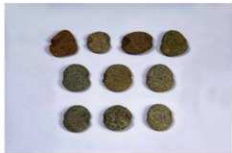
石錘 【垣ノ島遺跡 (函館市)】

矢じりは、弓矢の矢の先に取り付け、中・小型動物の狩猟に使っていることがわかっています。獲物の解体に使うナイフや、毛皮の加工に使うスクレイパーにも、同様の石器制作技術が用いられます。