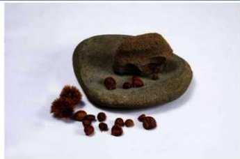
すりしとishi すり石と石皿 おほねいせき はだてし 【大船遺跡 (函館市)】

石で作られた道具を「石器」といいます。石器は、石や動物の骨で素材を打ち欠いて作る「打製石器」と、素材を磨いて作る「磨製石器」の2種類に分けられます。