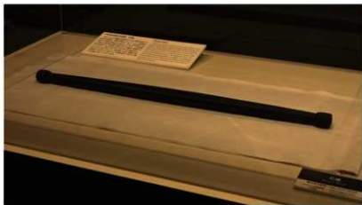
石棒【キウス周堤群 (千歳市)】