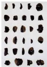
だいたいせき 打製石器 わかば けいせい せき 【若葉の森遺跡 (帯広市)】