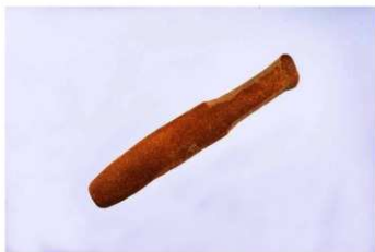
石棒【伊勢堂岱遺跡 (秋田県北秋田市)】

縄文時代の遺跡から見つかる石器の中には、使い方がよく分からないものもあります。例えば、石棒と呼ばれる棒状の石器や、石刀と呼ばれる刀のような形の石器は、儀式やお祈りに使われたと考えられています。