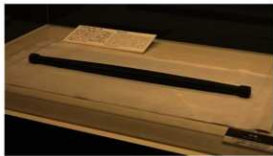
石棒 【キウス周堤墓群 (千歳市)】

動物の骨や、鹿の角 (つ) から骨角器を製作する時にも石器が使われました。石錘 (せきすい) は扁平な石の両端を打ち欠いて網の錘としたもので、網漁も行われていたことがわかります。