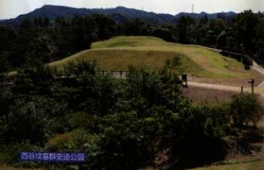
西谷坟群历史公园