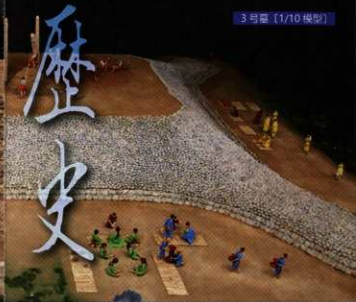
3号墓 (1/10 模型)