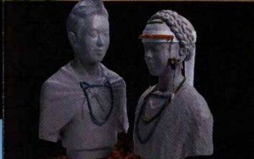
王和女王的青铜复制品