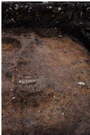
1 SD8ウマ歯列出土状況（南から）