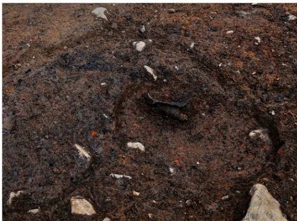
2 SE12上部瓦器羽釜出土状況(南西から)