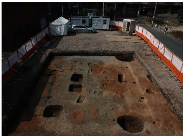
2 2区第2面全景（東から）