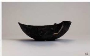
SK76・SE25・SE101・SK102・SE64 出土遺物