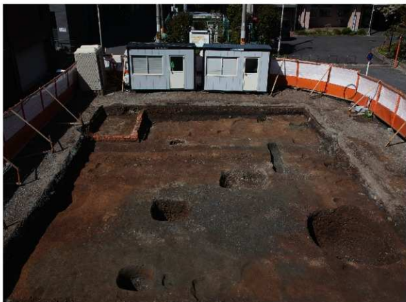
2 3区第2面全景 (東から)