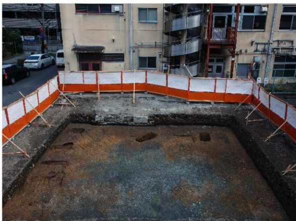
1 1区第1面全景 (西から)