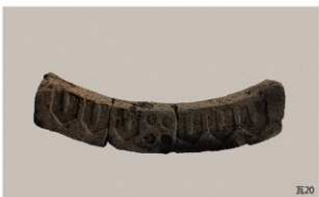
SE64・SE12出土遺物、調査区内出土瓦