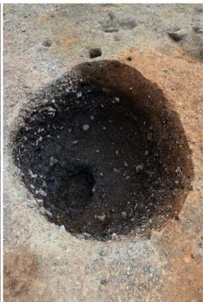
4 SE25曲物除去後（北から）