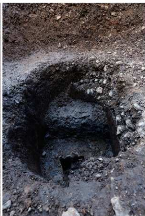
3 SE64木杵内底部断面（東から）