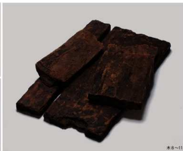
調査区内出土木製品