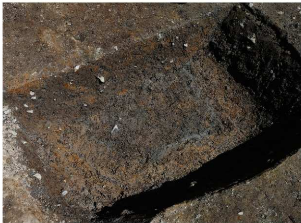
1 SK102南半粘質土検出状況（南西から）