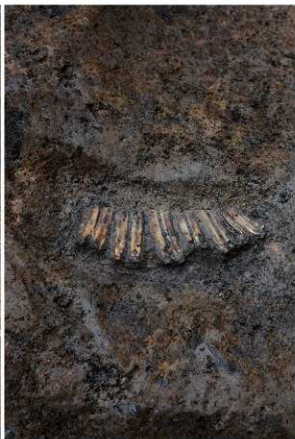
2 SD8ウマ歯列出土状況（南から）