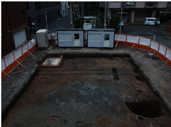
1 3区第1面全景 (東から)