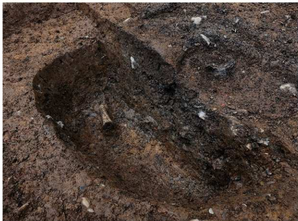
1 SE12白色土器高杯脚部出土状況(南西から)