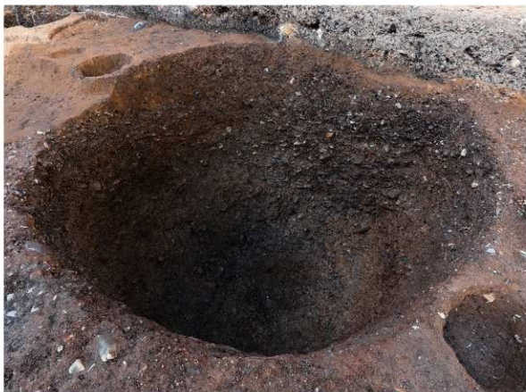
1 SE64完掘状況(南東から)