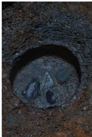
3 SE25底部曲物内（北から）