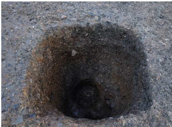
2 SE101完備状況 (南から)