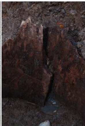
3 SE64 木枠組合わせ部（西から）