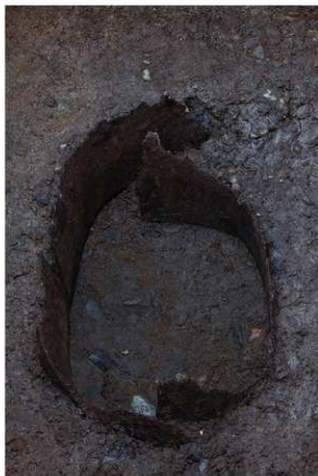
2 SE64 木枠内完掘状況（東から）