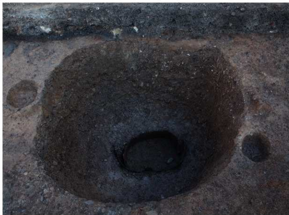
1 SE64 木枠内完掘状況（南から）