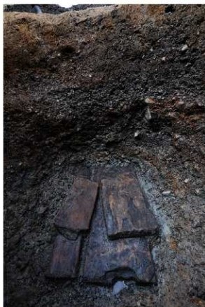
2 SK106底部木材出土状況（南から）