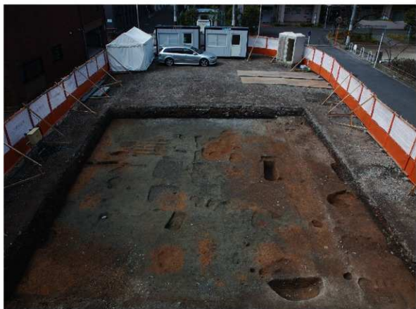
1 2区第1面全景（東から）