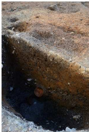
1 SE25土師器皿出土状況（北東から）