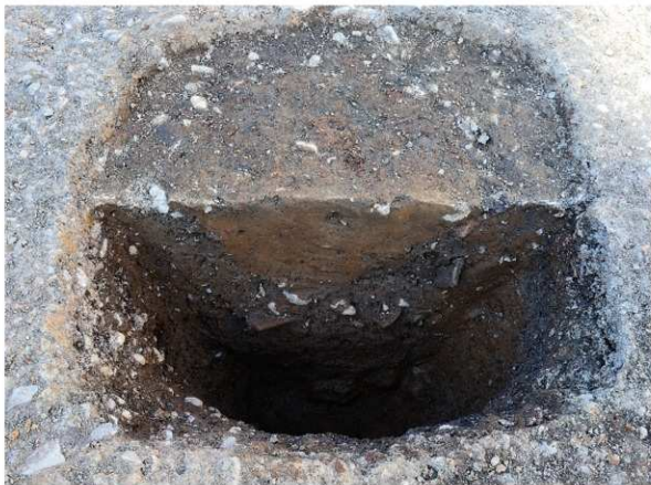
1 SE101断面 (南から)