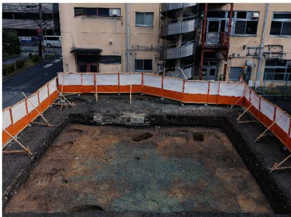
2 1区第2面全景 (西から)