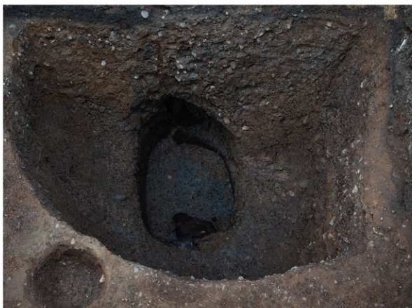
1 SE64木杵検出状況及び断面（東から）