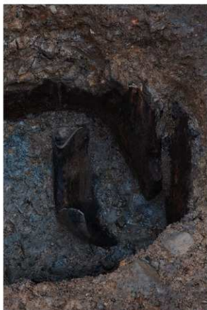
2 SE64木杵内須恵器出土状況（南から）