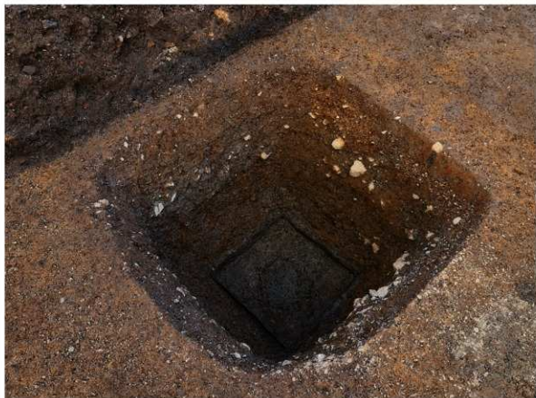
2 SE12完掘状況(北東から)