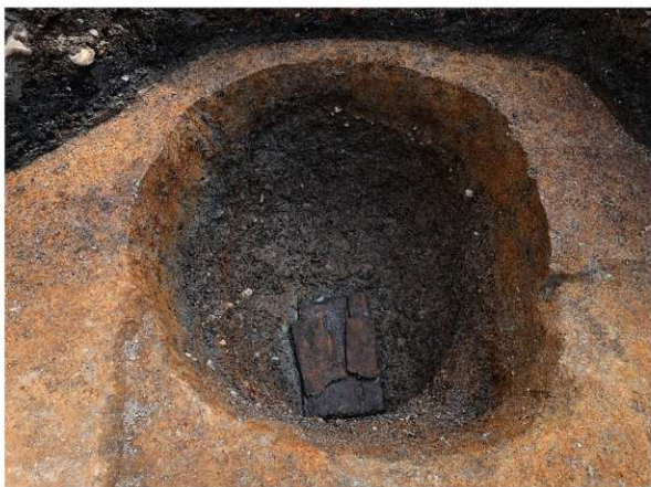
1 SK106底部木材出土状況（北から）