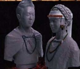
Accessórios restaurados do rei e da rainha

É no complexo de túmulos de Nishidani que os reis de Izumo do período Yayoi dormem há 1.800 anos. Ao lado deste parque histórico está o museu histórico Izumo Yayoi no Mori . Nele a História é explicada através da exposição de objetos escavados do túmulo nº 3 de Nishidani (túmulo dos reis), dioramas e maquetes! Além disso, o museu apresenta as mais recentes descobertas arqueológicas da cidade de Izumo!