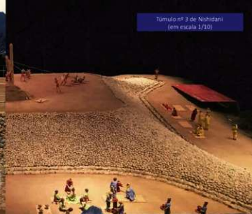
Túmulo nº 3 de Nishidani (em escala 1/10)