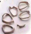
Sito arqueológico Inome Doukutsu (braceletes de concha) [Patrimônio Cultural Provincial]