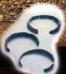
Braceletes de vidro