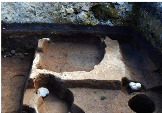
区域2 SK074完掘状況（西から）