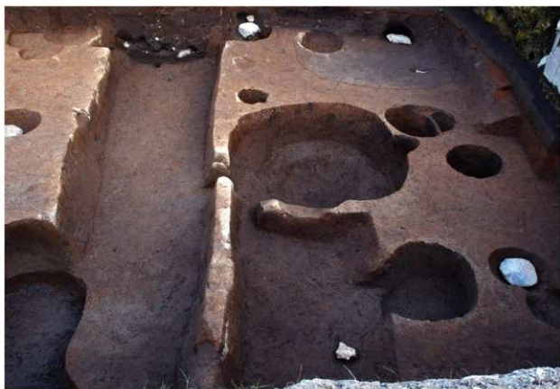
区域2 SK177・SD133完掘状況 (西から)