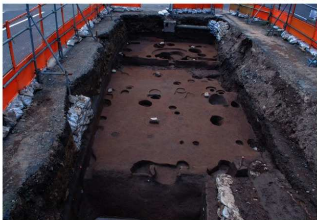
区域2第4面全景（北から）