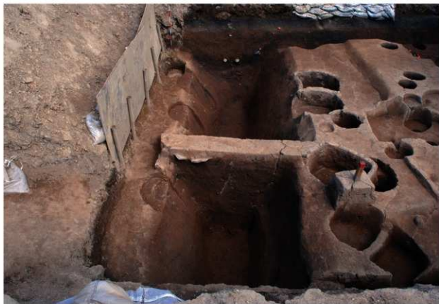
区域2 SD049完掘状況 (西から)