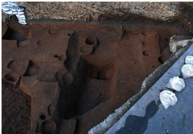
区域1 SD325掘削状況 (南から)