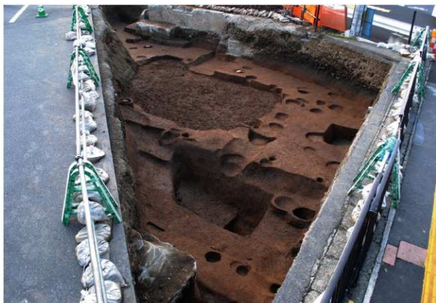
区域1 第3面完掘状況 (東から)