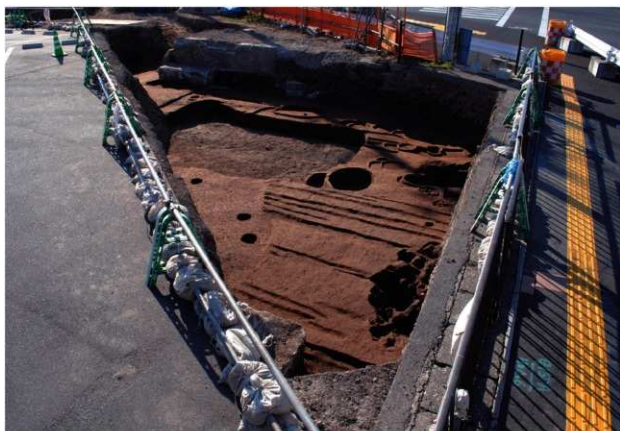
区域1 第1面完掘状況 (東から)