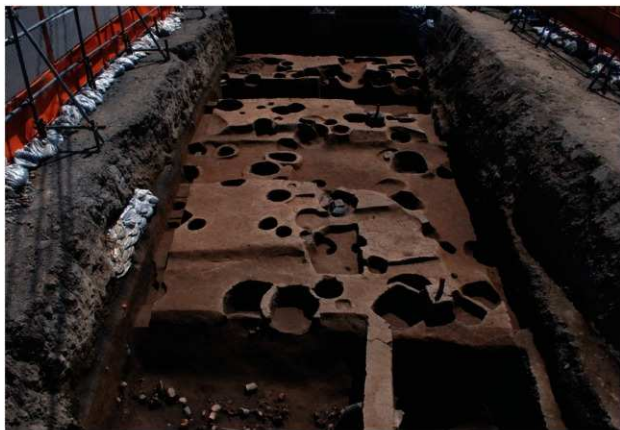
区域2第3面完掘状況(北から)