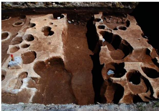
区域2 SD028完掘状況 (西から)