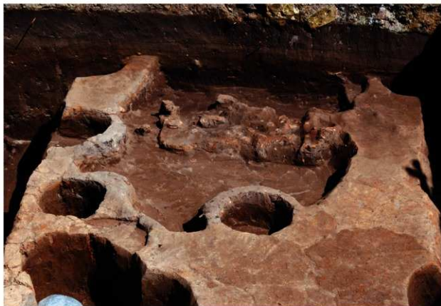
区域2 SK074掘削状況 (西から)