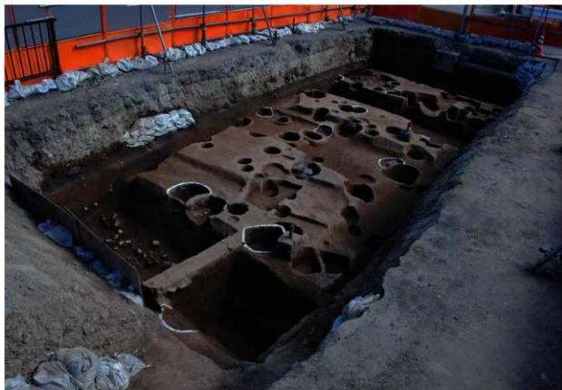
区域2掘立柱建物SB401～SB404完掘状況(北西から)