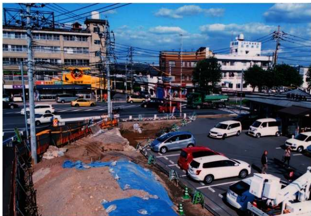
区域1 遠景 (南西から)