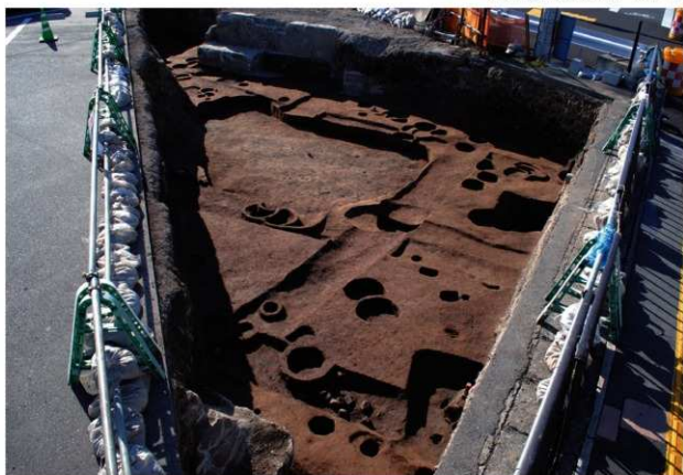
区域1 第2面完掘状況 (東から)