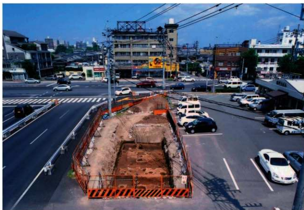
区域2 遠景 (南から)