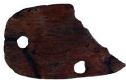
写真図版174 (第88次調査) 下駄(1)