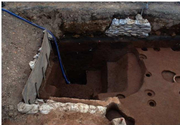
区域2 SE182完掘状況 (西から)