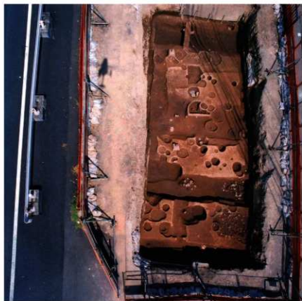
区域2 遠景 (垂直)