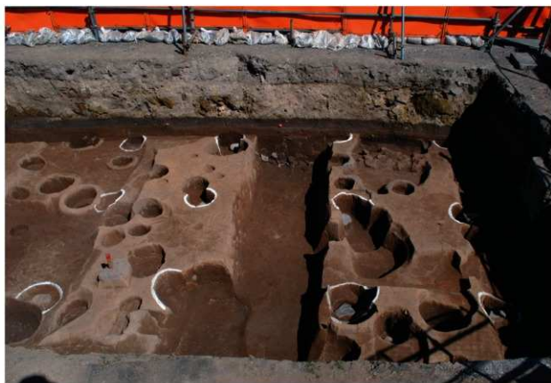
区域2 掘立柱建物 (SB402・SB403) 完掘状況 (西から)