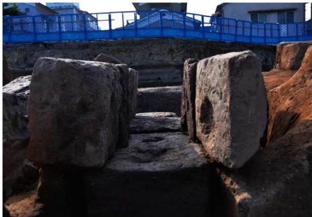
SX206 (天井石を除去した状況：東から)