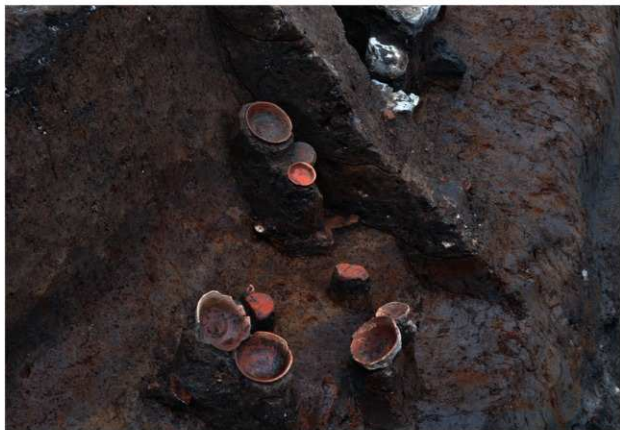
SD181 (遺物出土状況：東から)