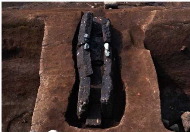
SX208 (天井石を除去した状況)