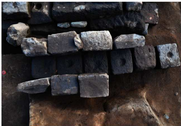
SX206 (天井石を除去した状況)