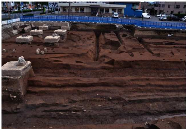
SX208 (完掘後のSD033AやSD120との関係)