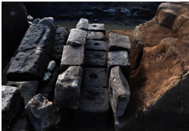
SX206 (天井石を除去した状況)