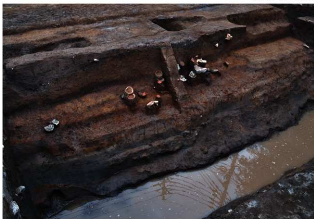
SD181 (遺物出土状況、手前はSD120: 東から)