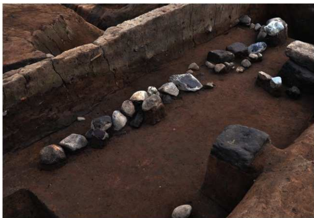
SK207 (検出状況：右側にSX206とSX208がある)