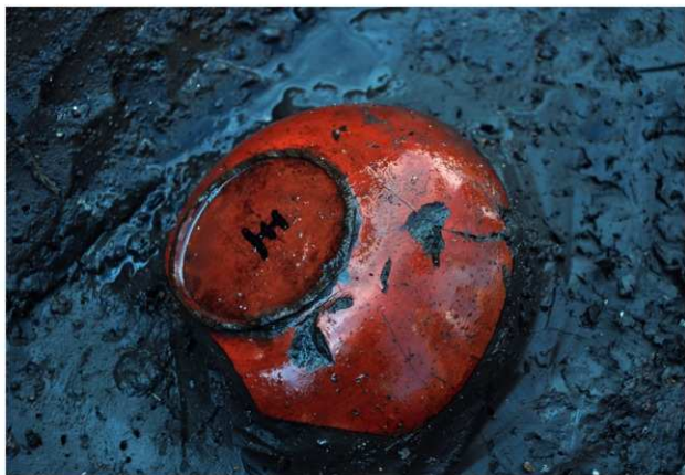
SD120 (「王」銘漆碗1646出土状況)