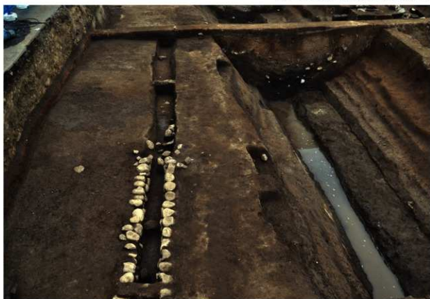
SD142 (完掘状況、右側はSD120：南から)