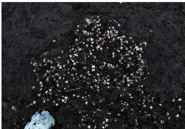
SD120 (食物残滓の貝出土状況)