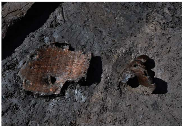
SD120 (ザルと下駄1665出土状況)