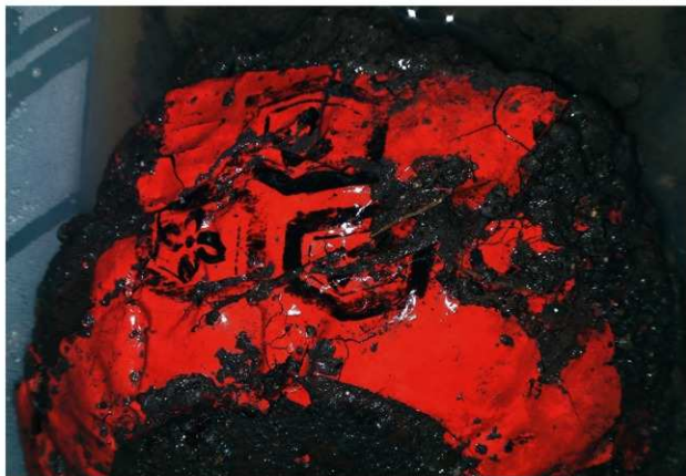
SD120 (出土したばかりの漆碗)