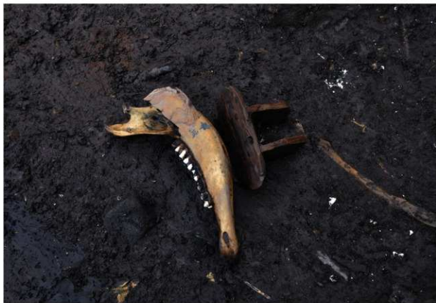
SD120 (牛骨と下駄出土状況)