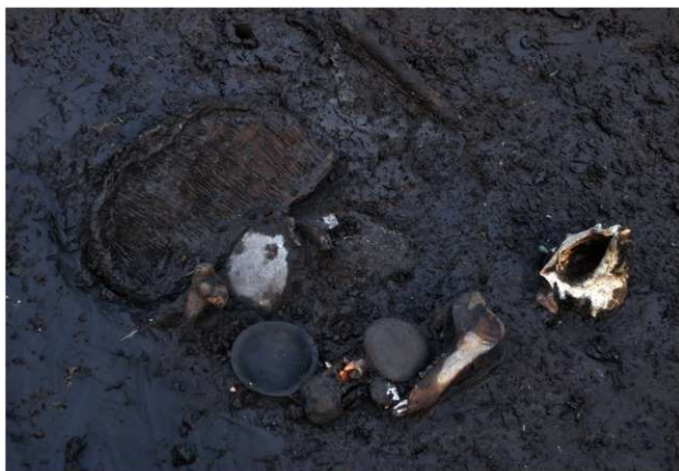
SD120 (ザル、動物骨、サザエ等出土状況)