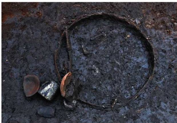
SD120 (タガ、埴塀等出土状況)