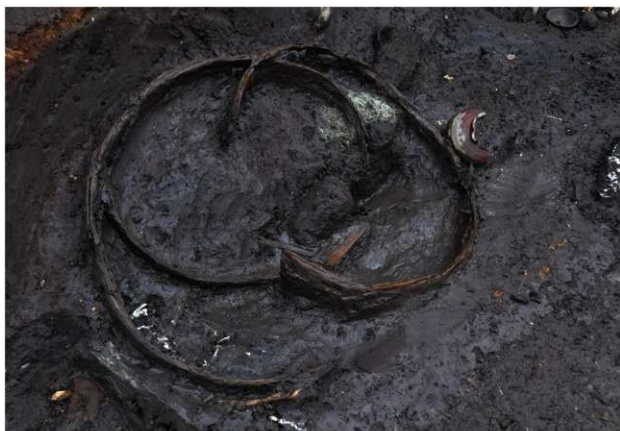
SD120 (タガが重なって出土した状況)