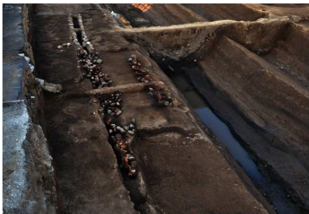
SD142 (全形、右側はSD120：南から)