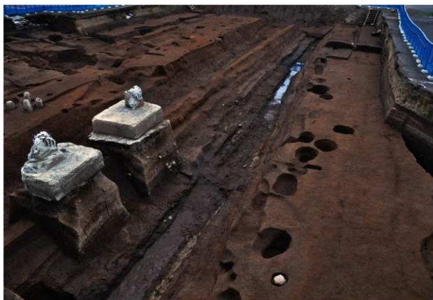
SD120 (完掘状況：北西から)