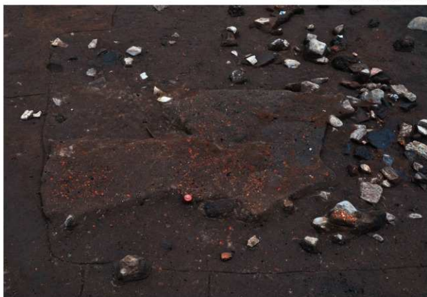
SK101 (上面の焼土の広がり)