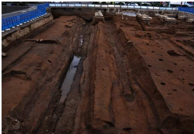
SD120 (完掘状況、左がSD120、右はSD160：南から)