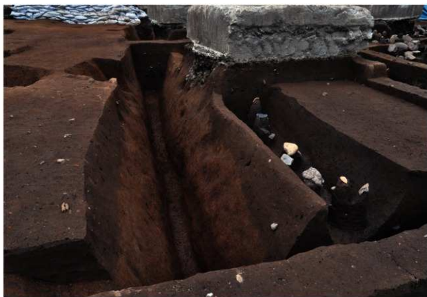
SD060A、B (完掘状況、左がSD060A：南から)