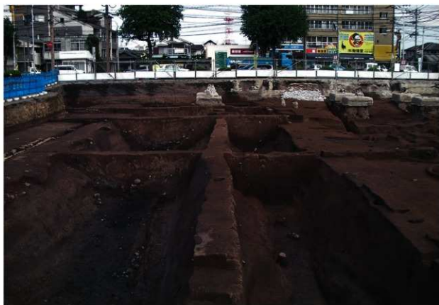
SD120 (完掘状況、右がSD120、左はSD160：北から)