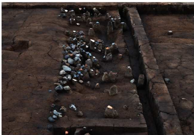
SD071 (遺物出土状況：南から)