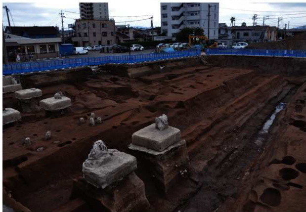
SD120 (完掘状況、手前がSD120：北西から)