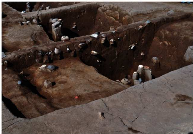
SK101 (土層断面、SD156との関係)