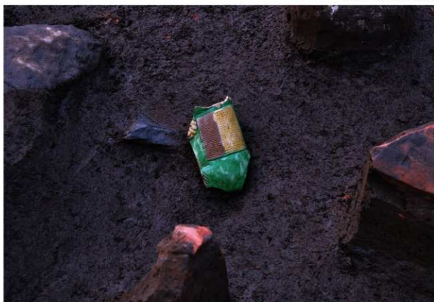
SE070 (華南三彩(119)出土状況)